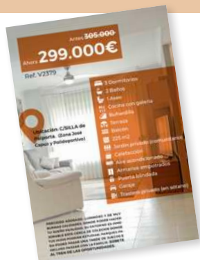
Flyer de vivienda

+ Y muchas acciones más personalizadas para tu vivienda... Pide a tu Agente inmobiliario su Plan de Marketing.