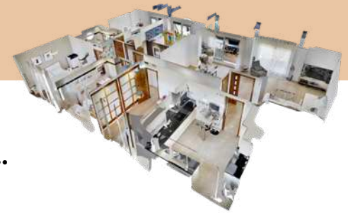
Tecnología 3D inmobiliaria

+ Y muchas acciones más personalizadas para tu vivienda... Pide a tu Agente inmobiliario su Plan de Marketing.