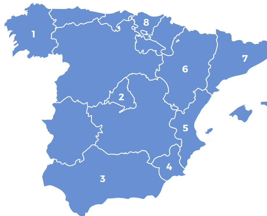
Red provisión médica propia