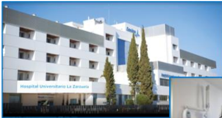
Unidad de Odontología y Cirugía Oral en el Hospital La Zarzuela (Madrid)

Además, contamos con 3 centros dentales propios dentro de centros médicos Sanitas , lo que permite aprovechar el tráfico de clientes Sanitas e incrementar las derivaciones de pacientes con tratamientos de mayor complejidad