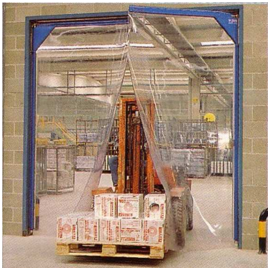
Puerta batiente, acabados en esmalte sintético azul y hojas de PVC transparentes.