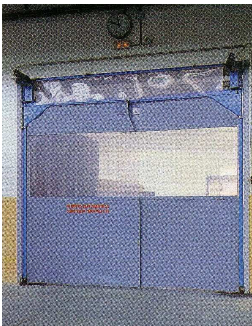
Puerta batiente, acabados en esmalte sintético azul y hojas de PVC en versión doble mixta. Faldón superior de PVC transparente.