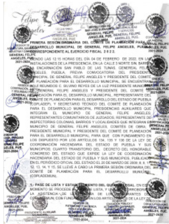
Imagen 2. Acta de Tercera y Cuarta Reunión del COPLADEMUN 2022 General Felipe Ángeles

Por otro lado, se cuenta con el Acta de la Tercera y Cuarta Sesión Ordinaria del Comité de Planeación para el Desarrollo Municipal de General Felipe Ángeles, Puebla, celebrada el 8 de diciembre de 2022. Durante esta sesión, se llevó a cabo la Evaluación Final y la elaboración del informe detallado de las acciones y obras ejecutadas durante el ejercicio fiscal 2022. En este documento se detallan las obras realizadas, los montos asignados y ejercidos, así como sus avances físicos. Este proceso refleja las actividades de seguimiento realizadas en el seno de este órgano colegiado, evidenciando el compromiso y la transparencia en la rendición de cuentas de las acciones emprendidas en el municipio.