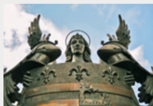
Erb mesta Košice Arpád Račko, 1999