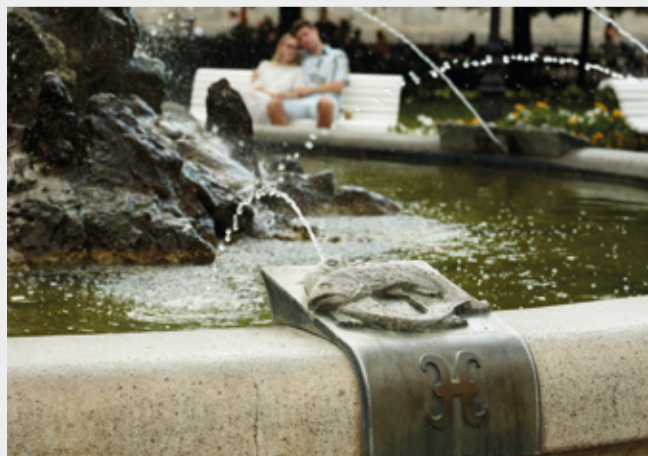
Fontána znamení Arpád Račko, 1995