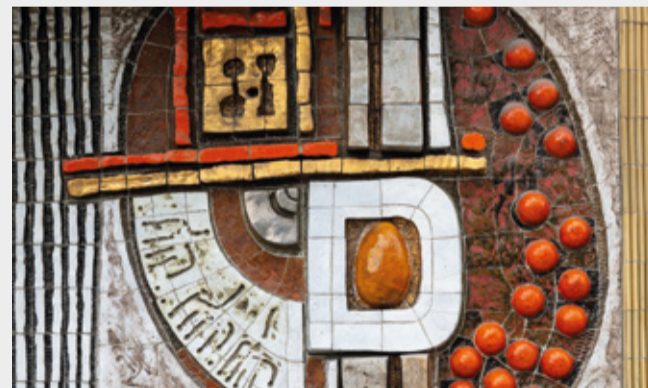
Mozaika Imrich Vanek, 1986