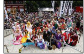
世界コスプレサミットの様子

…世界 20 カ国以上が参加し、自作コスプレ衣装とパフォーマンスで「世界一」のコスプレイヤーを競う「世界コスプレサミット」の日本代表選考会予選を超会議 2 で開催することが決定。事前エントリーによる書類選考か、超会議 2 の 1 日目に開催される敗者復活戦への当日参加によって、代表選考会に参加ができます。また、コスプレサミットの選考会だけでなく、コスプレ専用のクロークと更衣室を用意し、来場者が超会議 2 にコスプレをして参加できる環境も用意します。