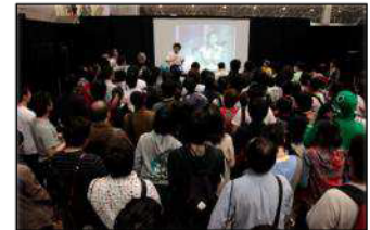
前回開催画像：超多目的スペースの様子

150 名収容、140 インチスクリーン、動画上映用プロジェクター、動画上映&投稿用 PC、音響設備（スタッフ付き）