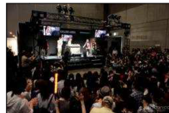
前回開催画像：ボカロエリア ステージ