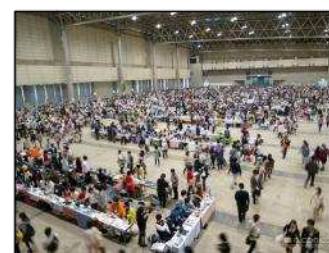
前回開催画像：超ボーマスの様子