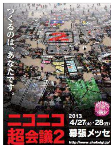
ニコニコ超会議2 キービジュアル

ニコニコ動画のあらゆるカテゴリを網羅するユーザー主体の超巨大イベント。「ニコニコ動画のすべて（だいたい）を地上で再現する」をコンセプトに、2012年4月28日、29日に幕張メッセ国際展示場 1～8 ホールおよびイベントホールで初開催し、会場来場者数 9 万 2384 人、ネット来場者数 347 万 766 人を記録。