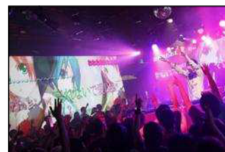
ニコファーレでのボカニコナイトの様子