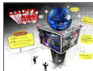
ニコニコタワー（仮） イメージ図

…前回の超会議では、幕張メッセの壁にニコニコ生放送視聴者のコメントを投影し、ネットとリアルを融合した空間を作りました。超会議 2 では、コメントと会場をつなぐためのより進化した仕掛けとして、巨大モニターを配した「ニコニコタワー（仮）」を設置します。タワーの 4 面に設置するモニターには、会場内の LIVE 映像などを放映し、モニターの上部に設置する球体には、ニコニコ生放送のコメントを投影。ホール内のどこからでもタワーを見ることができるため、会場来場者とネット視聴者を映像とコメントでつなぐ架け橋となります。