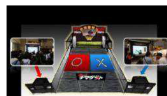
生主用ステージ イメージ

…前回の超会議では、2日間で計 54 名の生放送主がブースからニコニコ生放送を行い、会場来場者とネット視聴者を盛り上げました。超会議 2 では、生放送ブースに加えて「生主用ステージ」を設置し、さらに規模を大きくしてユーザー生放送を楽しめる環境を実現します。また、生主の祭典「ニコナマケット」で活躍する生主から会場の飛び入りまで、あらゆるニコ生好きが一同に集結して楽しむ超全員参加型イベント「生主大感謝祭」や、生主が超舌戦を展開する「超生主討論会」（解説：ひろゆき）も行います。