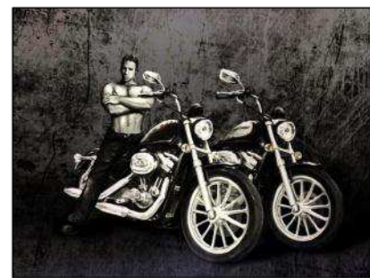
ビリー・ヘリントン