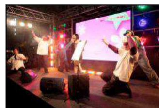
前回開催画像：のど自慢ステージ

…ニコ動人気カテゴリ「歌ってみた」をリアルに再現したのど自慢ステージでは、好きな楽曲をカラオケで歌うことができ、その様子はニコニコ生放送で生中継され、会場来場者だけでなくネット視聴者にも歌声を披露することができます。今回は、「プロが演出する世界一豪華な超のど自慢」として、LEDなどをフル活用した演出を実現。ダンサーの参加も歓迎しており、「ダンサーさん歓迎カード」が出ている時は、バックダンサーとしてステージに乱入することができます。