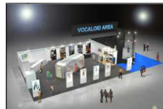
超ボーカロイドエリア イメージ

…前回の超会議でも鉄道ファンから好評を集めた鉄道企画では、まずは大阪-上野間でフルートレイン「ニコニコ超会議号」を運行し、会場への道のりもニコニコ色に演出します。会場では、JR 東日本の全面協力を得て、新幹線 200 系と E1 系の 2 台の公開解体買付けショーを開催。車両基地と幕張を中継で結び、会場で新幹線パーツの限定販売を行います。また、超鉄道エリアに東西の鉄道会社が集結し（小田急電鉄、京阪電鉄、JR 九州、東京メトロの参加が確定）、各社の展示ブースや即売会を行う「鉄道縁日」も開催するほか、およそ 60 体制作されている「鉄道むすめ」の原画及びフィギュアが全国から集合し、一挙展示を行います。