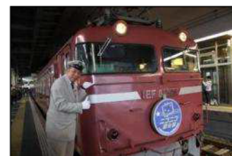
前回開催画像：フルートレイン運行の様子