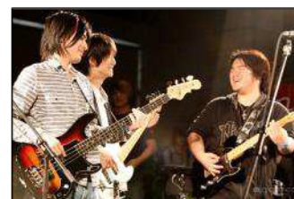
前回開催画像：セッションの様子

…前回の超会議では、「ニコニコ超軽音部ブース」として、ニコ動ユーザーとプロミュージシャンとのバンド形式でのセッションを行いました。今回は「みんなで参加して奏でるブース」をテーマに、音の鳴るものは何でもフル活用し、バンド以外の要素も追加します。「魅せるセッション」、「遊べるアミューズメント」、「学べるレッスン」をコンセプトに多くのプログラムを実施し、楽器が演奏できない人でも簡単に参加することができます。