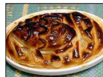
かぼちゃとニシンのパイ