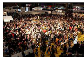
前回開催画像：数百人規模での踊ってみた

…前回の超会議では、ニコ動で活躍する「踊ってみた」ユーザーさんによる振付レッスンのほか、数百人規模で一斉にダンスを行い、ブースが人で溢れかえるほどの大盛況となりました。超会議 2 では、「踊ってみた度」を前年比 1.5 倍に拡大し、「踊ってみたレッスン」、「全国統一踊ってみたオフ」、「踊ってみた耐久レース」、「踊ってみた振り付け選手権」、「地方対抗ソロバトル」の 5 本立てで会場を盛り上げます。