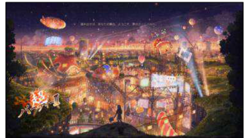
ニコニコ超パーティーⅡ キービジュアル