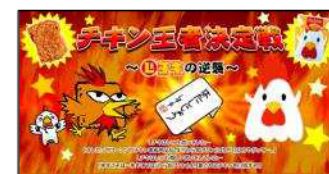
LAWSON L チキコンテスト