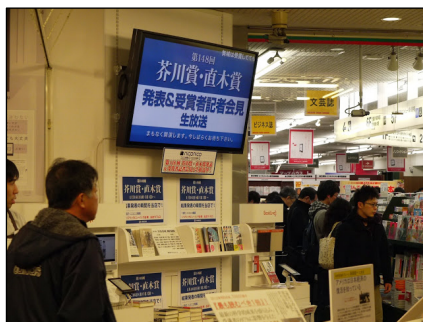
三省堂 神保町本店