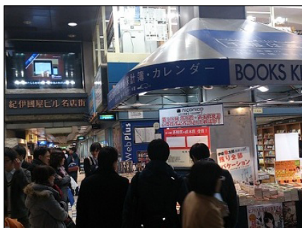
紀伊國屋書店 新宿本店