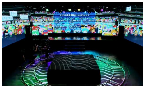
会場の様子 360°壁面にネット観客（アバター）を表示