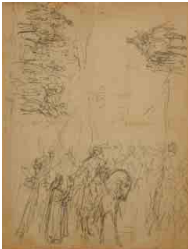
70 – awers