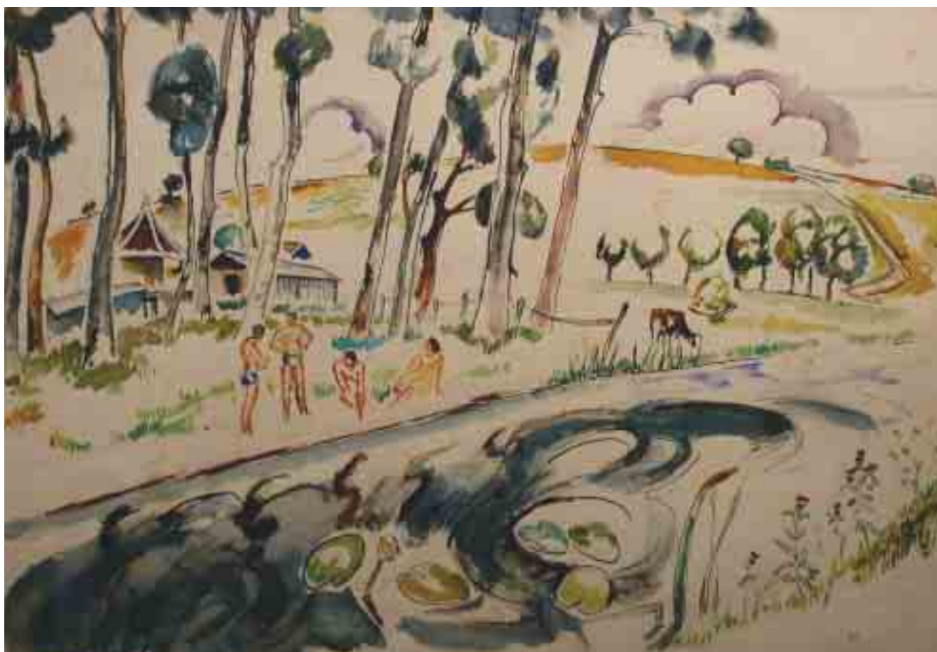
36 – awers