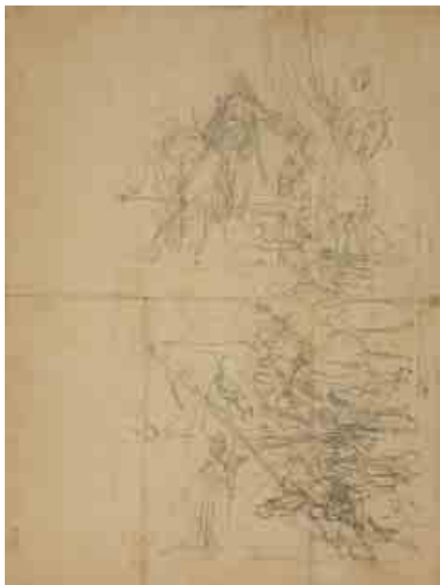
70 – rewers