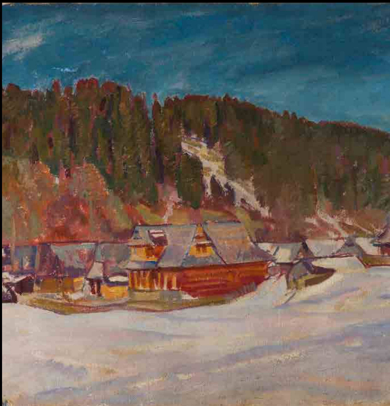
Wojciech Weiss, „Poronin”, 1910 r.