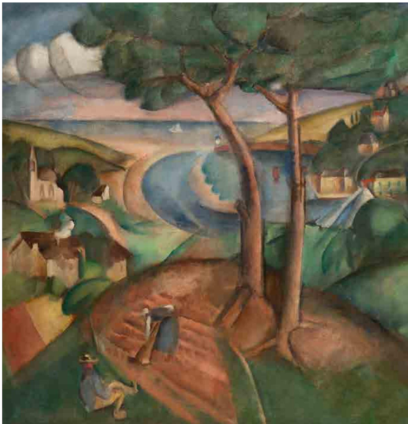
Henryk Hayden, Pejzaż z ujściem rzeki, 1912 r.