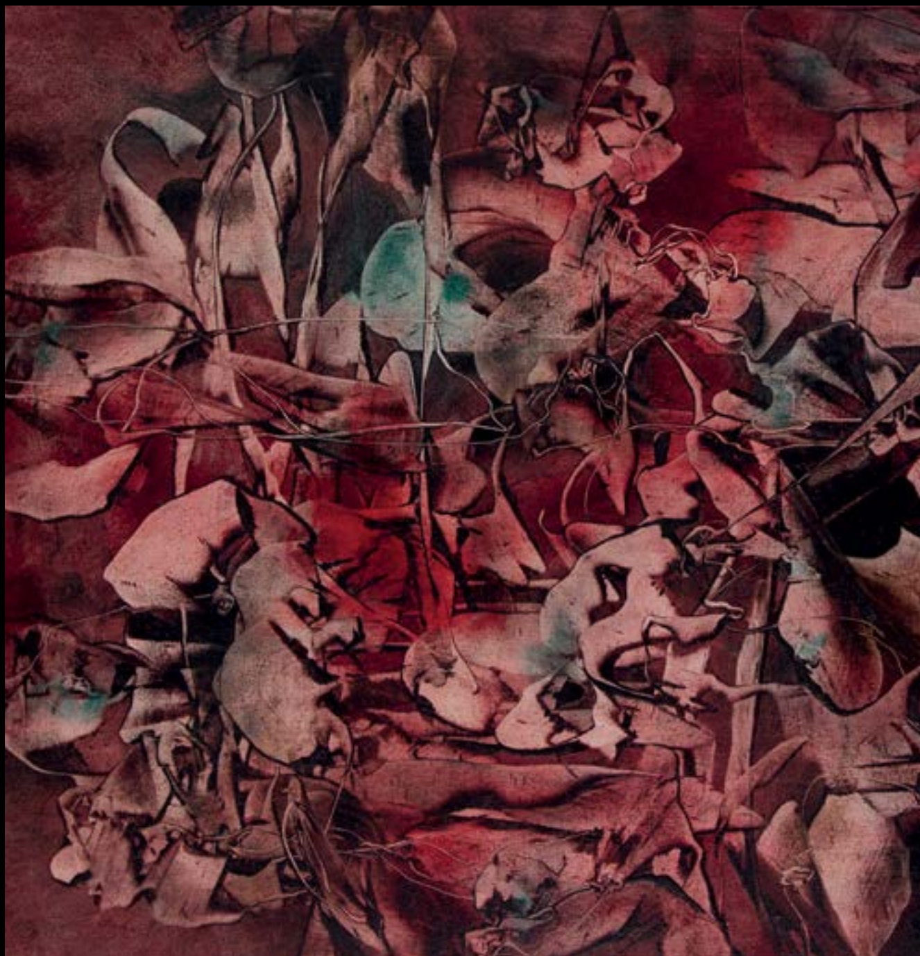
Alfred Lenica, „Obsesja czerwieni”, 1962 r.