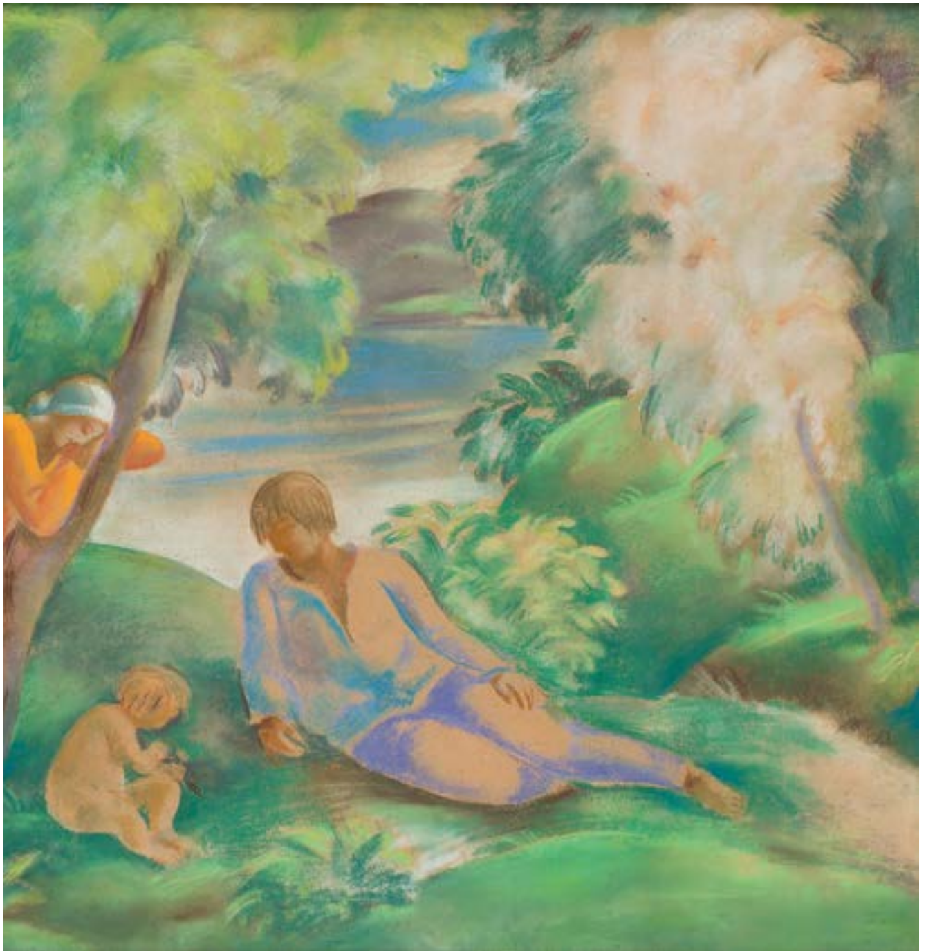
Wacław Borowski, Idylla