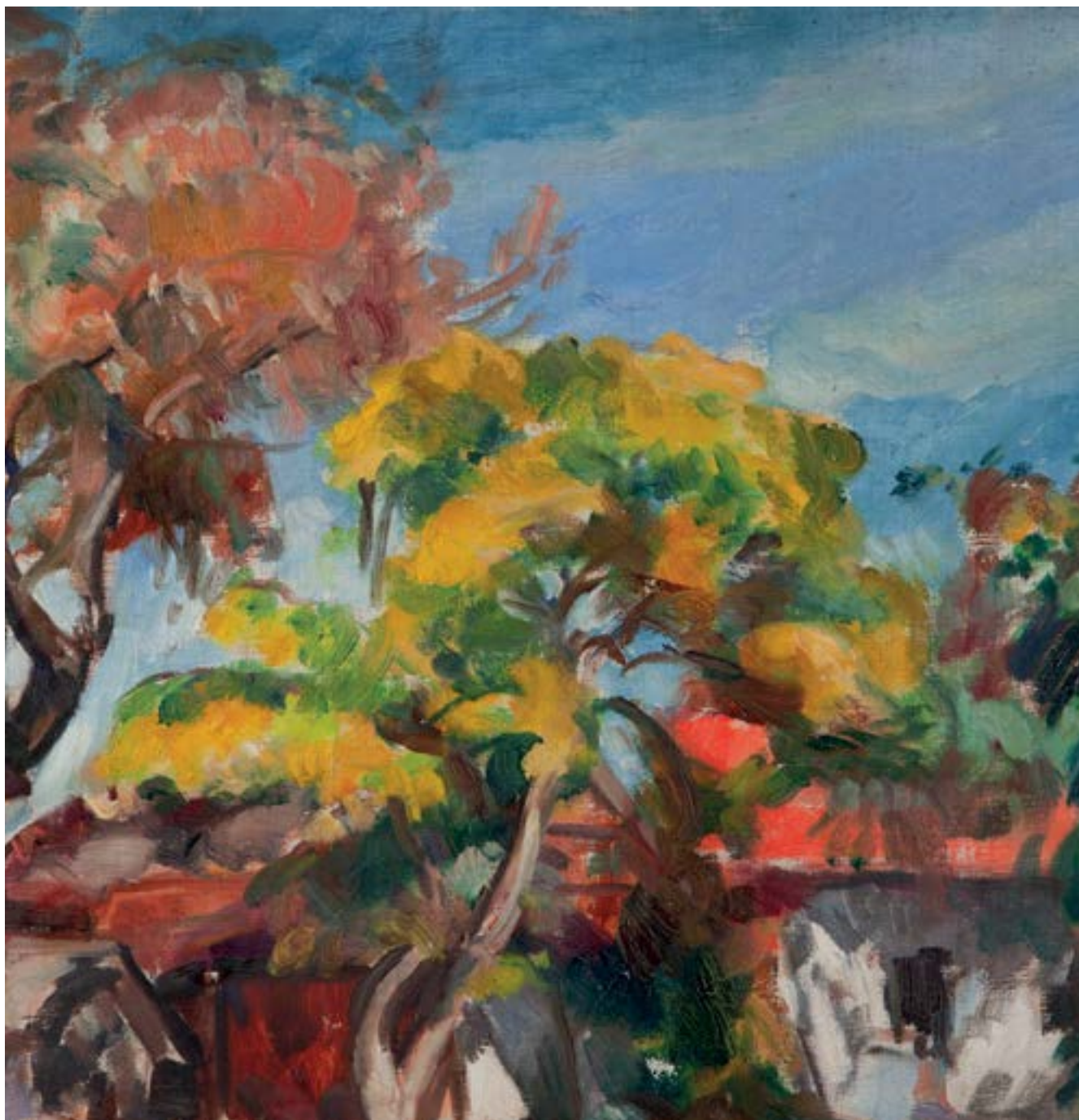
Wojciech Weiss, Pejzaż z Kalwarii, lata 30. XX w.