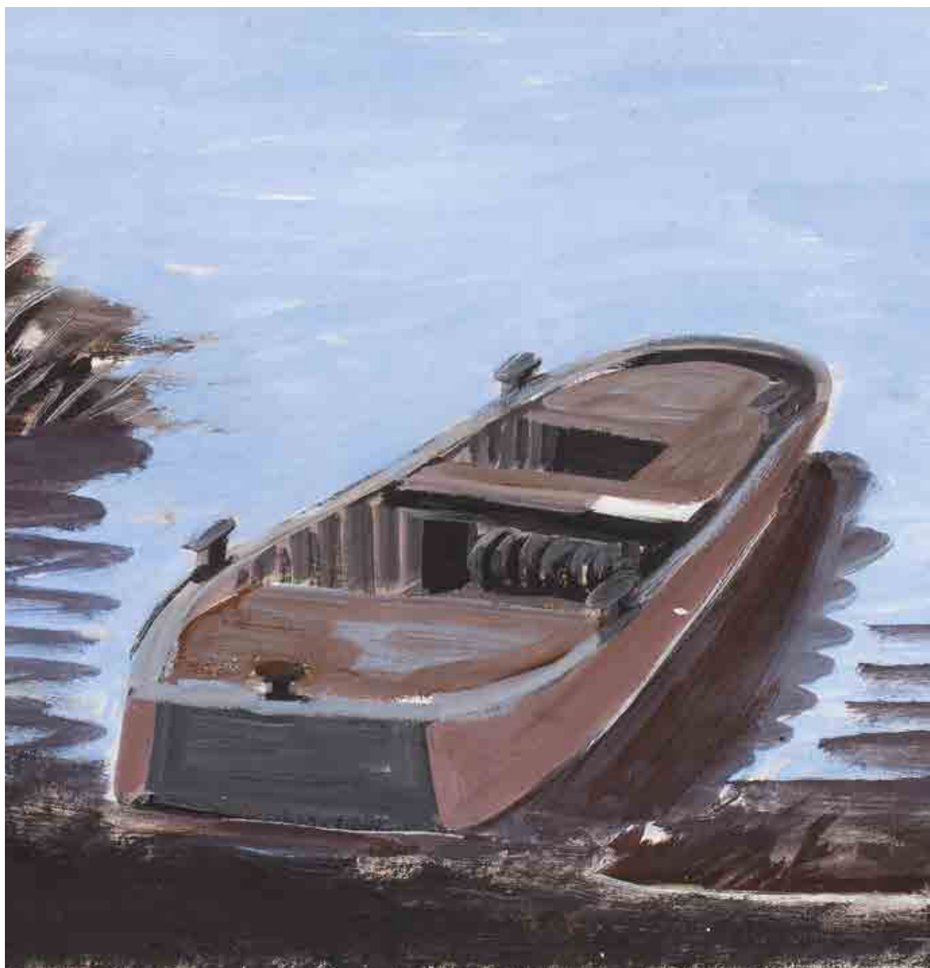
Jarosław Modzelewski, „Stara barka”, 2006 r.