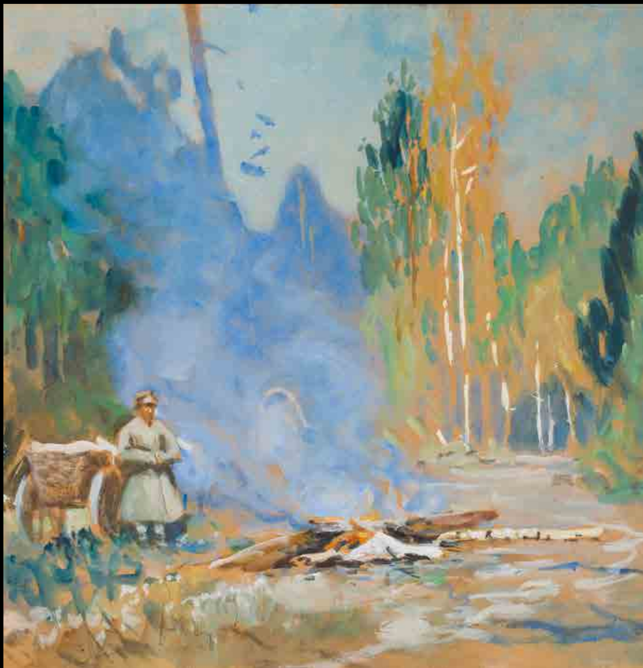
Julian Fałat, Nieśwież