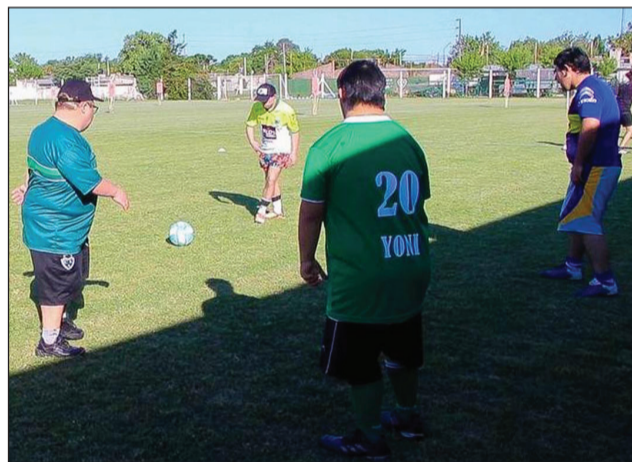
➤ También la delegación visitante visitó el predio de la Ciudad Deportiva y allí hicieron "jueguitos".

Luego, amplió conceptos diciendo: "Quiero destacar la acti-