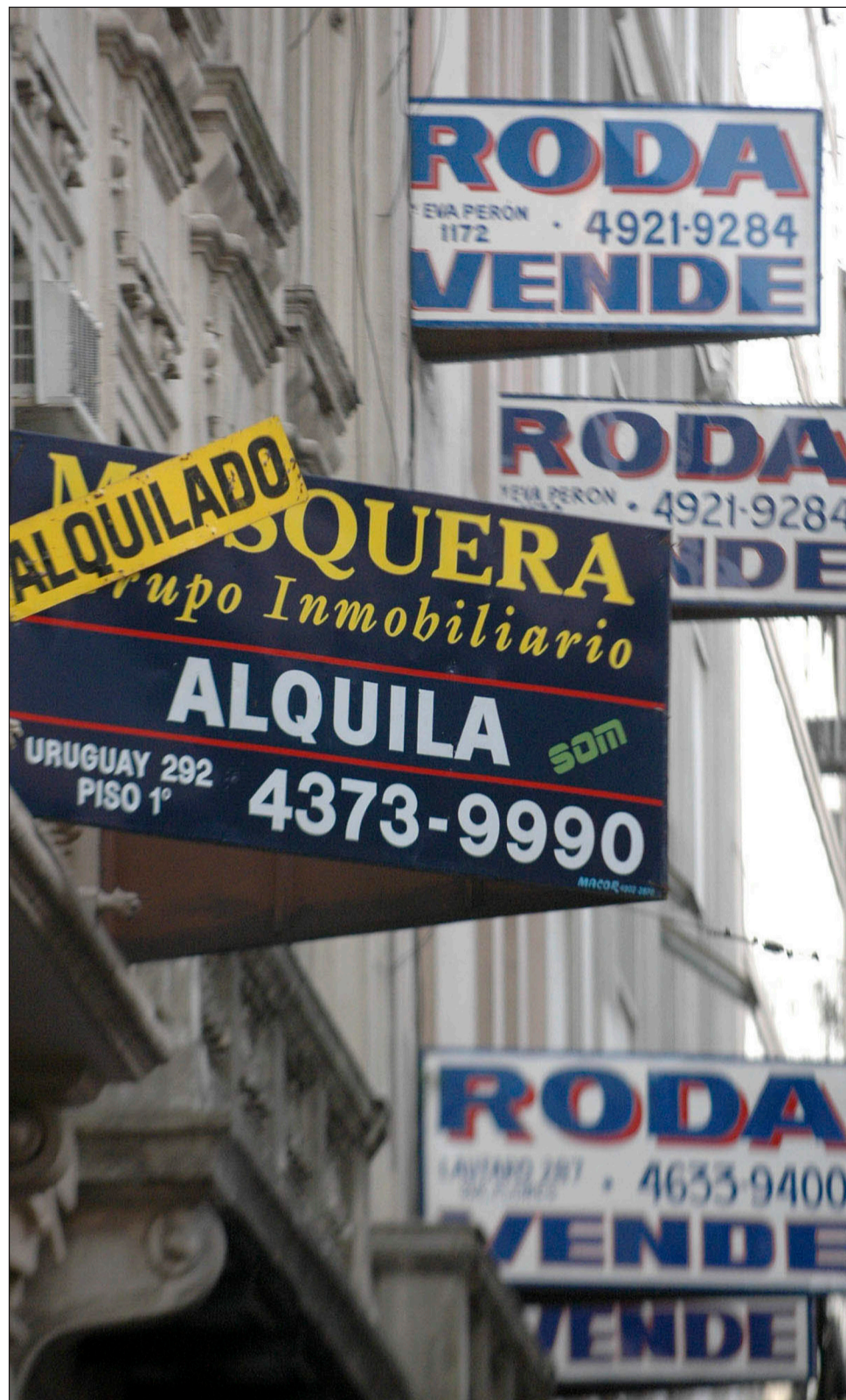
>Diputados firmó ayer un dictamen de mayoría favorable a un proyecto para regular el mercado de alquileres habitacionales.

También se agregó un artículo que establece que en caso de que un tercero medie en la relación contractual de alquiler, los únicos agentes reconocidos legalmente por sus incumbencias profesionales sean los corredores matriculados. <