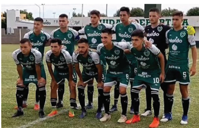
➤ Equipo de Reserva de Sarmiento de Junín que perdió ayer 1 a 0 como local, ante All Boys.