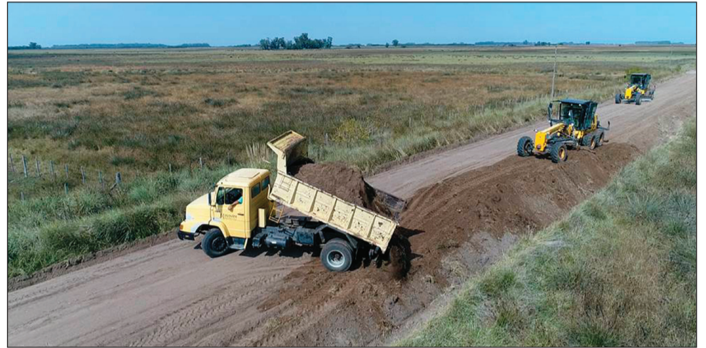
>Aseguran desde el Municipio que los caminos rurales están en buen estado.

Y amplió: "Junín es un lugar complicado por las lagunas que lo secundan y la napa que está muy alta, pero los caminos resistieron, de acuerdo a lo que nos dijeron los mismos productores. Dimos una vuelta