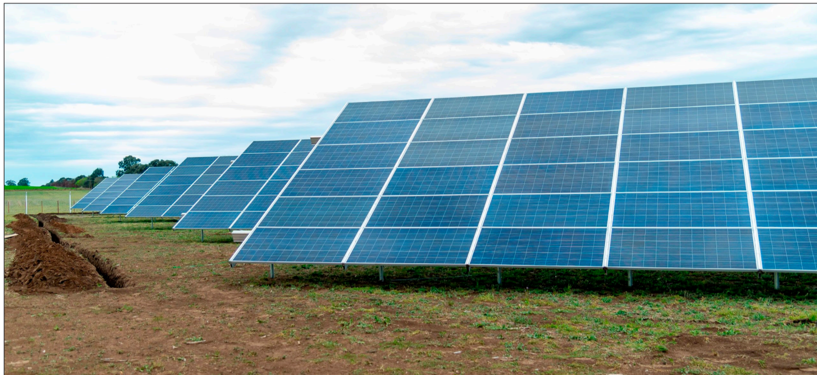
>Las celdas ya fueron montadas.

En ese sentido Greco destacó, los beneficios que se generan desde el punto de vista económico por tratarse de