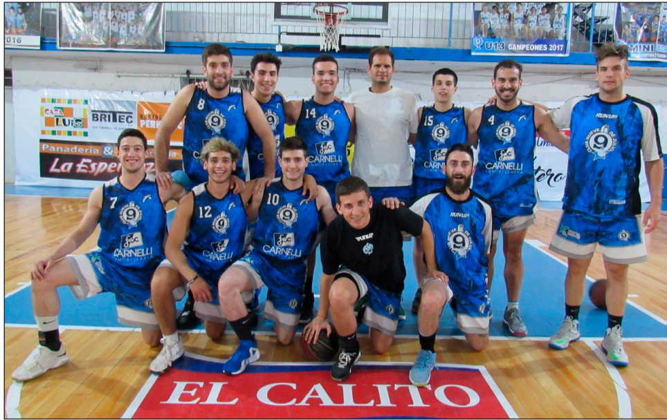
>Nueve de Julio, que se quedó con el liderazgo absoluto.