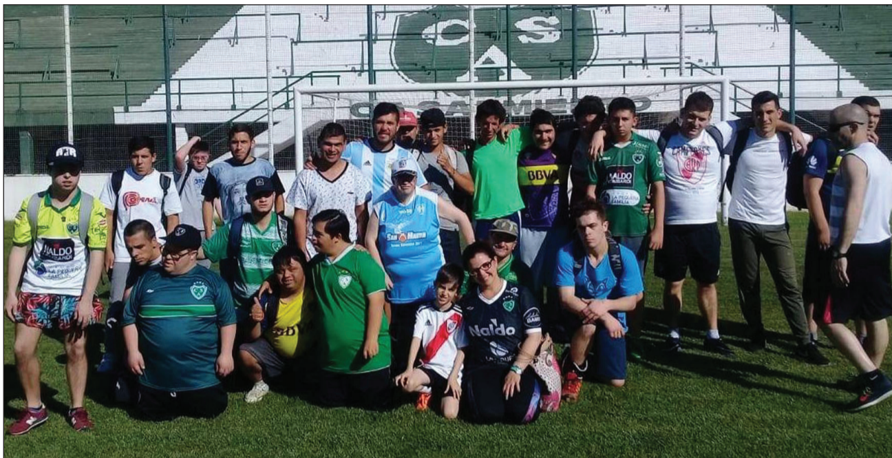
➤ Los pibes disfrutaron en la visita al estadio de Arias y Necochea y allí compartieron con los jugadores del C.A.S.