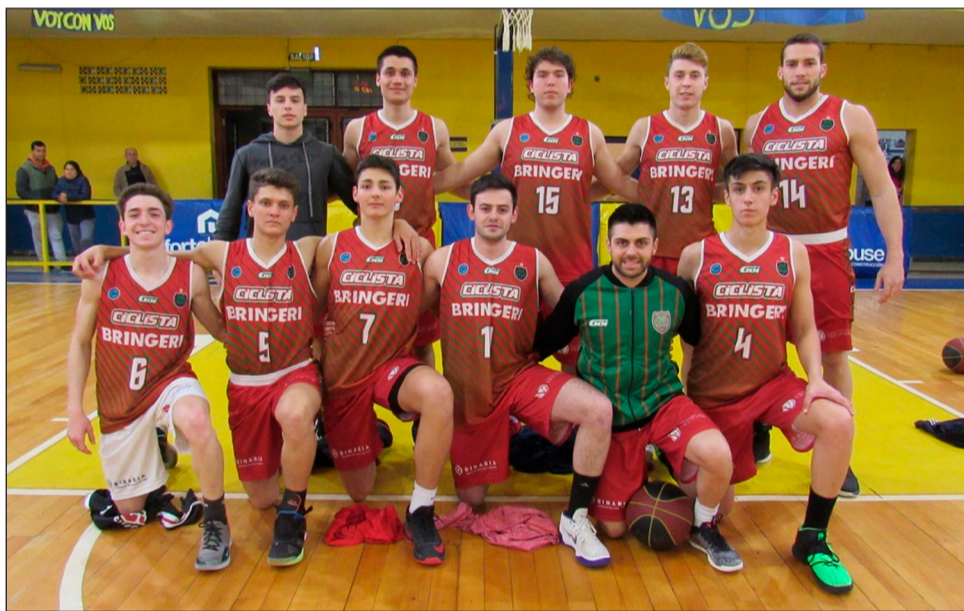
>Ciclista Juninense, que se juega la clasificación en Lincoln.