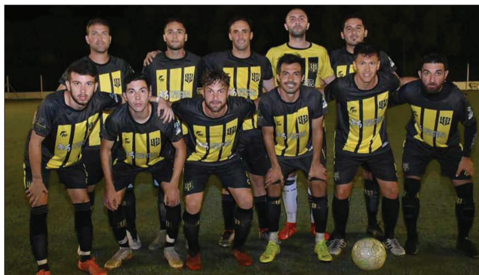
►Equipo titular que presentó River Plate y que perdió 3 a 1, sufriendo además tres expulsiones.

En el cotejo de ida, el elenco azul dirigido por Ezequiel "Chichulo" Montiel se puso arriba con los goles de Obert