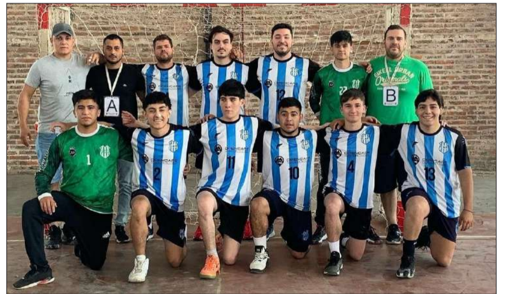
►Equipo del Albiceleste.

El próximo fin de semana se completará la fecha cuatro en la Zona Norte y quedarán definidos los cuatro elencos que disputarán el Súper Cuatro Final, el 26 de noviembre, en Colón.◀