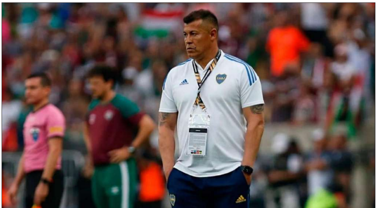
►Jorge Almirón dejó Boca y suenan reemplazantes.

Se trata de Gabriel Milito, sin club luego de su sorprendente partida de Argentinos Juniors, mientras que otras opciones son Fernando