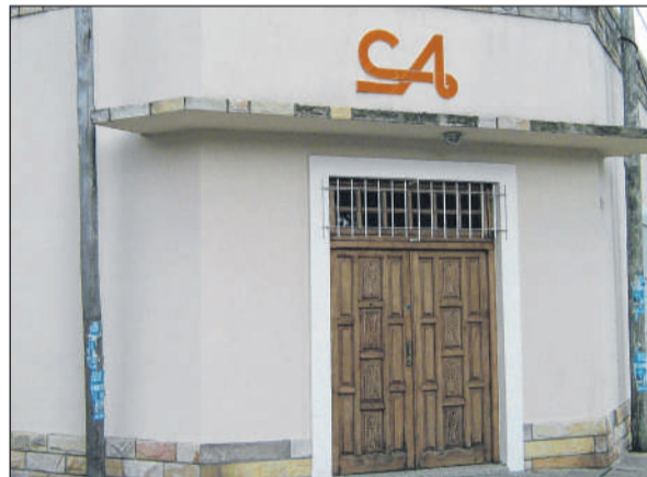
>Sede del Club de los Abuelos.

El sábado 25 de noviembre, a las 21.30 será la cena Despedida de Año en el Club de los Abuelos. Mucho Ritmo, buena onda, para pasar una hermosa noche juntos.