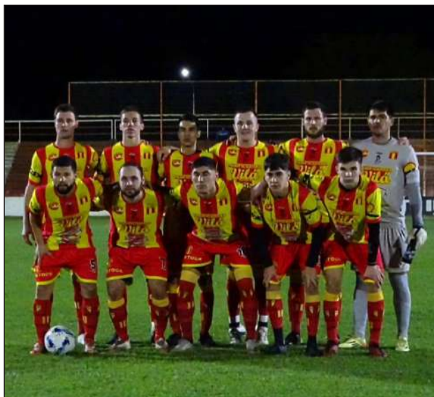
► El equipo de Sportivo Barracas.

Rivadavia de Lincoln juega esta noche el partido de vuelta de los cuartos de final del Torneo Regional Seis Ligas ante Sportivo Barracas, en Colón. El encuentro comenzará a las 21, en el estadio Roberto "Tito" Pérez.