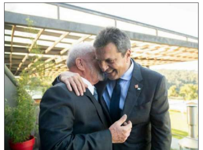
&gt;"No dudamos en apoyar la candidatura de Sergio Massa", destacó el PT.

El PT añadió: "Los brasileños conocemos bien esta segunda alternativa, que también gobernó nuestro país en el periodo anterior. Conocemos todo el dolor y