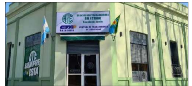
&gt;Sede de la Seccional Junín de ATE en España 498.

Tecnicatura Superior en Enfermería es una carrera de Nivel Superior No Universitario con una duración de tres años. Su formación está centrada en el ejercicio profesional del desa-