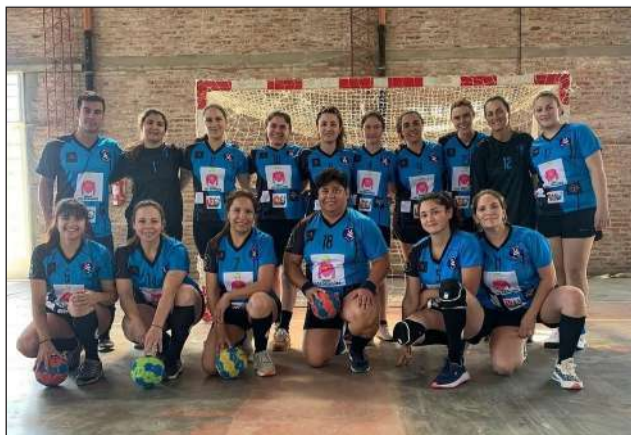
►Equipo de Handball Pinto.