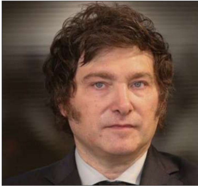
>Legisladores electos de La Libertad Avanza advirtieron que Macri quiere "colonizar el futuro gobierno".

En un comunicado, señalaron: "En gran número la sociedad nos acompañó en las primarias y en las elecciones generales, eligiendo a nuestro candidato