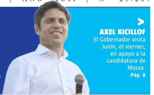
AXEL KICILLOF El Gobernador visita Junín, el viernes, en apoyo a la candidatura de Massa. Pág. 8