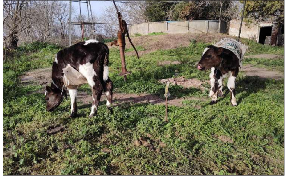
►El sector ganadero dio vuelta la página y espera el crecimiento del pasto para superar la crisis por la sequía.