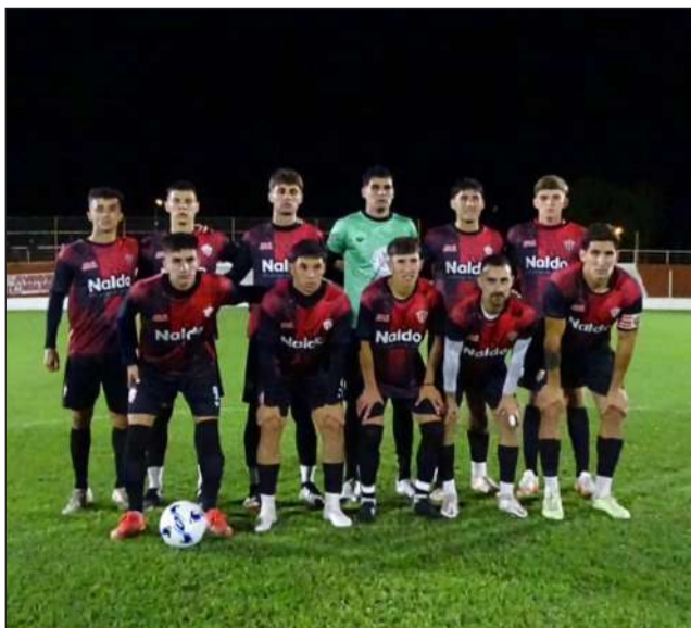
► Rivadavia de Lincoln se presenta hoy en Colón.