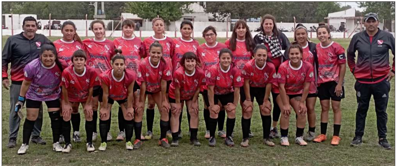
► El Rojo clasificó a los cuartos en el tercer puesto.