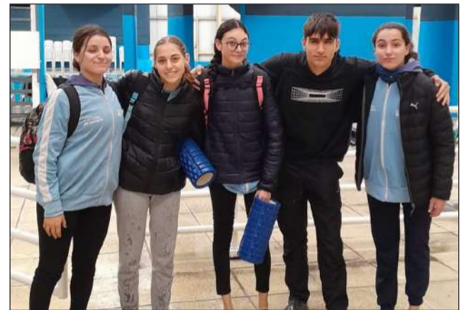
►La institución juninense presentó una delegación de cinco nadadores.