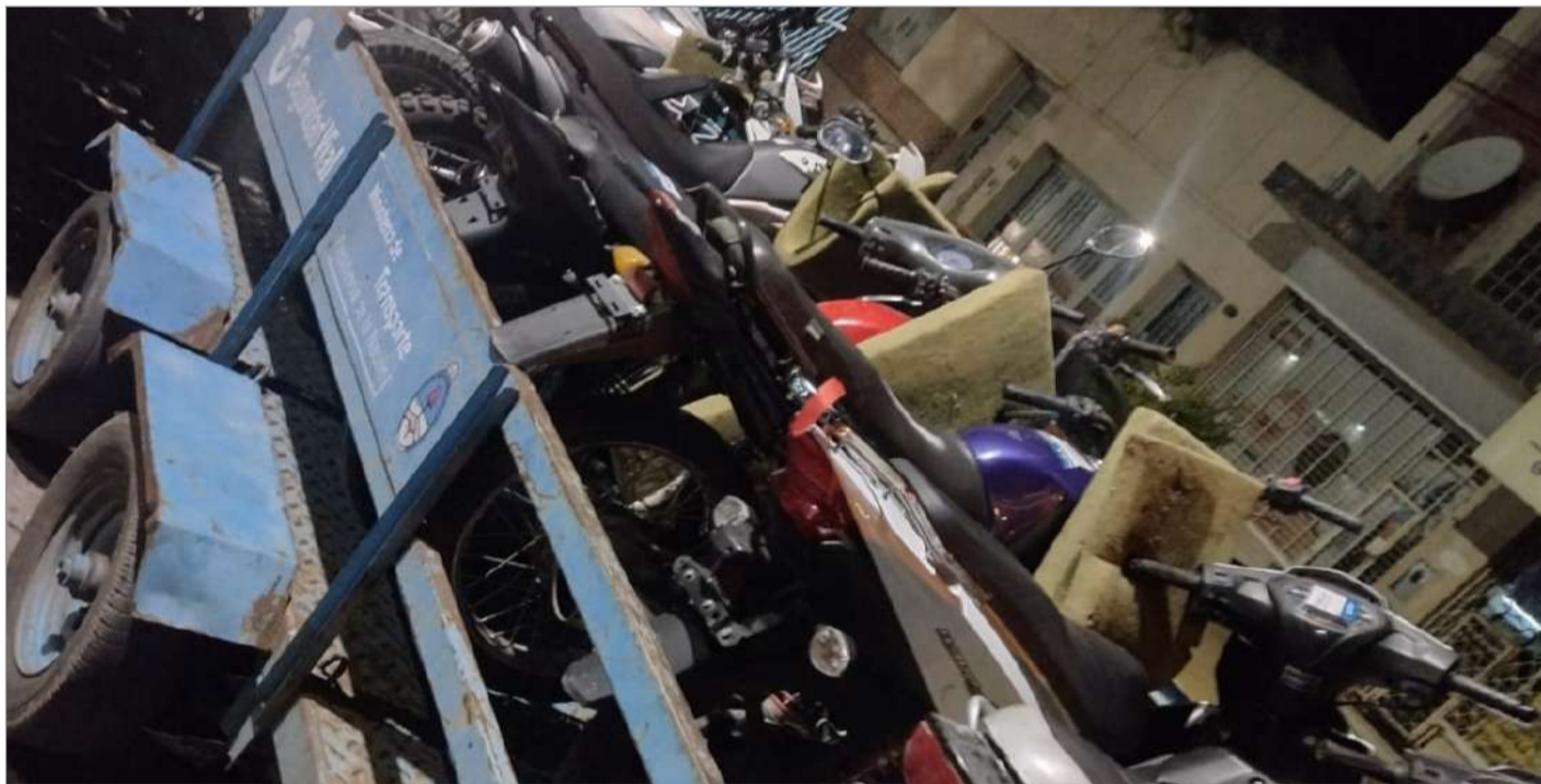
>Buscan desarticular a estas bandas motorizadas que generan caos en el tránsito juninense.