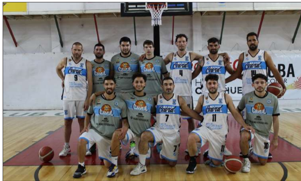
►Formación de primera que presentó noche Cavul en el Coliseo.