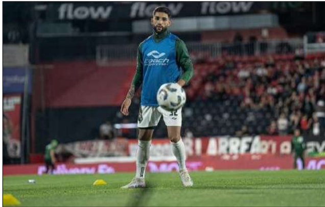
►Sarmiento vuelve a los entrenamientos.