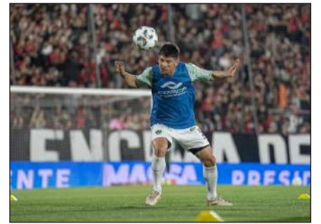
>Los de Sava salieron del descenso.