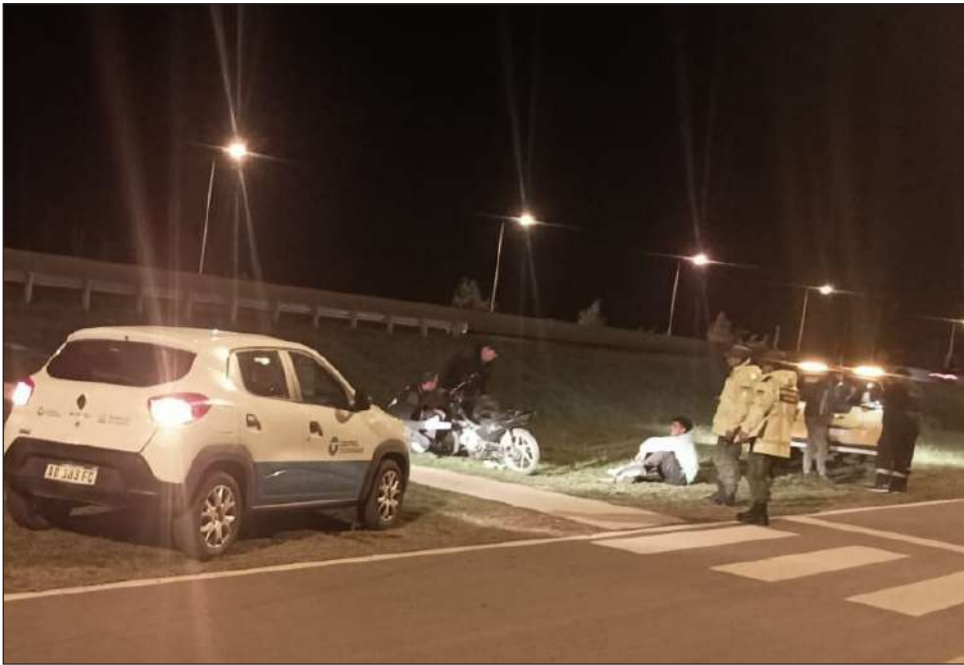
►Operativos para el control de las motos.