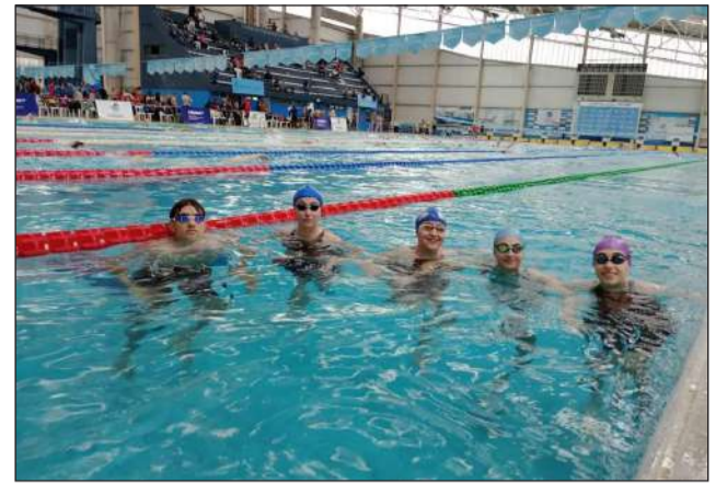
►El torneo fue organizado por Fenaba.