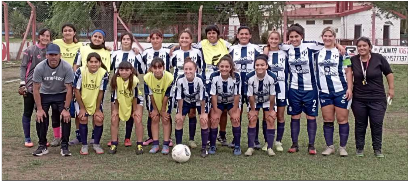
► Jorge Newbery finalizó primero en la Zona B.

Sarmiento 6 – 0 Moreno V. Belgrano 3 – 2 BAP Unnoba 8 – 0 River Origone 7 – 0 La Favela Newbery 5 – 3 Juan El Bueno. ◀