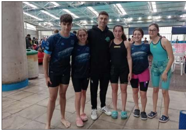
►Los nadadores juninenses compitieron en el Metropolitano.