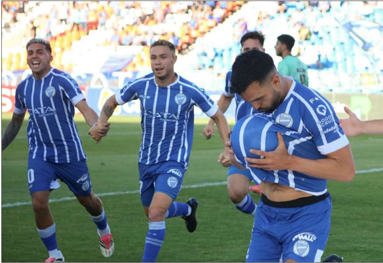
►El Tomba, más líder que nunca.

►El equipo mendocino le ganó 2 a 0 al Calamar, ayer, como local, por la fecha 12 de la Copa de la Liga, y además de afianzarse como líder, dio un paso importante para clasificarse a la próxima Copa Libertadores. El lunes siguiente visitará a Sarmiento, en Junín.