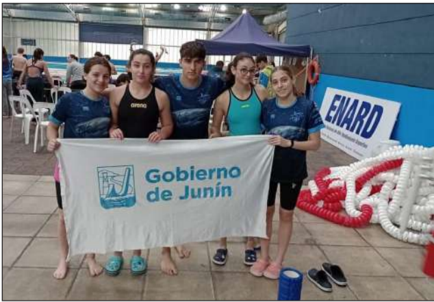
►La Escuela Municipal de Natación de Junín compitió en el CENARD.