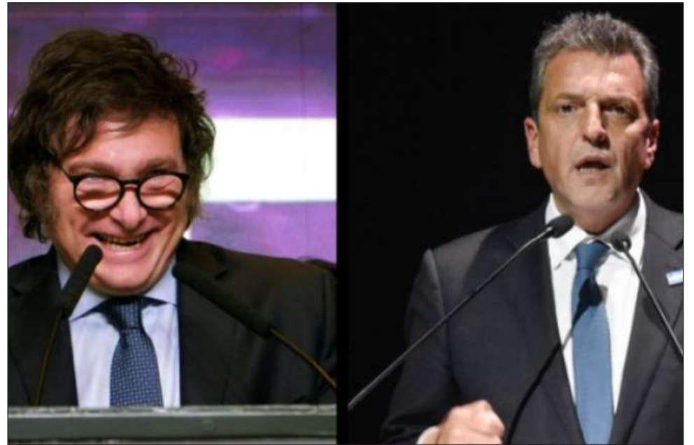
&gt;El informe advierte que "la próxima gestión recibirá una pesada herencia".

Todo esto en un contexto de pobreza en torno al 45%.<