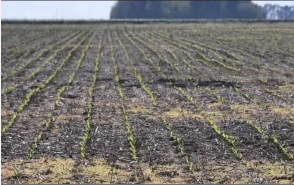
►Mejoraron las perspectivas para el maíz y la soja en Junín y la región tras las últimas lluvias.