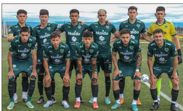
►La Reserva del Verde recibe a Platense.