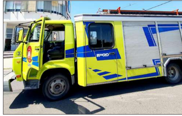
&gt;El Cuartel de Bomberos cuenta con varios móviles que requieren mantenimiento.

de la Lotería de la Provincia de Buenos Aires, también mensuales (último sábado de cada mes) y el premio mayor, que se sorteará el septiembre del 2024, es de