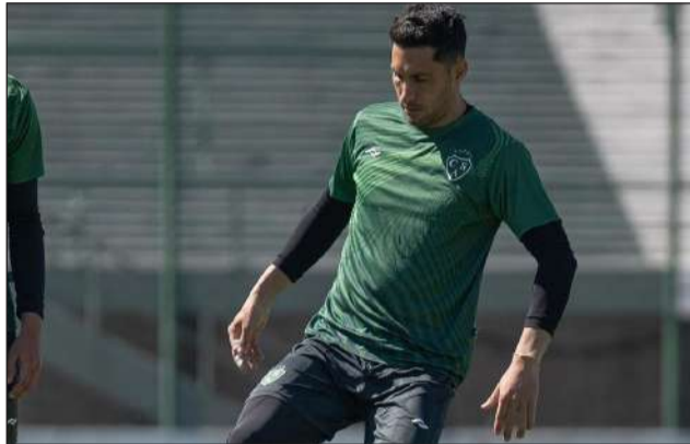
►El Verde se prepara para recibir a Godoy Cruz.

Luego de la importante victoria ante Newell's, Sarmiento regresa a los entrenamientos en el Centro de Alto Rendimiento, con la tranquilidad de haber salido de la zona de descenso y con varios días por delante para planificar el duelo con Godoy Cruz.