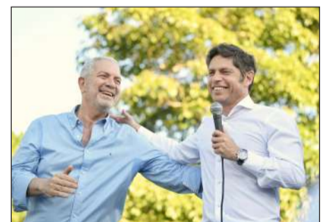
>Kicillof, ayer, en La Plata, junto a Julio Alak.

"No va a ser un acto grande, sino más bien un encuentro con la militancia", anticiparon a Democracia desde el entorno del ex ministro de Economía de la Nación.