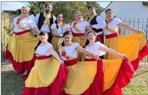
>Bailarines del Ballet Inti Mosqoy.