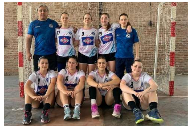
►Conjunto de EMH Chacabuco.