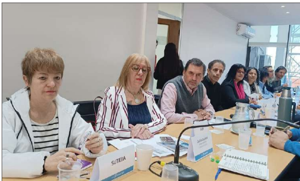
>Este martes en La Plata se llevará adelante la reunión.

En sintonía, la Secretaria de Suteba agregó que "lo que esperamos de la reunión es que haya acuerdo respecto de si hay que re-