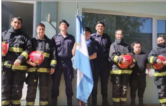
&gt;La rifa es a beneficio de los bomberos de Junín, para compra de equipos.