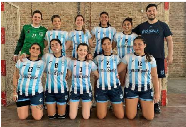
►Elenco femenino de Rivadavia de Junín.