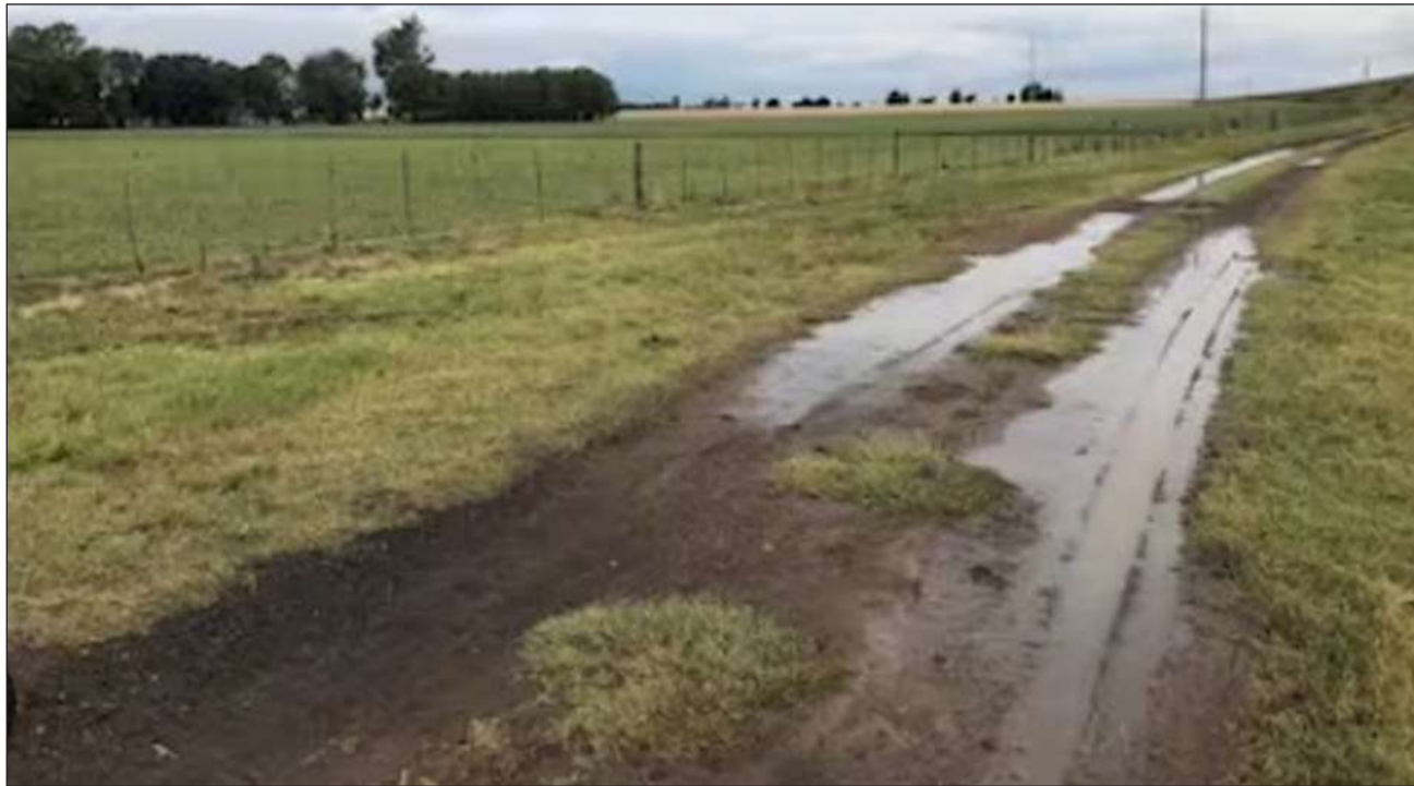
► Entre octubre y lo que va de noviembre, cayeron en la zona más de 100 milímetros de lluvia.

En este sentido, la BCBA adelantó que en esta región clave para el agro argentino el avance de la siembra "retomará fuerzas a finales del mes de noviembre con el comienzo de la siembra tardía".