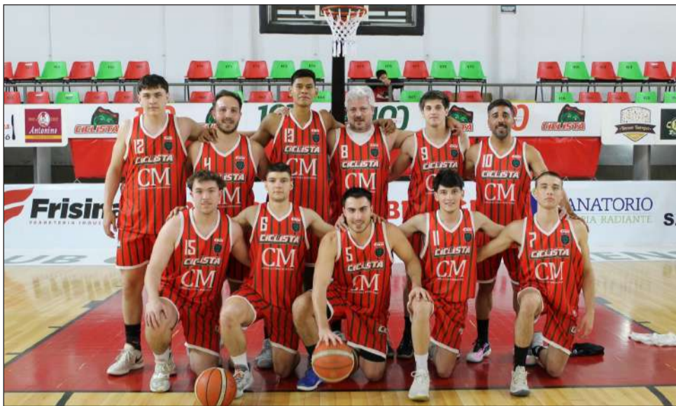
►Plantel de primera del club Ciclista Juninense