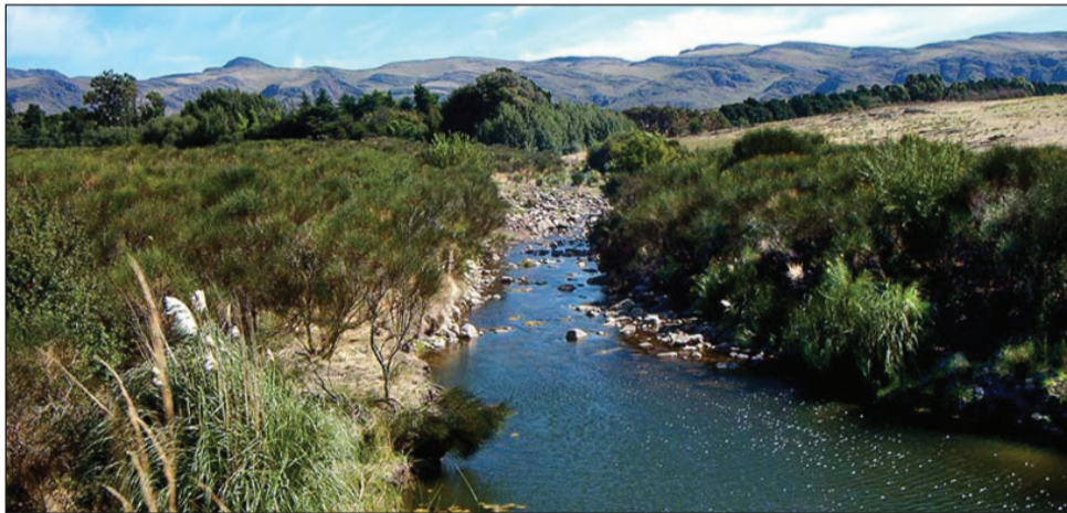
►Con el 94,29%, las Sierras es el sector que mayor tasa de ocupación presenta.

►El sector que mayor tasa presenta es el de Sierras, con el 94,29%, al que le sigue la región Costa Atlántica, que registra una proyección de ocupación del 73,68%. En cuanto a la estadía promedio, se registró entre 3,4 días, con un total esperado de 515.000 arribos.