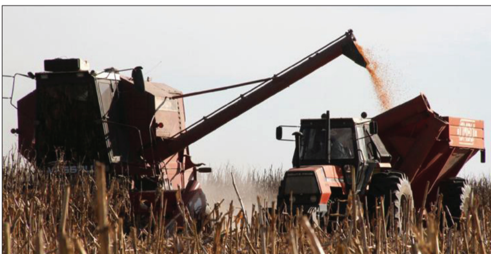
>El maíz será el cultivo estrella de la campaña, con una cosecha histórica de 55 millones de toneladas, según el Gobierno.

Sin embargo, señaló que las acciones que se están encarando apuntan a incrementar las ventas al exterior. "Por eso en estos últimos tres años se abrieron 180 nuevos