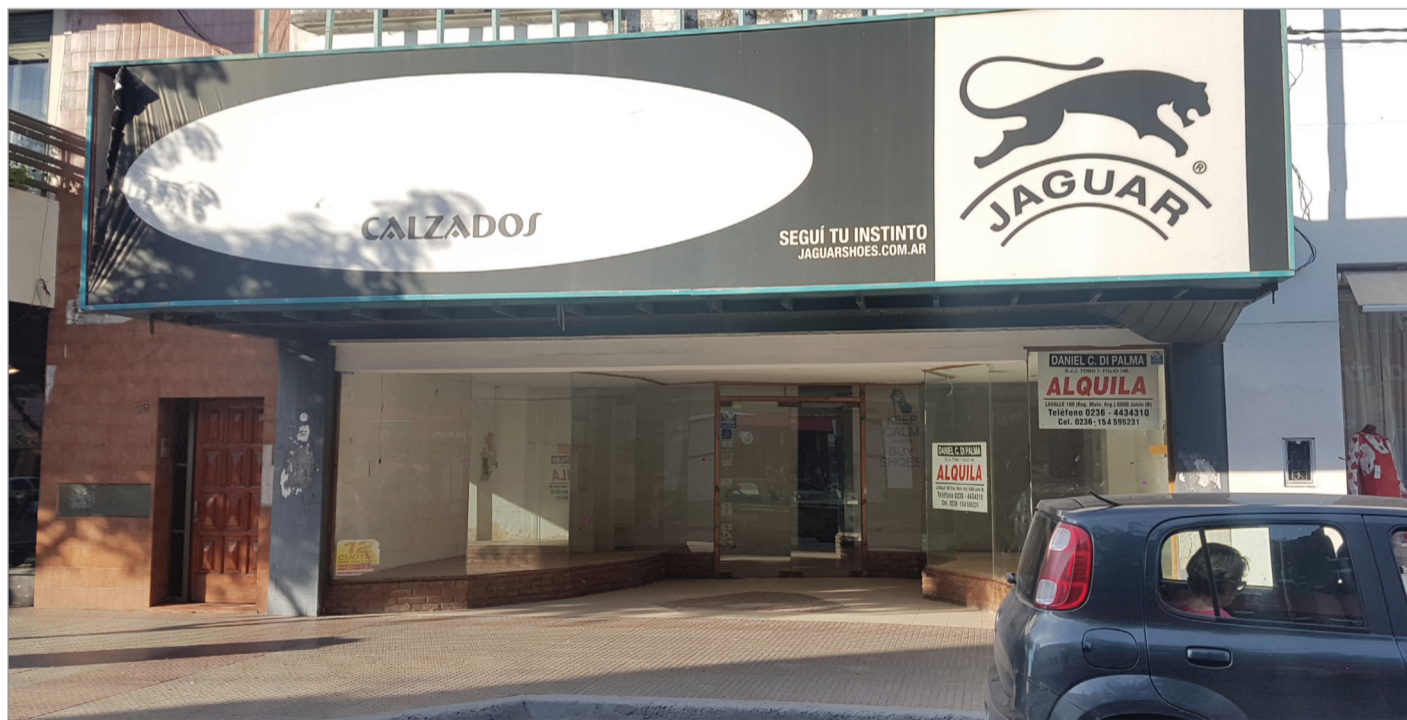
>Un local tradicional de Roque Sáenz Peña, que sigue vacío. A los altos precios de los alquileres se suma la caída de las ventas y la presión impositiva.