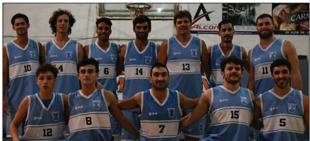
►Plantel de Cavul de Lincoln que venció a Sarmiento de Junín, como local.