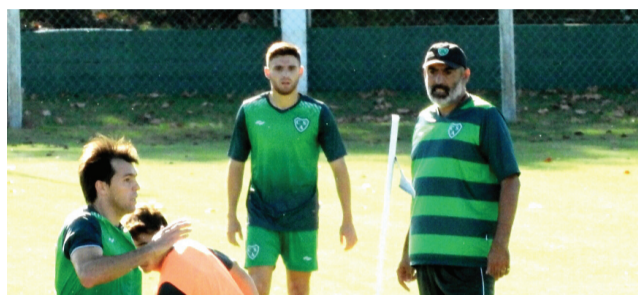
►Sarmiento tendrá dos cambios para recibir a Brown de Madryn.

Las posiciones: Arsenal y Sarmiento de Junín 43 puntos; Nueva Chicago 42; Platense 38; Almagro 37; Central Córdoba de Santiago del Estero y Gimnasia de Mendoza 36; Independiente Rivadavia