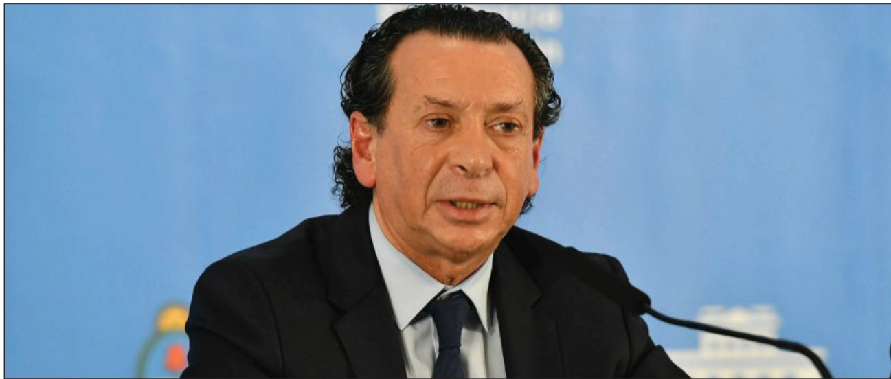
>"El programa antiinflacionario no se basa en el acuerdo de precios", dijo Sica.

Agregó que "en base a lo que nos pasó en los últimos meses, los datos de pobreza y los datos de este pico inflacionario del mes pasado, lo que hicimos fue concentrarnos en un set de productos que están muy dirigidos a la canasta básica para dar un alivio en estos