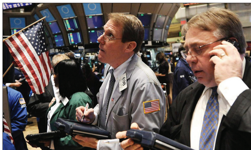
>Los papeles de los bancos encabezan la baja.

En la última sesión bursátil de la semana -hoy es feriado- finalizó con ganancias en los tres principales índices bursátiles neoyorquinos, gracias al optimismo de los inversores por los últimos datos del comercio minorista en Estados Unidos, que subió un