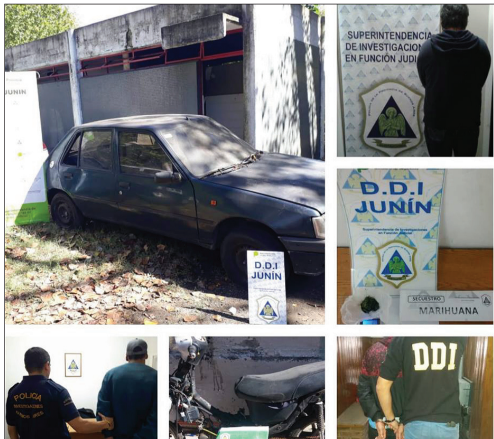
>La policía actuó en Lincoln, Chacabuco y Junín.

Se incautó el rodado en cuestión y se inició una IPP por infracción al art. 289 del CPP con intervención de la UFIJ 3 a cargo del Dr. Carlos Colimadaglia.<