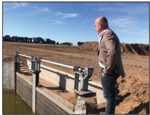
►Gustavo Traverso, senador provincial.