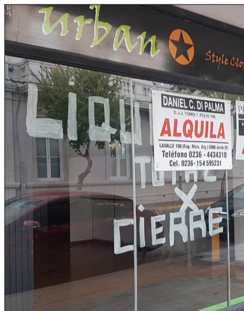
►Según la Fundación Ciudad Abierta, en el último año cerraron 93 comercios en el centro de Junín.

rir que a partir del cierre de los comercios también se van perdiendo puestos de trabajo. Lo que va generando un escenario muy complejo en el sector comercial de Junín, que alguna vez supo ser el centro comercial de la Región", concluyó Scévola. <