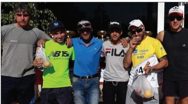
► Varios atletas de Junín compitieron en la prueba pedestre de Wheelwright.