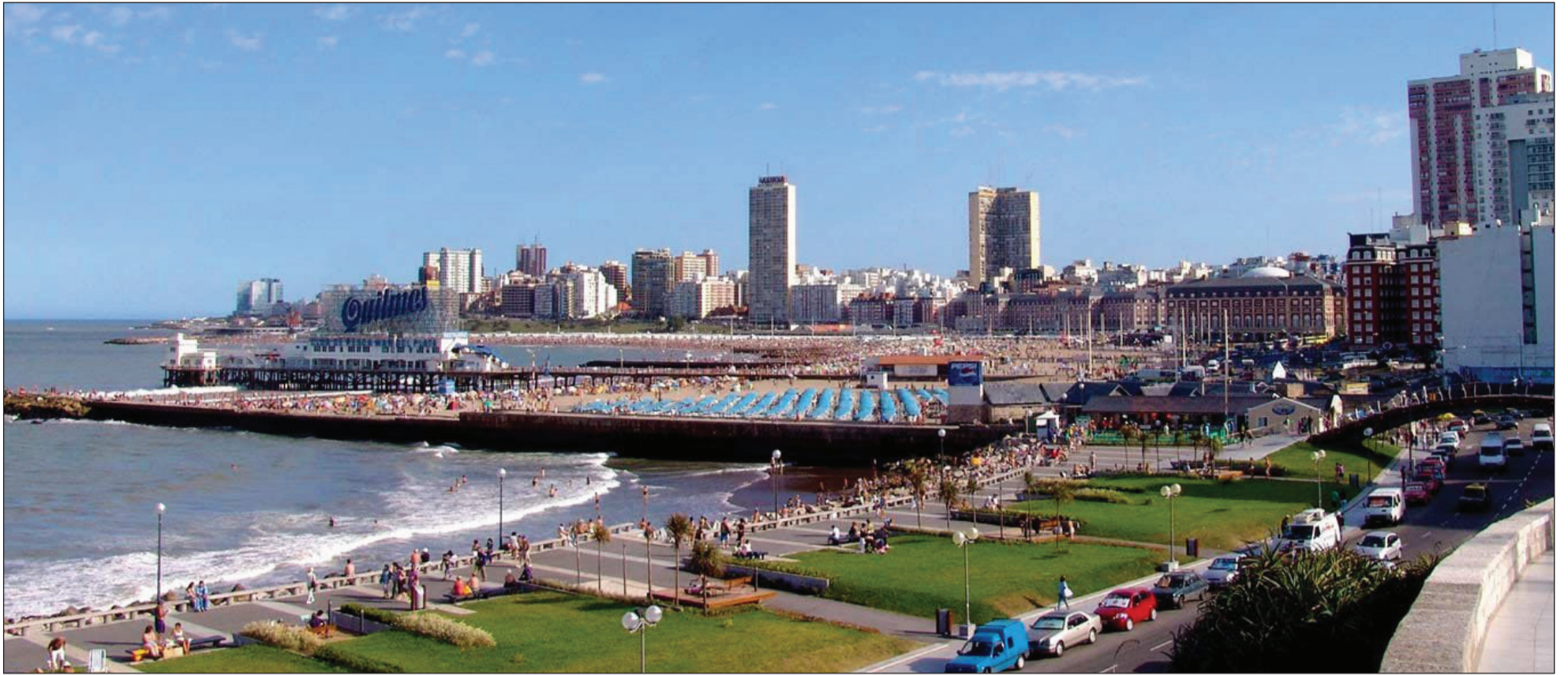
►La Costa Atlántica es el segundo destino con más ocupación hotelera.