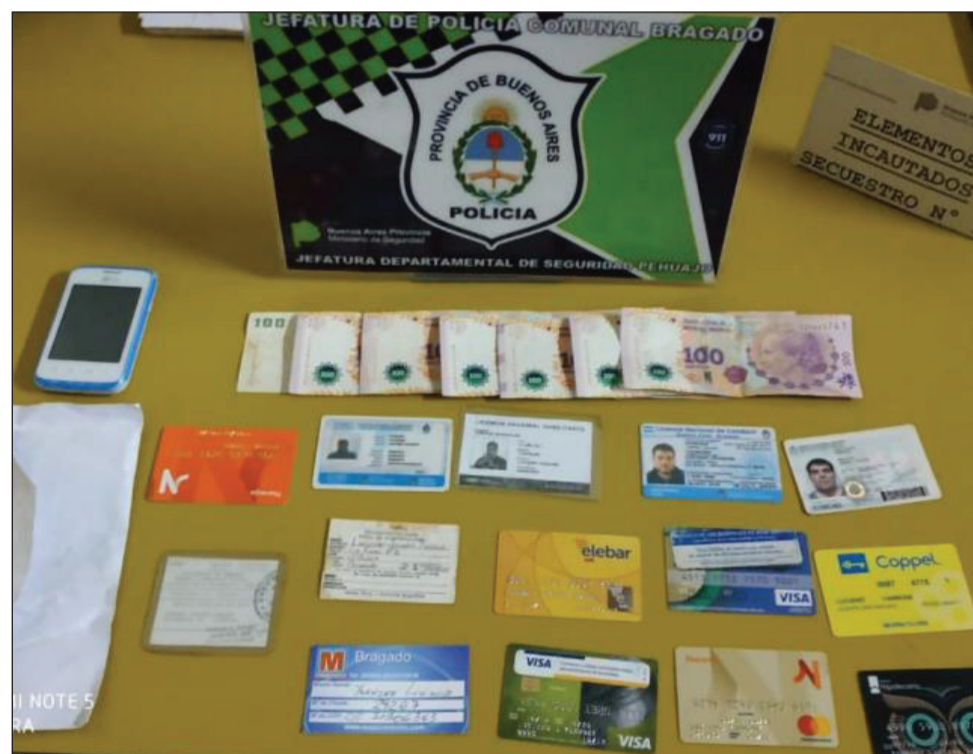
>Los elementos robados fueron entregados al damnificado.