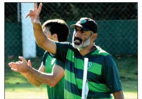
>El Verde entrena y crece la ilusión.