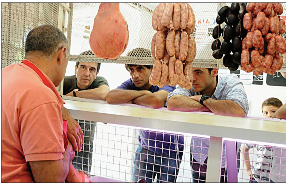
>"Si lo han anunciado, es porque hay empresas que se han comprometido."

irá al Mercado Central y el resto lo van a entregar en los puntos de contacto de los exportadores. Los frigoríficos exportadores no están en la Capital, por lo que ese poquito que va a tener el Mercado