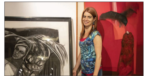
►Autora de la obra "Mirada en movimiento".