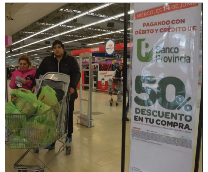
►La promoción comenzaría en mayo.

Pero por otro lado, está en carpeta otra medida que busca apuntalar el consumo: se estudia avanzar con una devolución del IVA para productos de primera necesidad, con la utilización de las tarjetas de la entidad. <