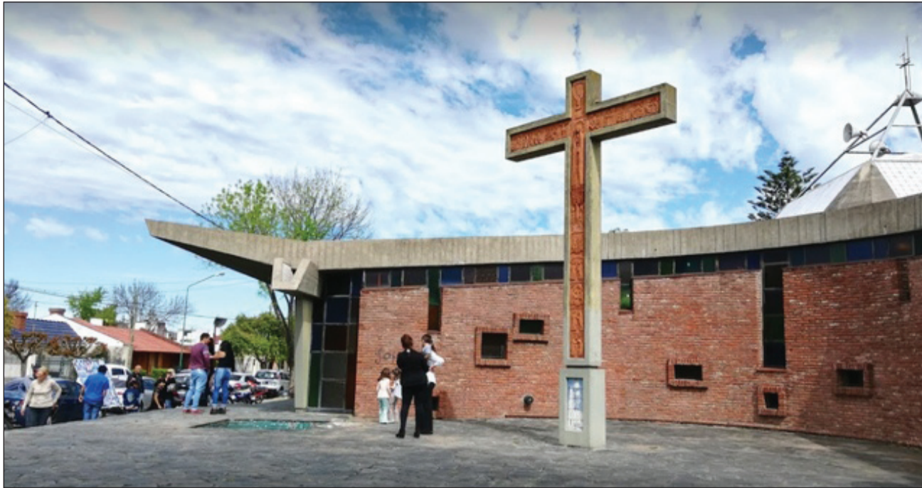
►Parroquia Nuestra Señora de Fátima.