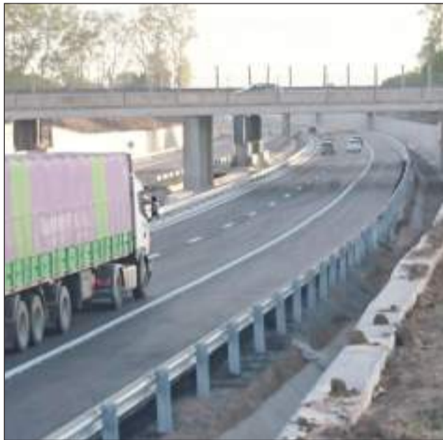
>Esta obra desvía el tráfico fuera del casco urbano de Luján.

"Permitirá ahorrar 45 minutos de viaje en hora pico para los casi 20.000 vehículos que transitan esta ruta todos