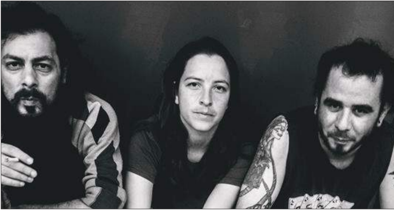
►Integrantes de Bonito Baigorria y su hipocondría.