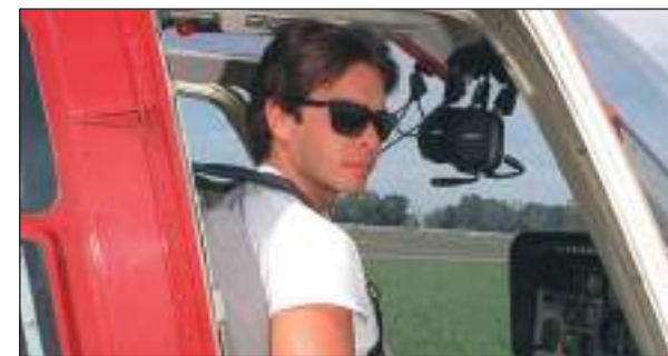
>El hijo del expresidente falleció en 1995.