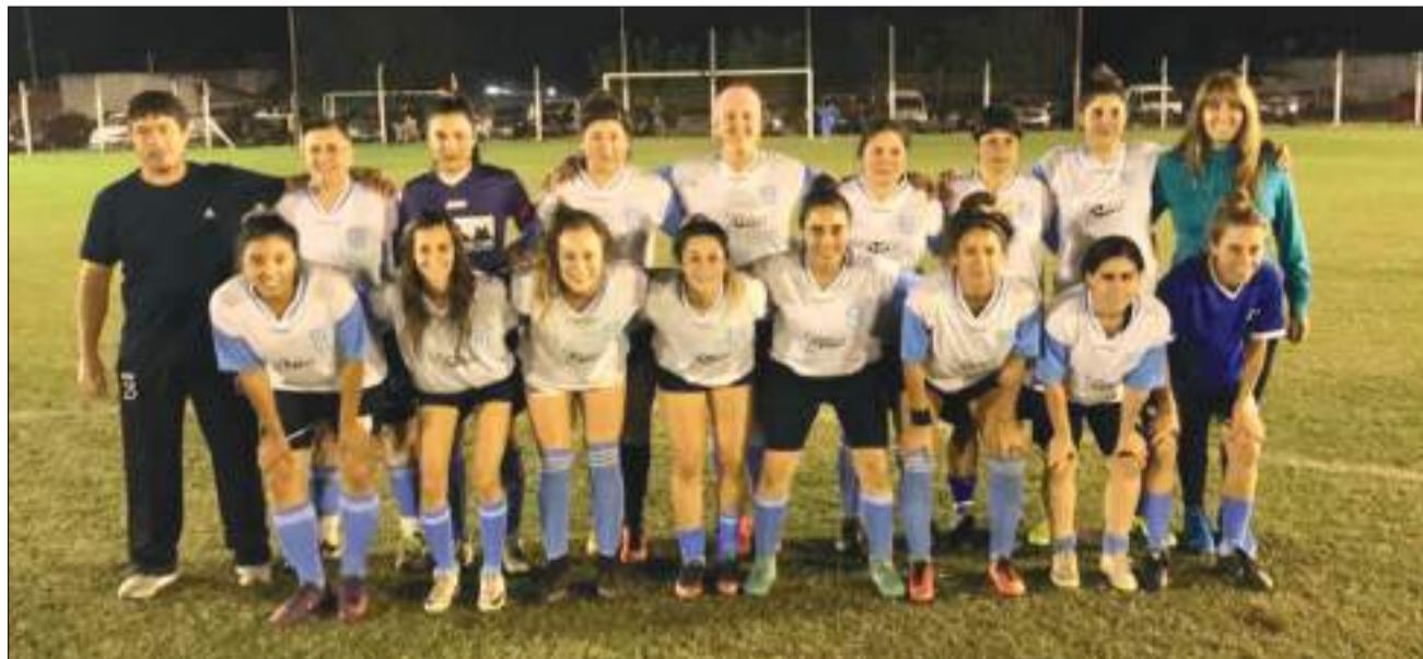
►Rivadavia de Junín.<

Hoy dará inicio en nuestra ciudad el primer Campeonato Regional de Fútbol Femenino. El torneo, que se realizará en el predio del Club Banco Junín, contará con la participación de Sarmiento, Ambos Mundos, 9 de Julio de Chacabuco y Selección de 9 de Julio.<