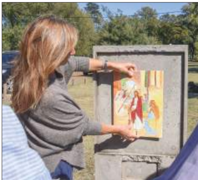
►Inaugurarán la muestra del Vía Crucis, hecha en hormigón y cerámica

Cada una de las estaciones lleva imágenes a color sublimadas en cerámica y están distribuidas a lo largo de 1.500 metros de recorrido. A través de la intervención artística de este espacio público, la iniciativa busca revalorizar para los feligreses de la zona un entorno natural privi-