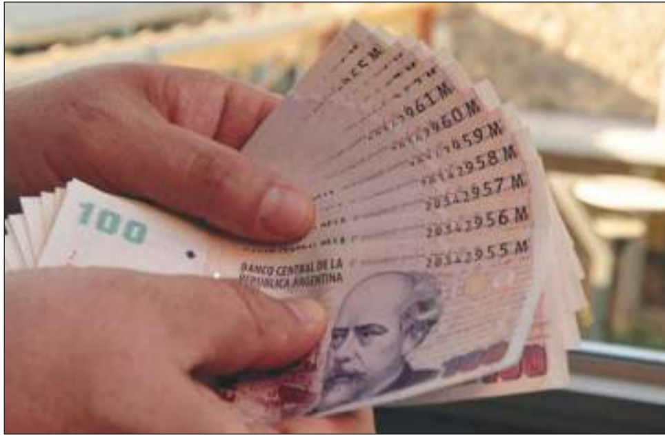
>Se complicará conseguir efectivo en Semana Santa.

la Caja y el hecho de que el Banco Provincia debe poner millones de pesos para cubrirlo. El Banco se encuentra en problemas, nos quedamos sin liquidez, lo cual puede ocasionar problemas en la parte operativa", advirtió el gremialista.