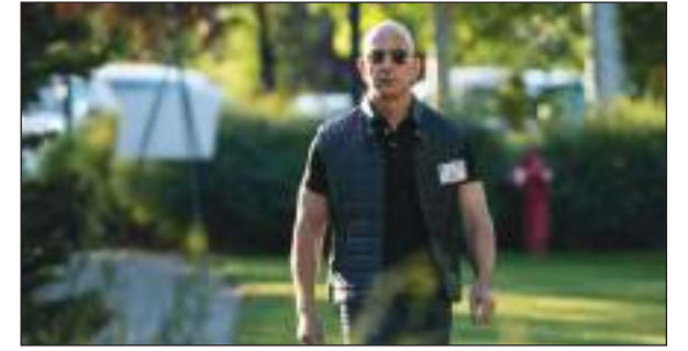
>Jeff Bezos, principal accionista de Amazon y del Washington Post.