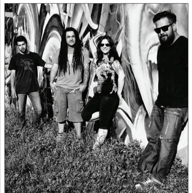
►S.A.P.O., este sábado 31 en Bistró.