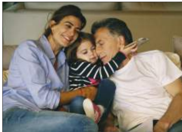
>Macri viajó en el Tango 10 al Aeropuerto de Mar del Plata.

De inmediato, el jefe de Estado se trasladó en helicóptero hacia el Complejo Turístico de Chapadmalal y se instaló en el chalet presidencial.<