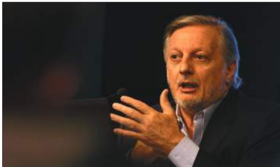
>El exdirectivo de Shell quedó en el ojo de la tormenta con sus declaraciones.

Cuestionado por los entrevistadores, Aranguren ironizó