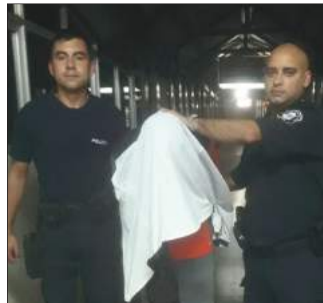
►Por infringir la ley 23.737 de drogas, fue atrapado en Lincoln.

►Lo atrapó personal de la Policía Local de Junín