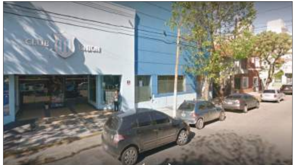
►Sede y estadio de básquet de Unión, en el barrio Nueva Pompeya de Mar del Plata.