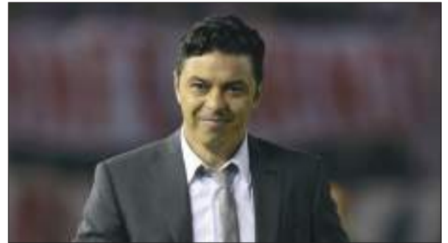
➤ Marcelo Gallardo.

Para el encuentro en Florencio Varela, entonces,