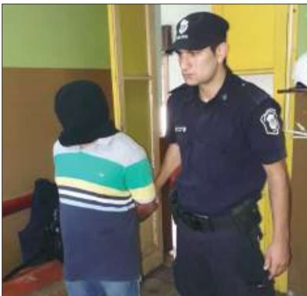
►Un hombre de 48 años resultó aprehendido en General Arenales.