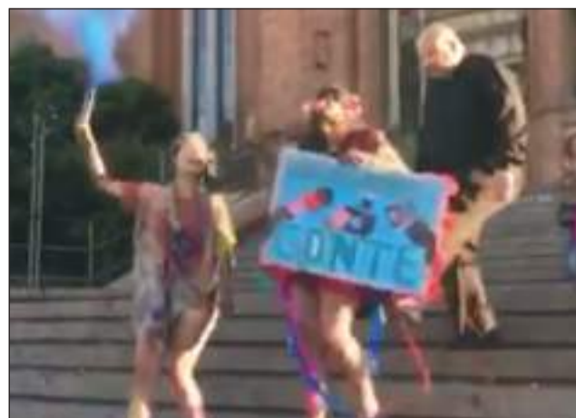
>Las imágenes causaron un escándalo.

"Al fin y al cabo es una iglesia, tengo que cuidarla, pero me arrepiento", indicó.<