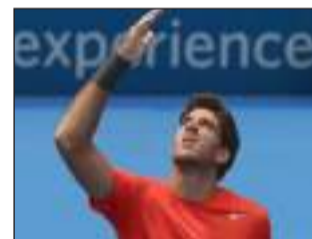
►Juan Martín del Potro.

"Si me quedaba algo de energía, esta noche la gasté toda", declaró Del Potro luego del partido, al que calificó de "agotador, física y mentalmente". "Física y mentalmente estoy con lo justo. Tengo dolores por todo el cuerpo. Espero estar bien para semi-