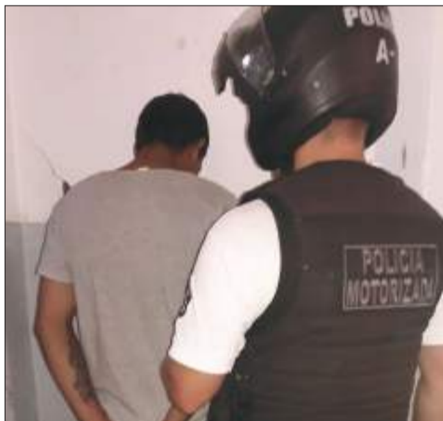
►El joven detenido en Comandante Seguí y Lavalle de nuestra ciudad.

Desde el momento de las detenciones habían llegado los pedidos de excarcelaciones por parte de las defensas, aunque los mismos fueron desestimados, primero por Muñoz Saggese y, en segunda instancia, por la Cámara de Apelaciones del Departamento Judicial de Junín, la misma que deberá resolver la situación actual, frente al requerimiento de revocación de la prisión preventiva efectuado por la defensa.<