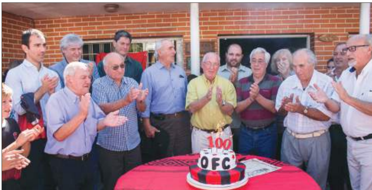
►Autoridades, invitados especiales, actuales directivos y ex dirigentes de Origone presentes, junto la torta del centenario de la querida institución.