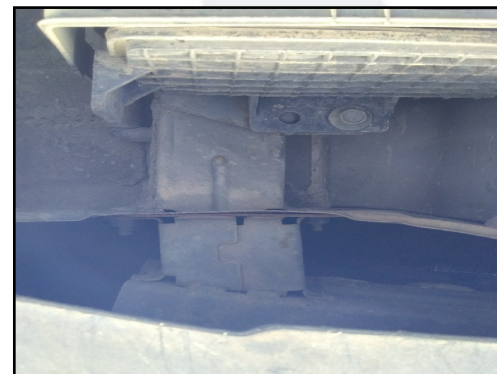
LONGARINA TRASEIRA / DIREITA