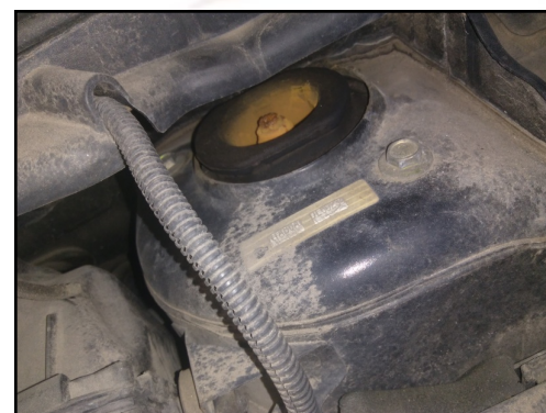
TORRE AMORT DIANT / ESQUERDA