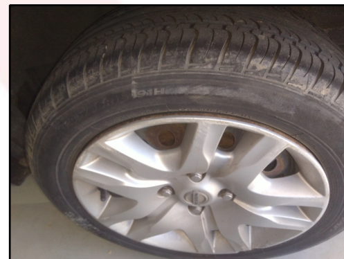
PNEUS/RODAS TRASEIRO E.