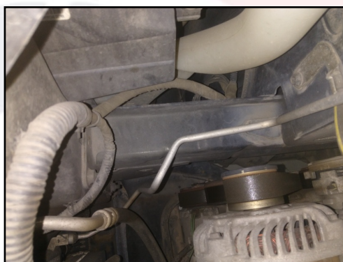
LONGARINA DIANT / DIREITA