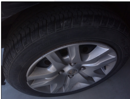
PNEUS/RODAS TRASEIRO D.