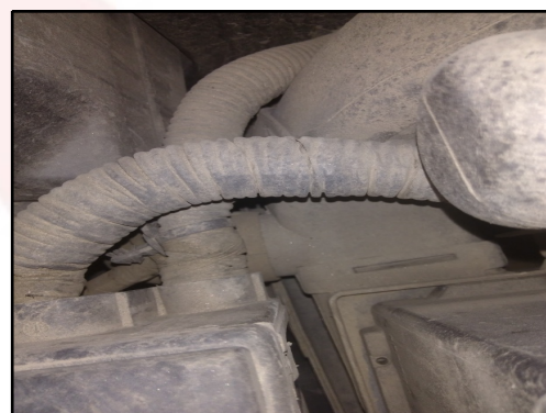
LONGARINA DIANT / ESQUER