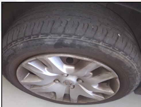
PNEUS/RODAS DIANTEIRO E.