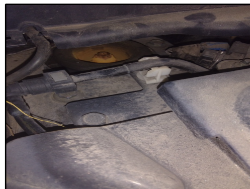
TORRE AMORT DIANT / DIREITA