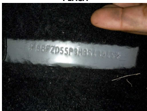
NR DO CHASSI