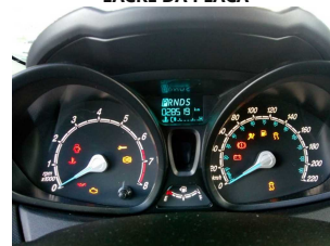
PAINEL DE INSTRUMENTOS