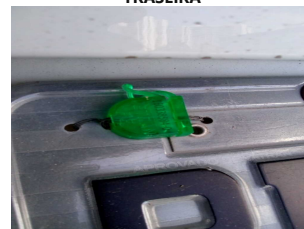
LACRE DA PLACA