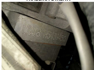
NR DO MOTOR