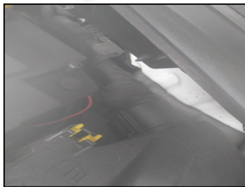
TORRE AMORT DIANT / ESQUERDA