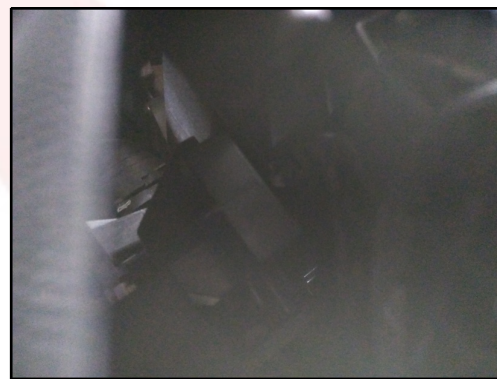
LONGARINA DIANT / ESQUER