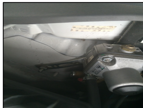
TORRE AMORT DIANT / DIREITA