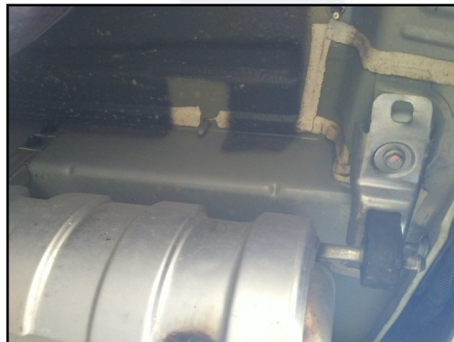
LONGARINA TRASEIRA / DIREITA