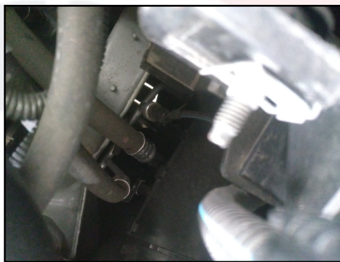
LONGARINA DIANT / DIREITA