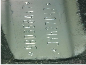
NR DO CHASSI