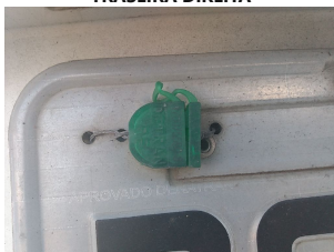
LACRE DA PLACA