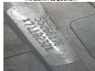
NR DO MOTOR