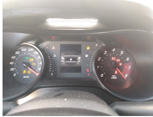
PAINEL DE INSTRUMENTOS