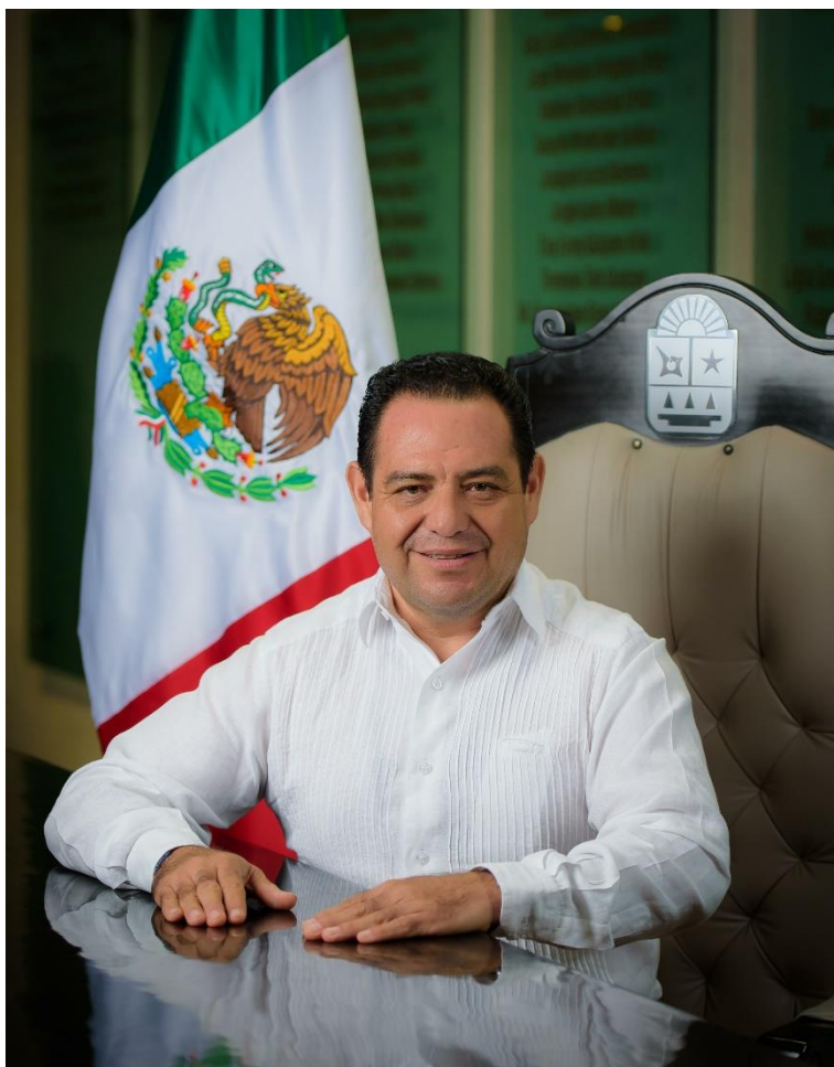
DIP. JESÚS ALBERTO ZETINA TEJERO PRESIDENTE DE LA COMISION DE SEGURIDAD PÚBLICA Y PROTECCIÓN CIVIL