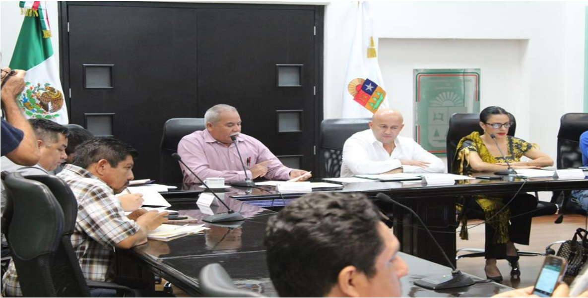
REUNIÓN DE TRABAJO DE LA COMISIÓN DE DESARROLLO INDÍGENA CON AUTORIDADES DE LA SECRETARÍA DE DESARROLLO SOCIAL E INDÍGENA (SEDESI) Y CIUDADANOS DE LA ZONA MAYA. (24 OCTUBRE DE 2016)