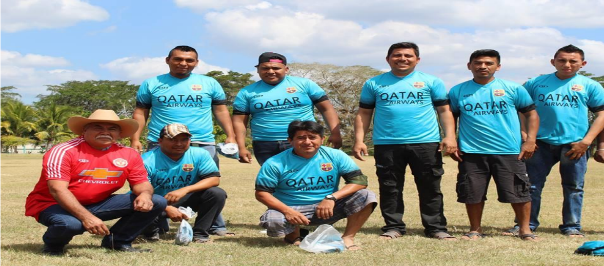
ATENDIENDO UNA GESTION DE LA COMUNIDAD DE CACAO. ENTREGA DE UNIFORMES DEPORTIVOS Y BALONES DE FUTBOL