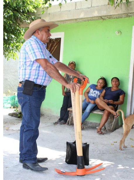
FORTALECIENDO EL DESARROLLO RURAL. ENTREGA DE PAQUETES DE HERRAMIENTAS A PRODUCTORAS DE HORTALIZAS (12 FEBRERO 2017)