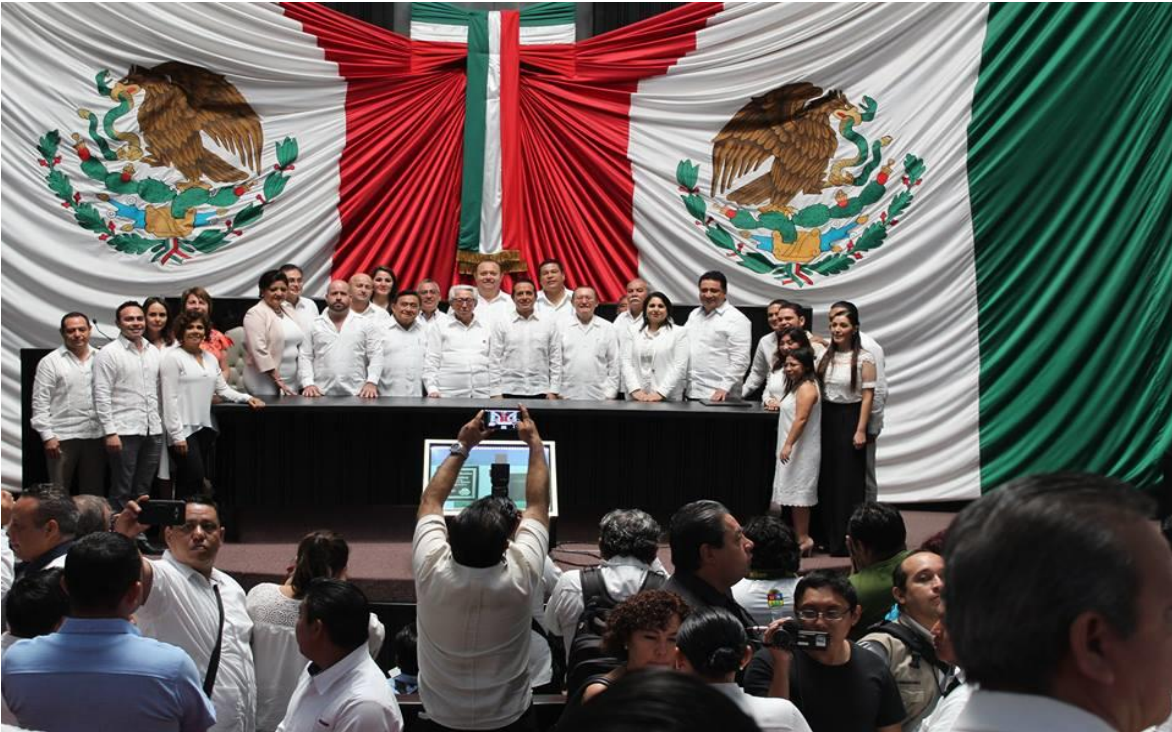
SESION SOLEMNE CON MOTIVO DEL XLII ANIVERSARIO DE LA PROMULGACIÓN DE LA CONSTITUCIÓN POLÍTICA DEL ESTADO DE QUINTANA ROO.