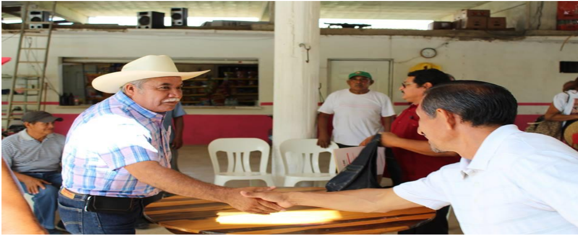
ESCUCHANDO Y ATENDIENDO LAS NECESIDADES DE DIVERSOS PRODUCTORES EN EL MUNICIPIO DE JOSE MARIA MORELOS. (16 OCTUBRE 2016)