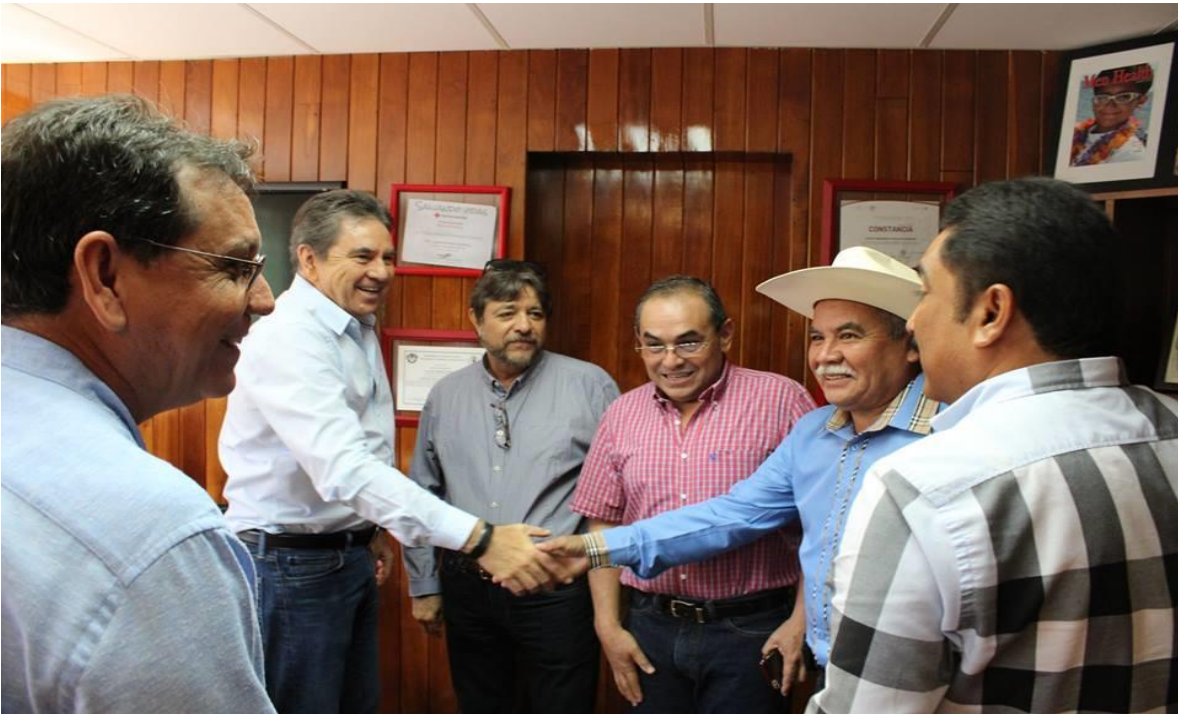
PARTICIPANDO EN LA PRESENTACIÓN DEL PROYECTO MÉXICO ALIMENTARIA 2016 EN COORDINACIÓN CON LA SAGARPA Y AUTORIDADES MUNICIPALES. (21 OCTUBRE 2016)