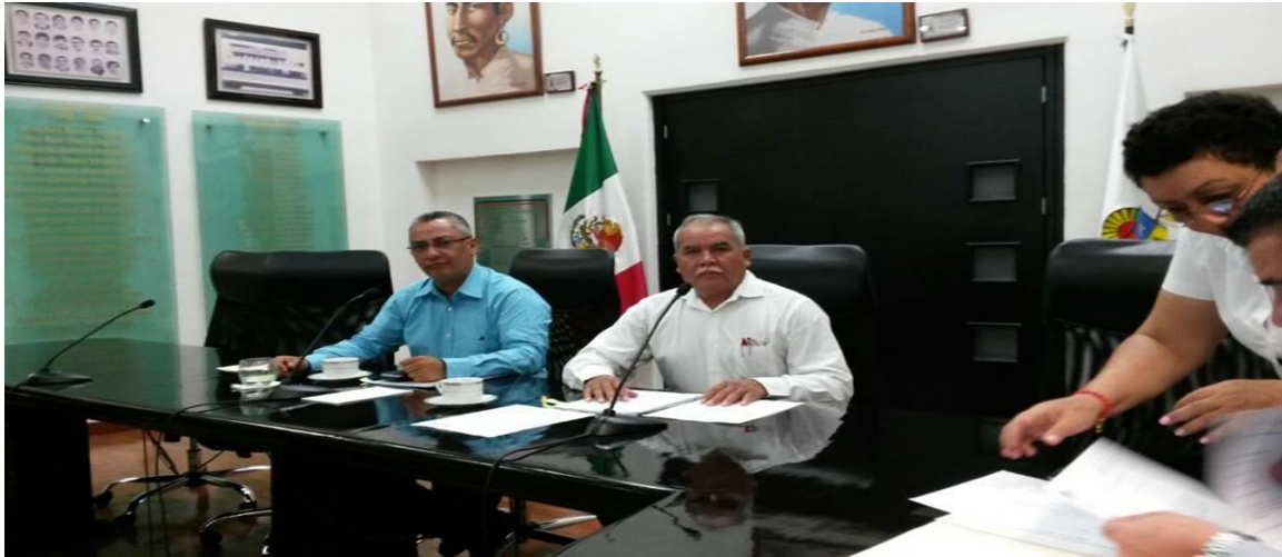
INSTALACION DE LA COMISIÓN DE JUSTICIA ( 19 DE SEPTIEMBRE 2016)