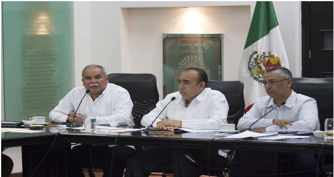
COMPARECENCIA DEL FICAL GENERAL DEL ESTADO LIC. CARLOS ARTURO ÁLVAREZ ESCALERA (21 SEPTIEMBRE 2106)