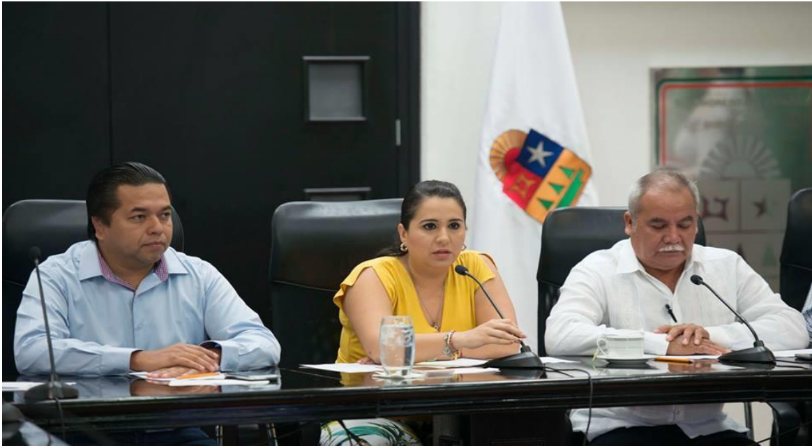
INSTALACIÓN DE LA COMISION ANTICORRUPCIÓN, PARTICIPACIÓN CIUDADANA Y ORGANOS AUTONOMOS. (28 SEPTIEMBRE 2016)