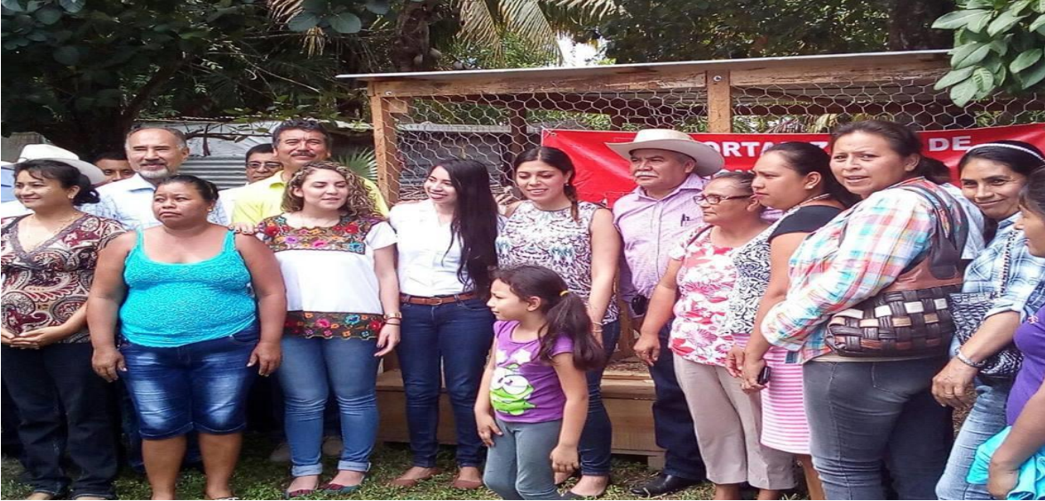
VISITANDO LAS COMUNIDADES DE PALMAR, SACXAN Y CARLOS A. MADRAZO, CON LA FINALIDAD DE SOSTENER REUNIONES CON LAS PRODUCTORAS DE HORTALIZAS DE ESTAS COMUNIDADES A INVITACIÓN EXPRESA DE LA DELEGACIÓN DE SAGARPA. (29 SEPTIEMBRE 2016)