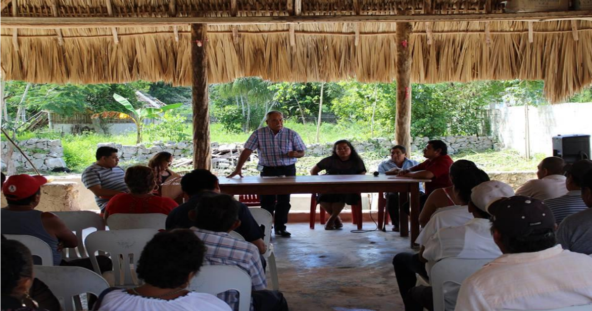
ESCUCHANDO Y ATENDIENDO LAS NECESIDADES DE DIVERSOS PRODUCTORES DEL MUNICIPIO DE FELIPE CARRILLO PUERTO. (16 OCTUBRE 2016)