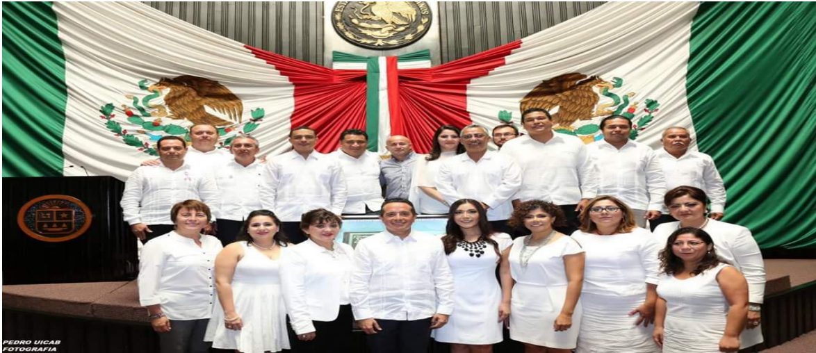
XLII ANIVERSARIO DE LA CONVERSIÓN DE TERRITORIO FEDERAL A ESTADO LIBRE Y SOBERANO DE QUINTANA ROO. (8 OCTUBRE DE 2017)