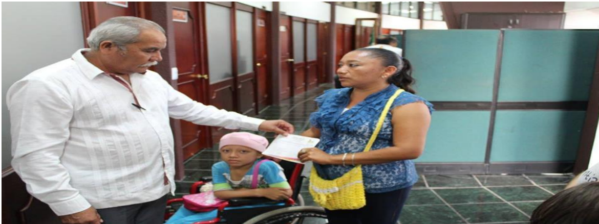
ATENDER LAS NECESIDADES DE SALUD SIEMPRE SERA UNA DE MIS PRIORIDADES. APOYANDO CON MEDICAMENTOS Y EFECTIVO PARA ALIMENTOS (23 DE ENERO 2016)