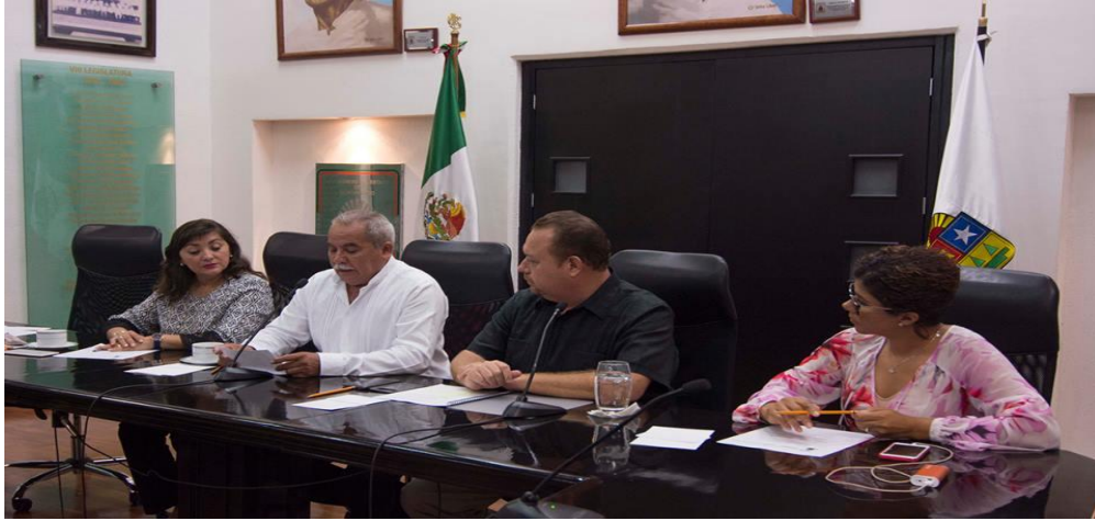
INSTALACIÓN DE LA COMISION DE DESARROLLO RURAL Y PESQUERO (20 SEPTIEMBRE 2017)