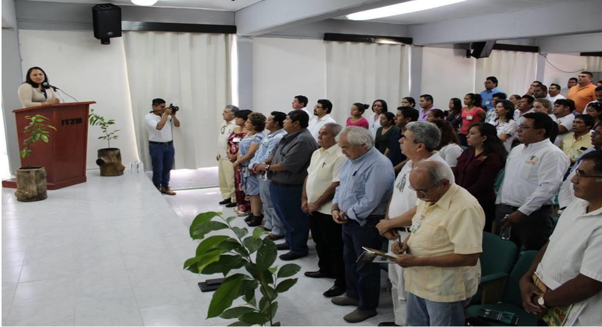
CONMEMORACIÓN DEL 40 ANIVERSARIO DEL INSTITUTO TECNOLÓGICO DE LA ZONA MAYA. (3 OCTUBRE 2016)