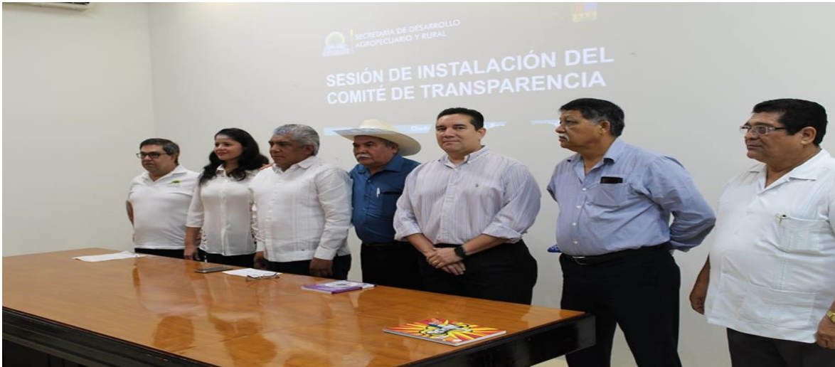
INSTALACIÓN DEL COMITÉ DE TRANSPARENCIA DE LA SECRETARIA DE DESARROLLO AGROPECUARIO Y RURAL (SEDARU) (17 DE OCTUBRE 2016)