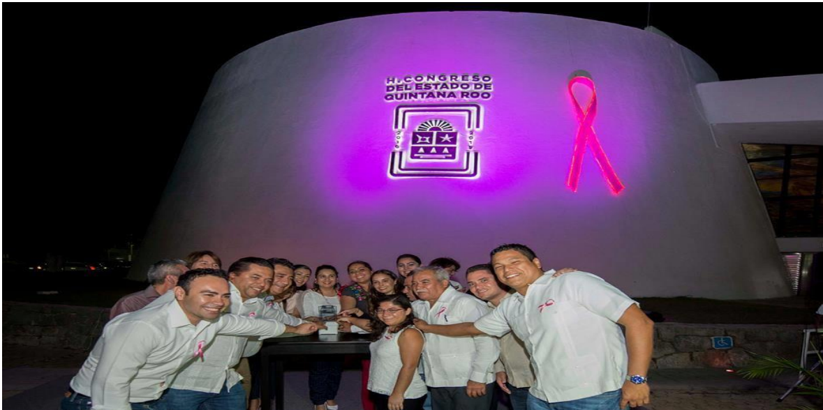
PROMOVIENDO LA SENSIBILIZACIÓN SOBRE EL CÁNCER DE MAMA. (3 OCTUBRE 2016)