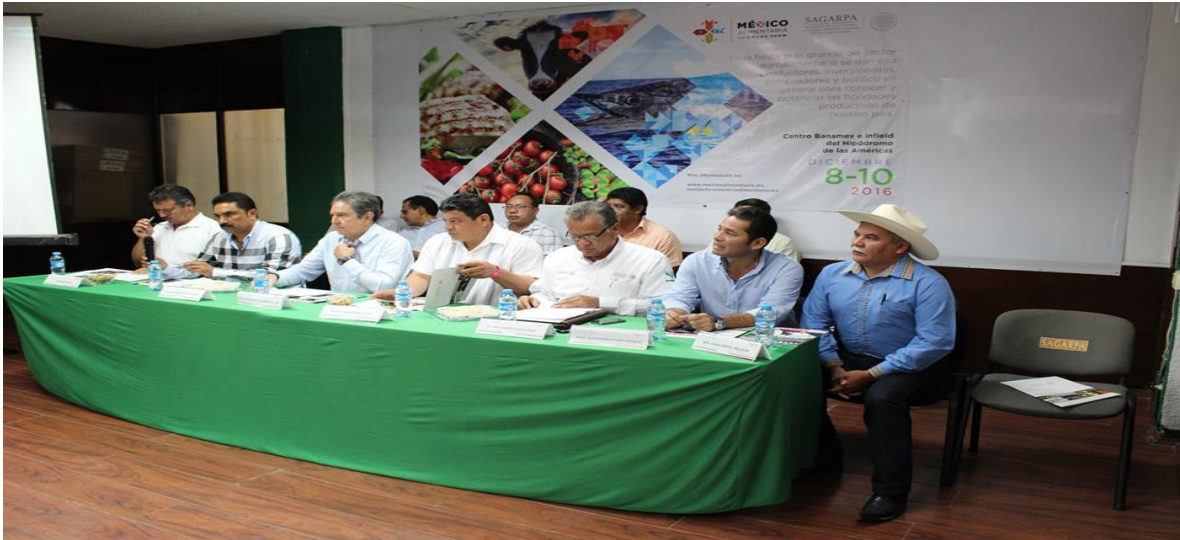
PARTICIPANDO EN LA PRESENTACIÓN DEL PROYECTO MÉXICO ALIMENTARIA 2016 EN COORDINACIÓN CON LA SAGARPA Y AUTORIDADES MUNICIPALES. (21 OCTUBRE 2016)