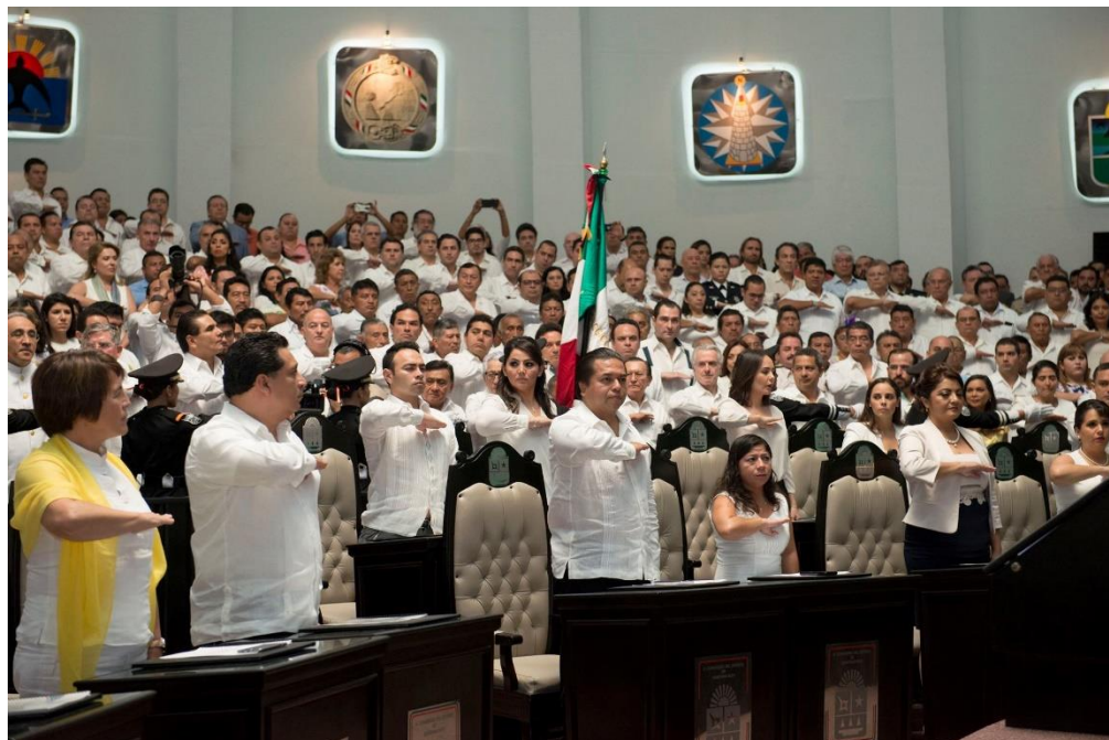
TOMA DE PROTESTA DEL C. GOBERNADOR DEL ESTADO: CARLOS JOAQUIN GONZÁLEZ