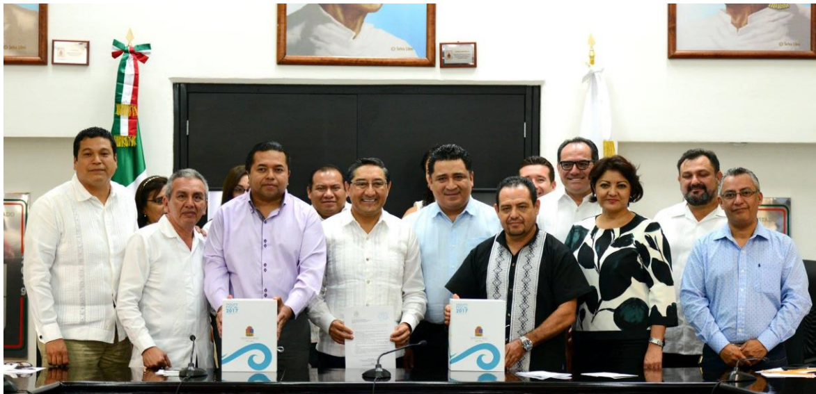
RECEPCIÓN DEL PAQUETE FISCAL 2017