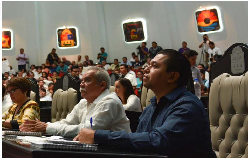
TERA SESIÓN ORDINARIA DEL 1ER AÑO DE EJERCICIO CONSTITUCIONAL