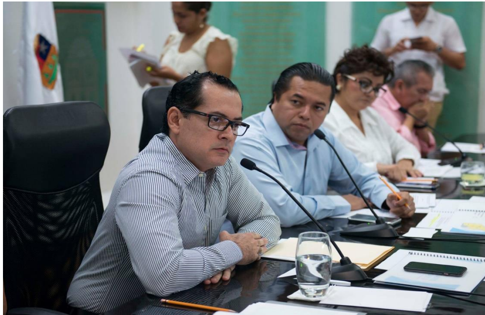
COMPARECENCIA DEL SRIO GRAL. DE VIP SAESA