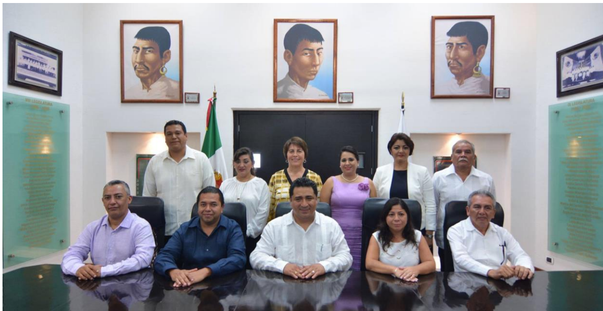
INSTALACIÓN DE LA XV LEGISLATURA