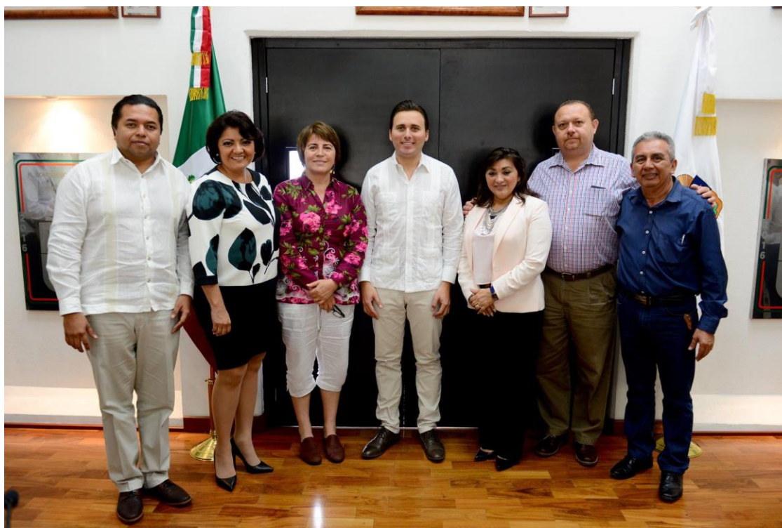
PRESENTACIÓN DE PROYECTOS DE PRESUPUESTOS 2017