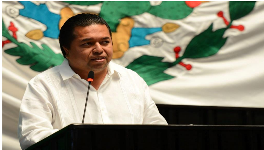
SESION ORDINARIA DEL 2DO PERIODO ORDINARIO