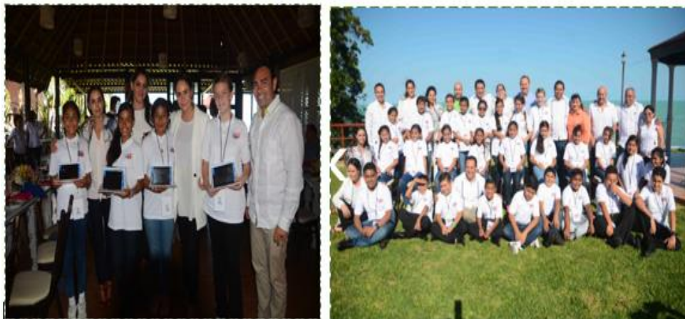
Desayuno con Niños Diputados y Legisladores.