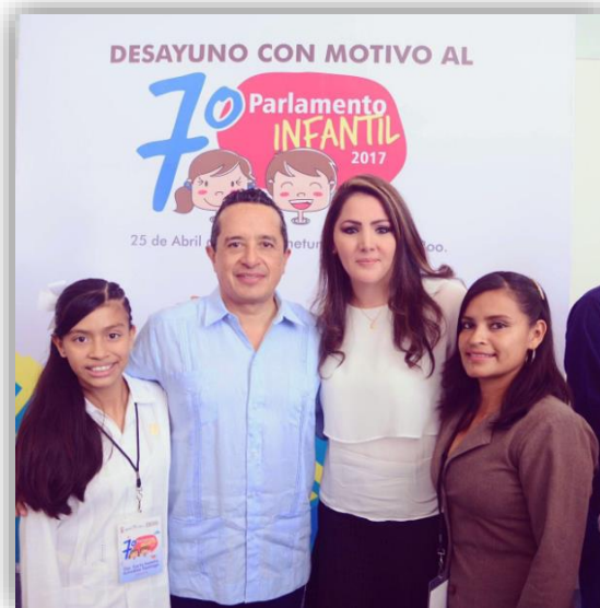
Desayuno con el Gobernador Constitucional del Estado Lic. Carlos Joaquín González.