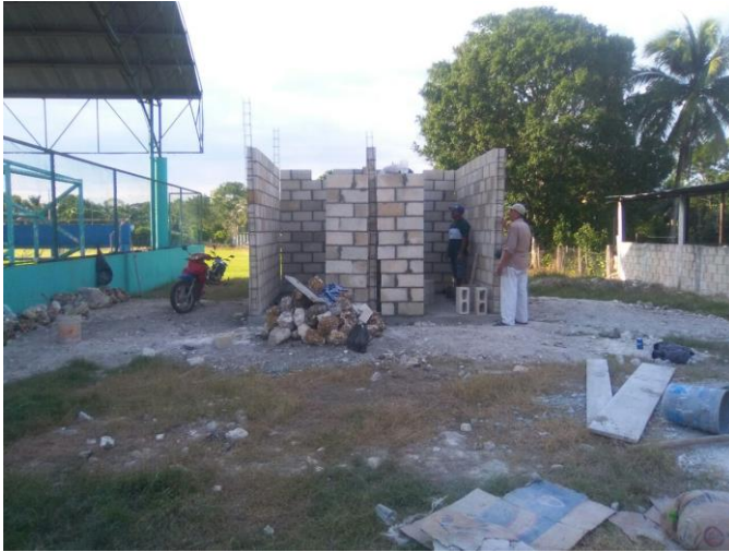
Entrega de apoyo de material de construcción para continuar la construcción de los baños del Domo de la comunidad de Cacao.