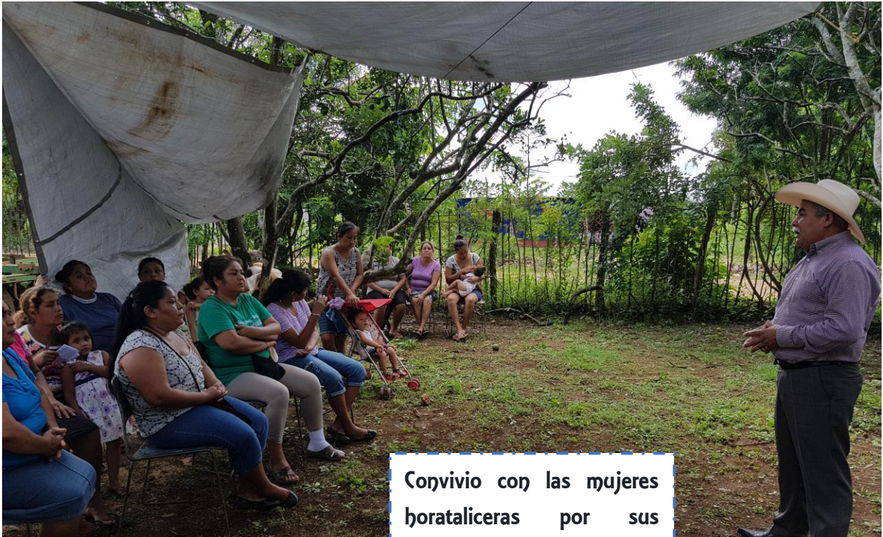
Convivio con las mujeres hortaliceras por sus primeras cosechas de chiles habañeros.