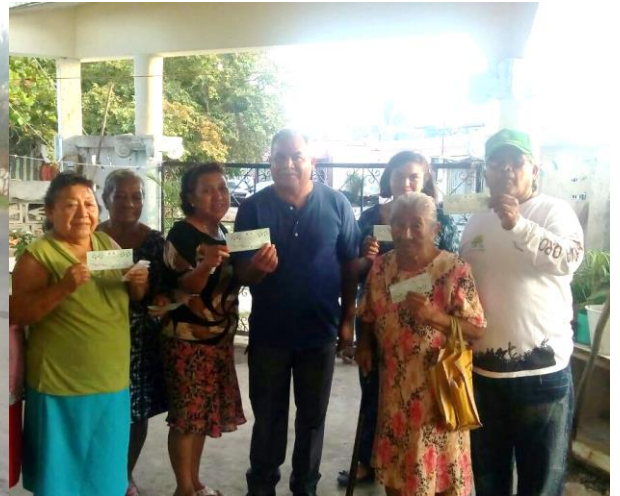
Entrega de Vales de Pavos a Adultos Mayores.

PRESIDENTE DE LA COMISIÓN DE DESARROLLO RURAL Y PESQUERO