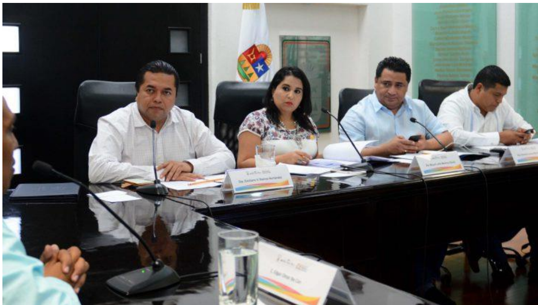
Congreso del Estado de Quintana Roo, XV Legislatura Primer Informe de Actividades Legislativas y de Gestión Segundo Año de Ejercicio Constitucional septiembre 2017- febrero 2018.