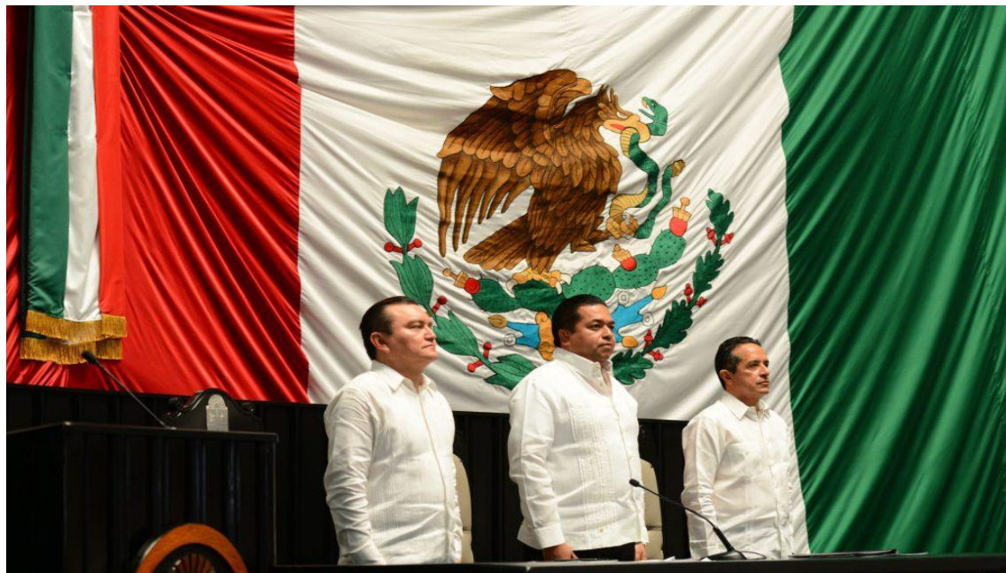
Congreso del Estado de Quintana Roo, XV Legislatura Primer Informe de Actividades Legislativas y de Gestión Segundo Año de Ejercicio Constitucional septiembre 2017- febrero 2018.