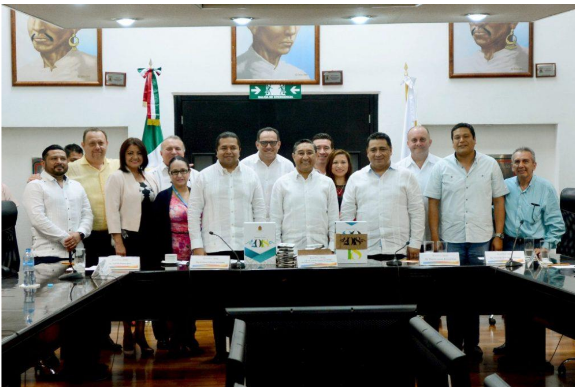
Congreso del Estado de Quintana Roo, XV Legislatura Primer Informe de Actividades Legislativas y de Gestión Segundo Año de Ejercicio Constitucional septiembre 2017- febrero 2018.