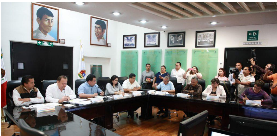
Congreso del Estado de Quintana Roo, XV Legislatura Primer Informe de Actividades Legislativas y de Gestión Segundo Año de Ejercicio Constitucional septiembre 2017- febrero 2018.