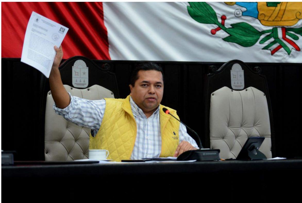
Congreso del Estado de Quintana Roo, XV Legislatura Primer Informe de Actividades Legislativas y de Gestión Segundo Año de Ejercicio Constitucional septiembre 2017- febrero 2018.