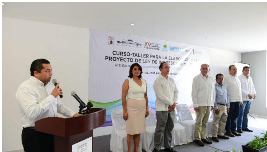
Congreso del Estado de Quintana Roo, XV Legislatura Primer Informe de Actividades Legislativas y de Gestión Segundo Año de Ejercicio Constitucional septiembre 2017- febrero 2018.