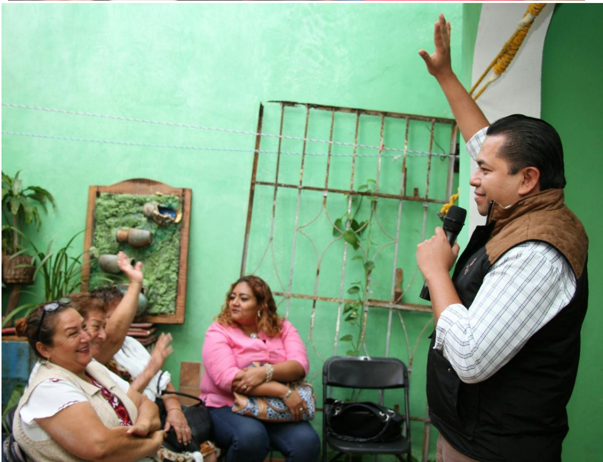
Congreso del Estado de Quintana Roo, XV Legislatura Primer Informe de Actividades Legislativas y de Gestión Segundo Año de Ejercicio Constitucional septiembre 2017- febrero 2018.