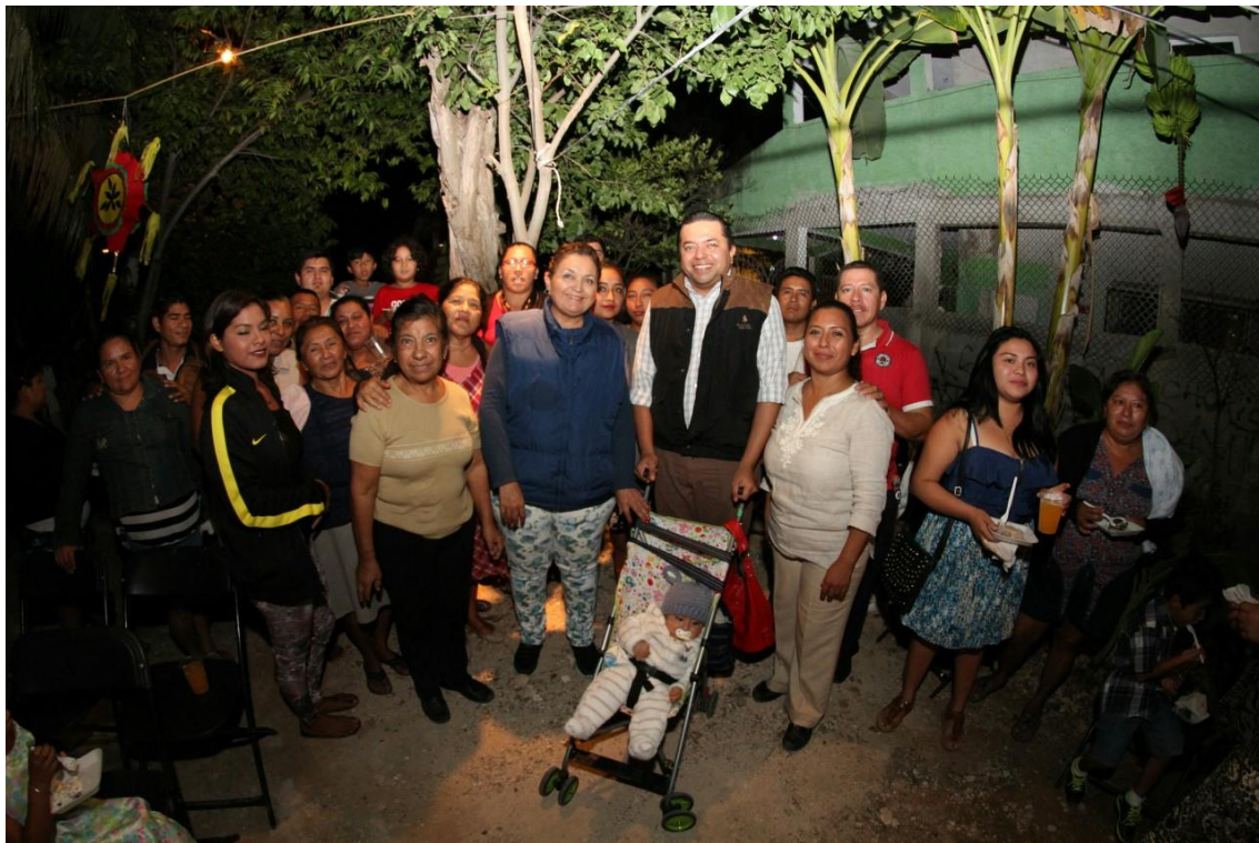
Congreso del Estado de Quintana Roo, XV Legislatura Primer Informe de Actividades Legislativas y de Gestión Segundo Año de Ejercicio Constitucional septiembre 2017- febrero 2018.