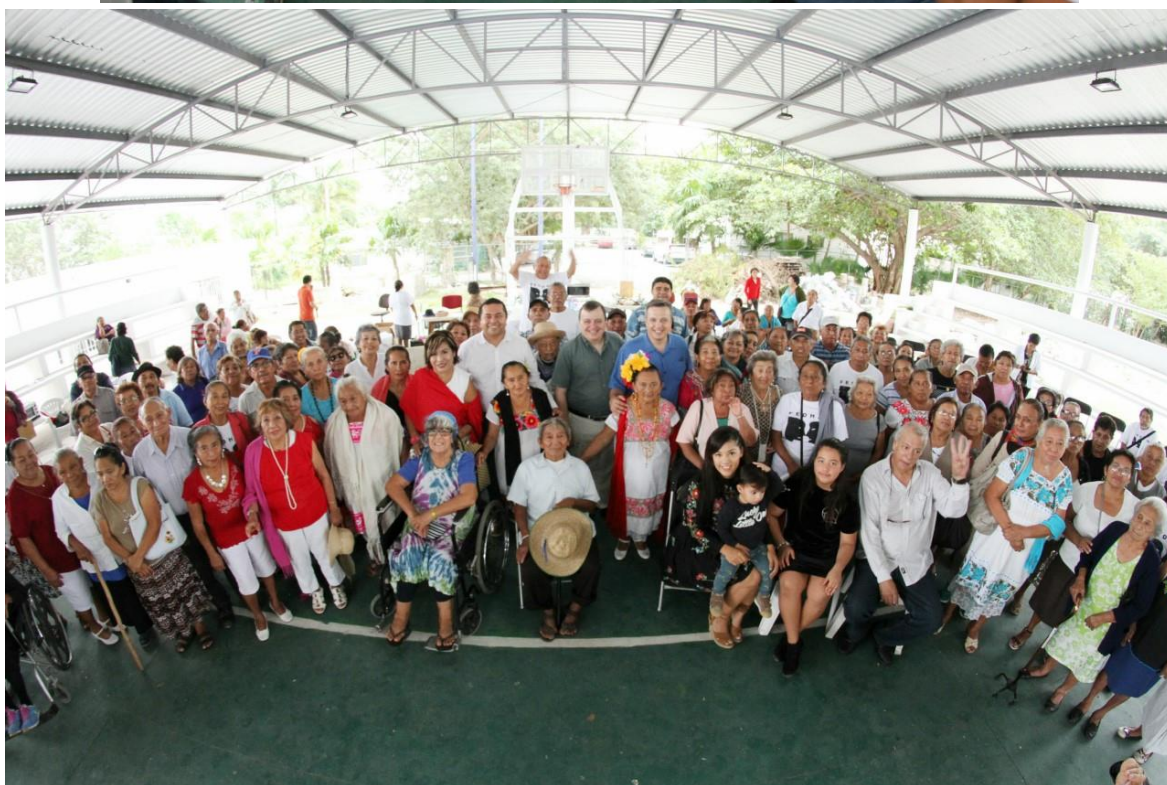
Congreso del Estado de Quintana Roo, XV Legislatura Primer Informe de Actividades Legislativas y de Gestión Segundo Año de Ejercicio Constitucional septiembre 2017- febrero 2018.