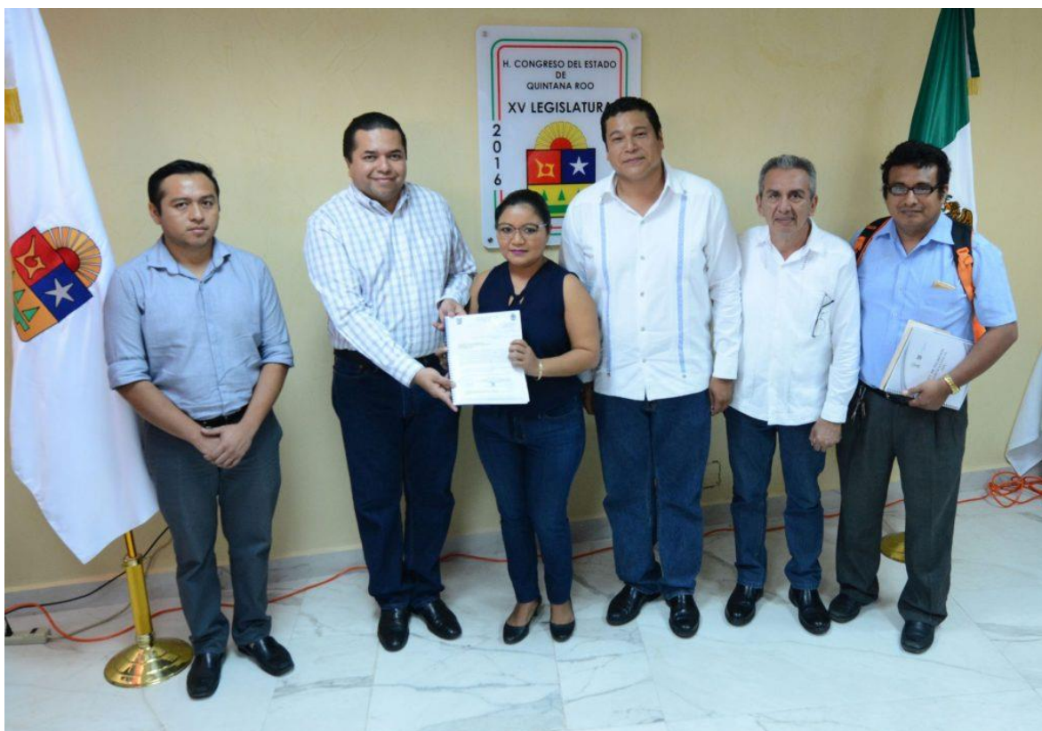
Congreso del Estado de Quintana Roo, XV Legislatura Primer Informe de Actividades Legislativas y de Gestión Segundo Año de Ejercicio Constitucional septiembre 2017- febrero 2018.