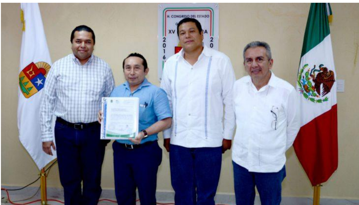
Congreso del Estado de Quintana Roo, XV Legislatura Primer Informe de Actividades Legislativas y de Gestión Segundo Año de Ejercicio Constitucional septiembre 2017- febrero 2018.