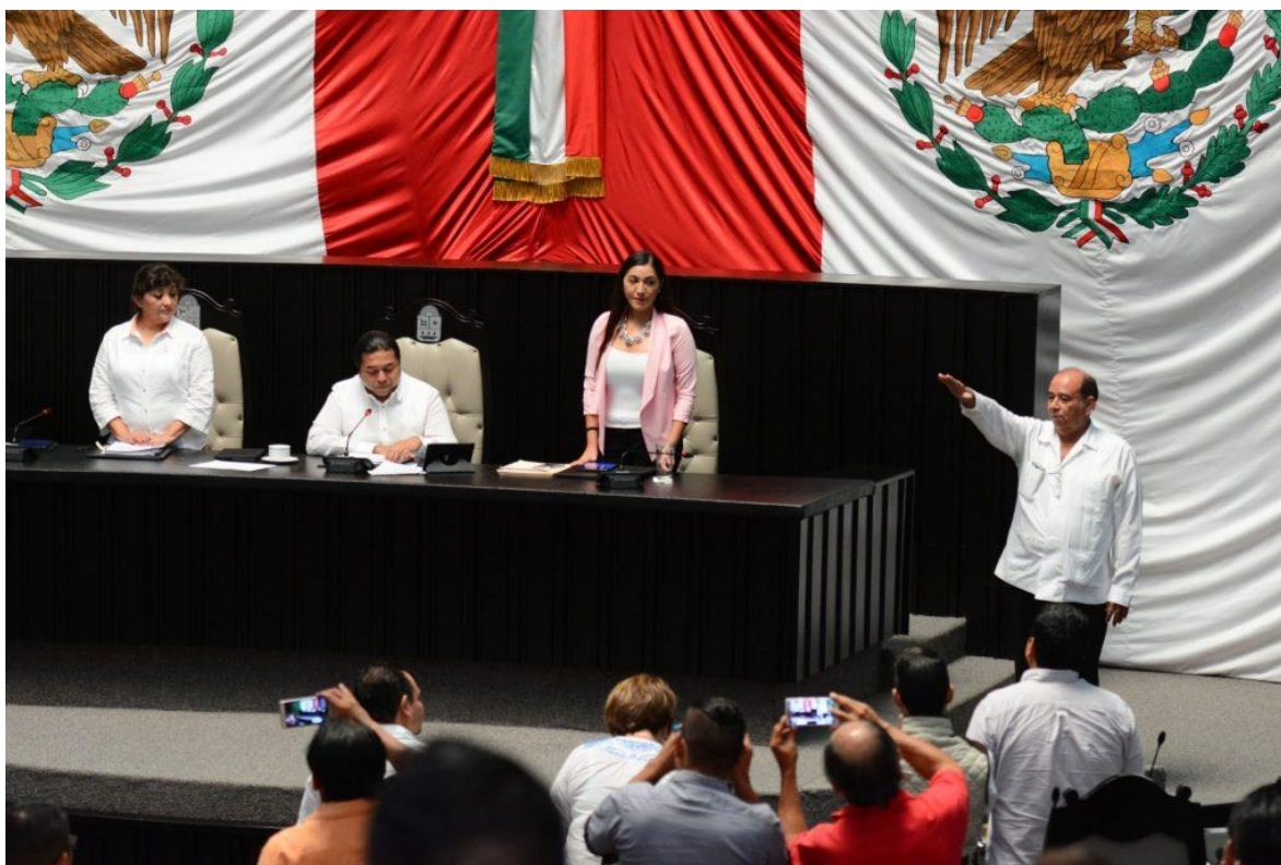
Congreso del Estado de Quintana Roo, XV Legislatura Primer Informe de Actividades Legislativas y de Gestión Segundo Año de Ejercicio Constitucional septiembre 2017- febrero 2018.