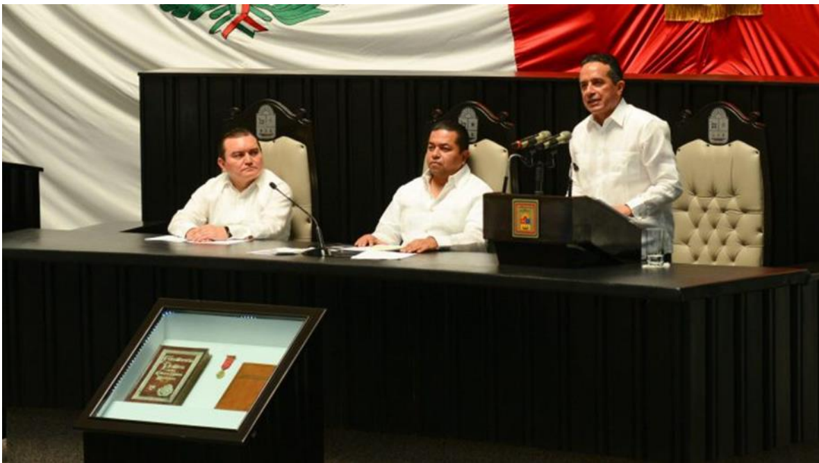
Congreso del Estado de Quintana Roo, XV Legislatura Primer Informe de Actividades Legislativas y de Gestión Segundo Año de Ejercicio Constitucional septiembre 2017- febrero 2018.