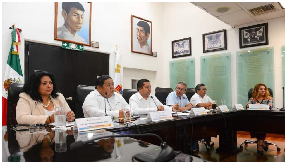
Reunión de Comisiones Unidas 09 de julio: Puntos Legislativos y técnica parlamentaria, y de Hacienda, Pto y Cuenta Tema: Análisis de la Iniciativa por la que se crea el Reglamento Interior de la Auditoría Superior del Edo. De QRo.