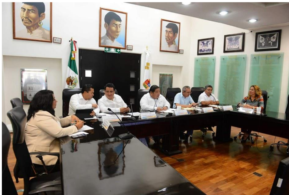
Reunión de Comisiones Unidas 09 de julio: Puntos Legislativos y técnica parlamentaria, y de Comunicaciones y Transportes Tema: Análisis de Iniciativas por la que se reforman diversas disposiciones de la Ley de Movilidad