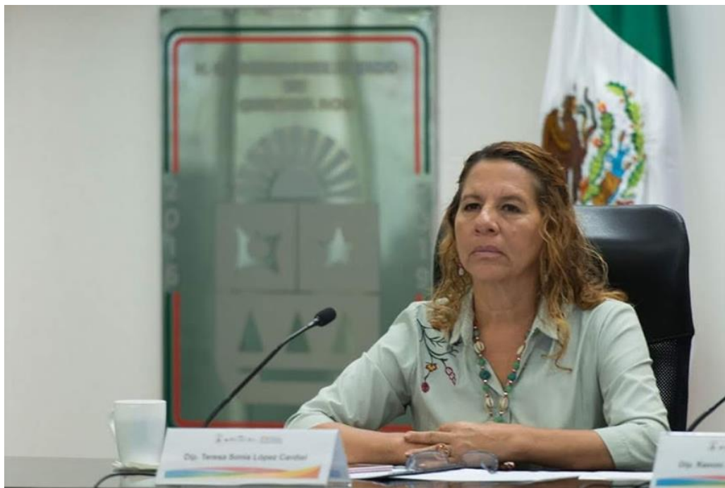
Reunión de Comisiones 22 de agosto: Asuntos Municipales Tema: Análisis de oficios remitidos por el H. Ayuntamiento de Cozumel para aprobación de proyecto