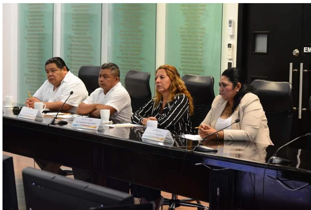
Reunión de Comisiones Unidas 30 de mayo: Hacienda, Pto y Cuenta y Seguridad Tema: Análisis de la Iniciativa por la que se autoriza al Poder Ejecutivo, por conducto de la Secretaria de Seg. Pública para celebrar arrendamiento puro de equipo y tecnología: “Proyecto Quintana Roo Seguro”