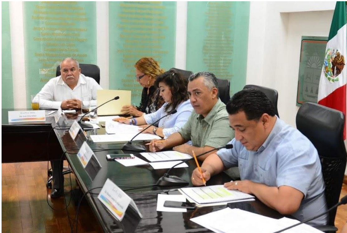
Reunión de Comisiones Unidas 22 de mayo: Puntos Legislativos y técnica parlamentaria, de Justicia y Desarrollo Familiar Tema: Análisis de Iniciativas por la que se reforma el artículo 538 del Código Civil para el Edo. De QRoo