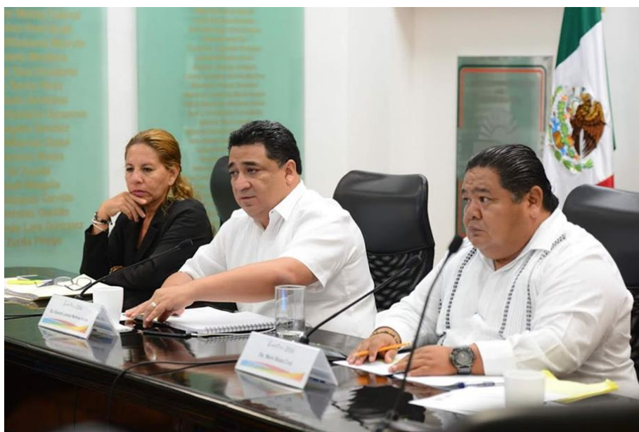
Reunión de Comisiones Unidas 28 de mayo: Puntos Legislativos y técnica parlamentaria y de Comunicaciones y Transportes Tema: Análisis a la Ley de Movilidad