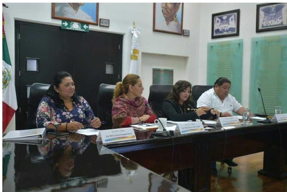
Reunión de la Comisión de Derechos Humanos: 22 de junio: Entrevistas a los aspirantes