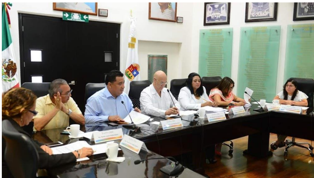
Reunión de Comisiones Unidas 16 de mayo: Puntos Legislativos y técnica parlamentaria y Desarrollo Urbano Tema: Análisis de la Iniciativa por la que se expide la Ley de Asentamientos Humanos