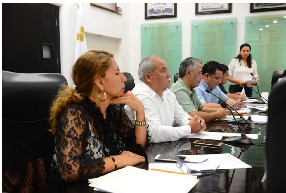
Reunión de Comisiones Unidas 22 de mayo: Puntos Legislativos y técnica parlamentaria y de Justicia Tema: Análisis de la Iniciativa por la que se adicionan y derogan disposiciones a la Ley de Víctimas del Edo de Q Roo.