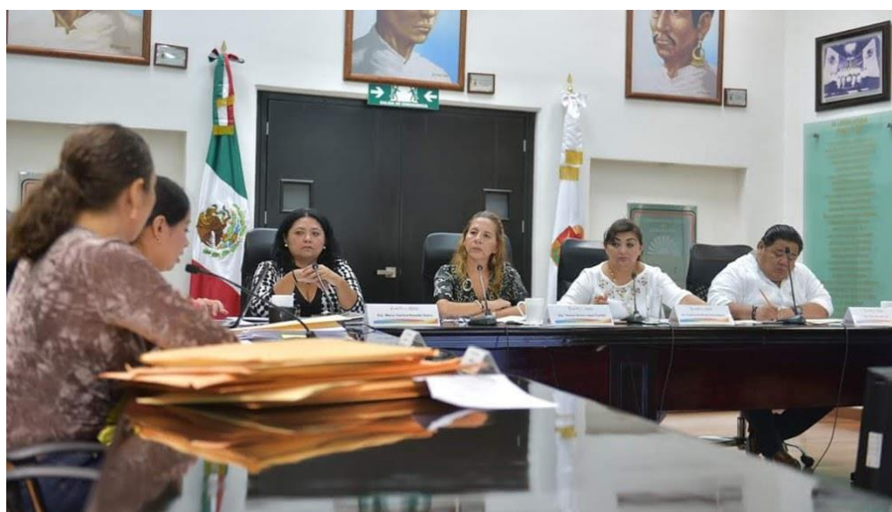
Reunión de la Comisión de Derechos Humanos: 21 de junio: revisión de Propuestas.