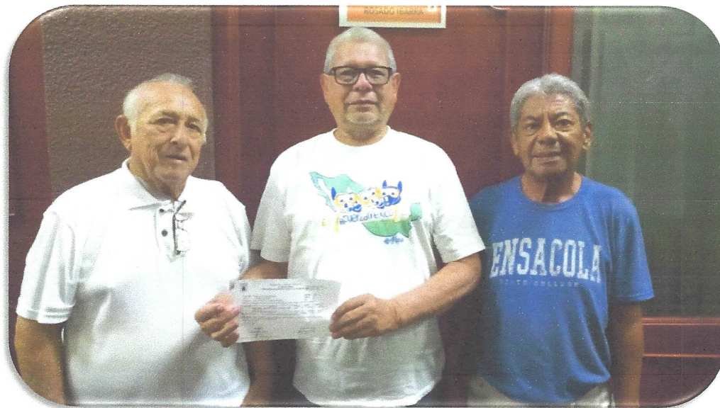
Apoyo para artículos deportivos.