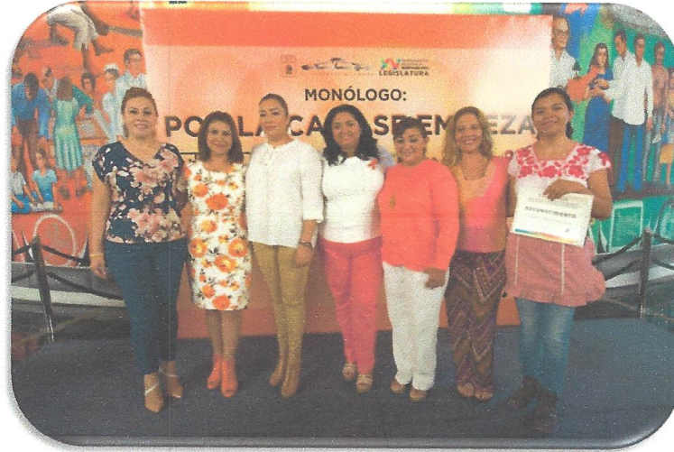
Monólogo “Por la casa se empieza”, organizado por la Comisión de Anticorrupción, Participación Ciudadana y Órganos Autónomos y la Comisión para la Igualdad de Género, de fecha 25 de julio de 2018.