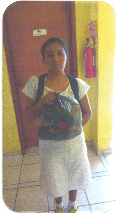
Apoyo para transporte.