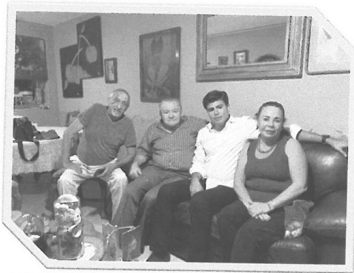
Entrega de cámaras de video