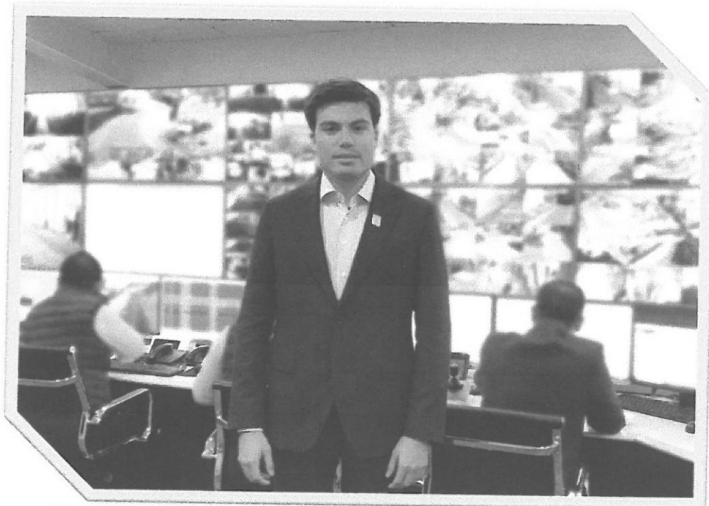
Visita a Centros de Inteligencia Privados.