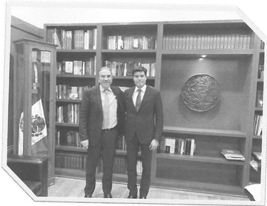
Reunión con el Ministro Javier Laynez Potisek de la Suprema Corte de Justicia de la Nación, relativa a la Controversia Constitucional 226/2019