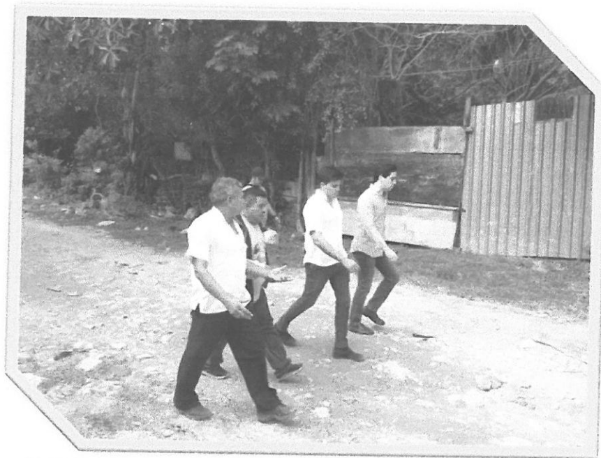
Recorrido en Tres Reyes con la ciudadanía.