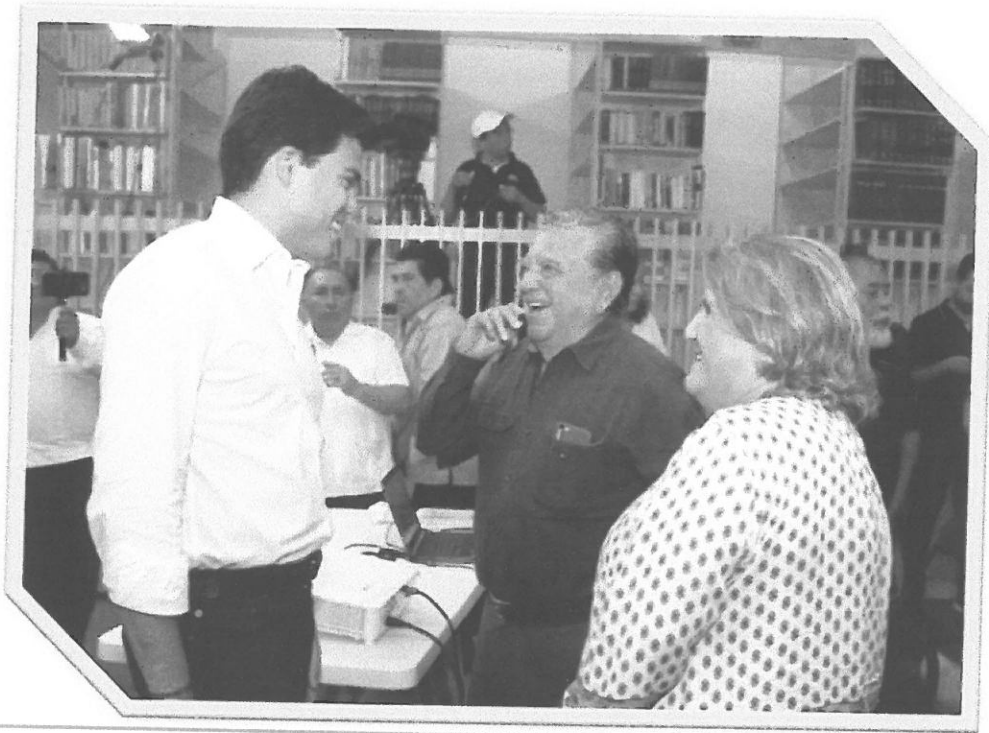
Asistencia a Conferencias sobre los 50 años del Municipio.