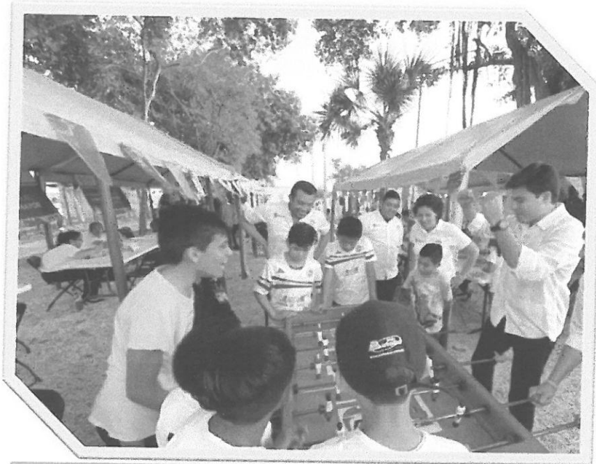
Campañas para incentivar la sana convivencia.