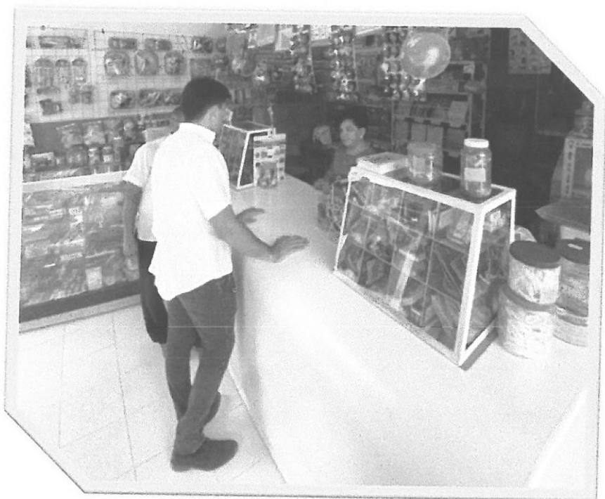
Caminata casa por casa.