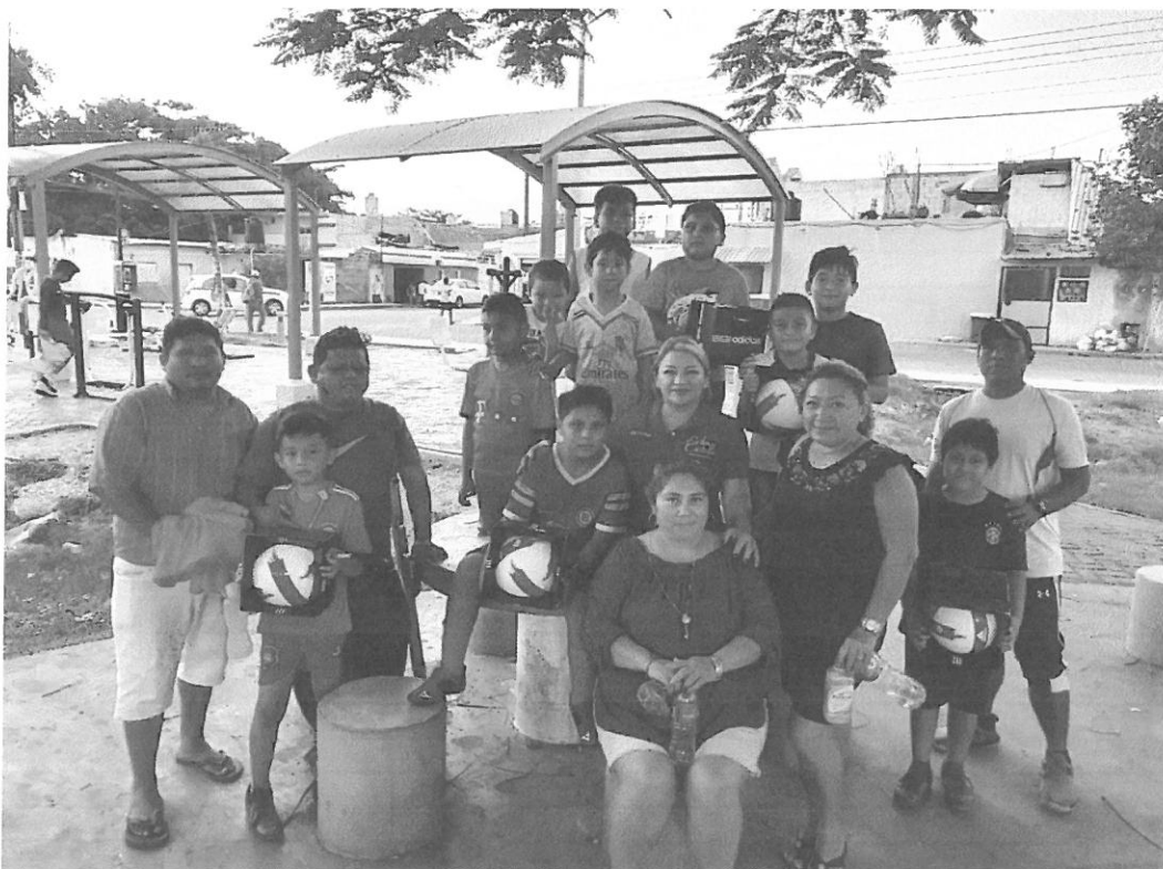
Atención a los padres de familia del club deportivo de la región 100.