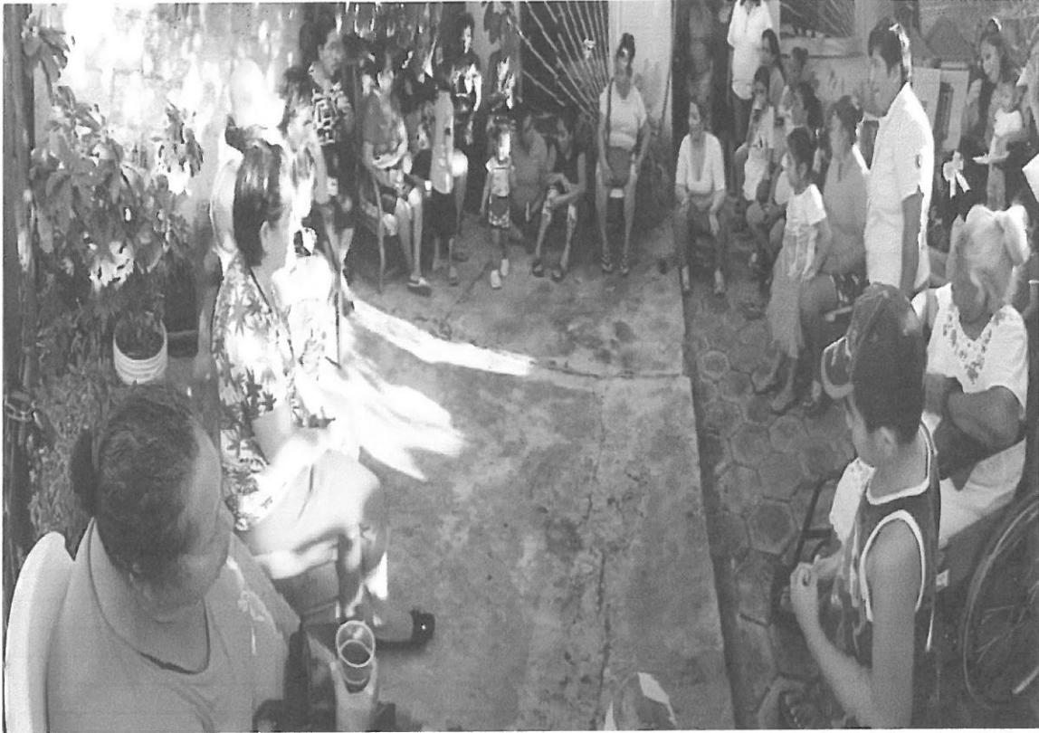
Reunión con vecino de las regiones 100 y 101