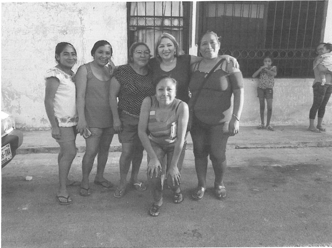
Se realizó una caminata con vecinos de la región 220 y 221.