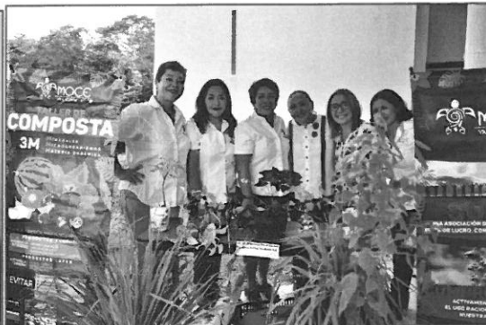
Feria de reciclaje rumbo a la sostenibilidad Universidad de Q. Roo