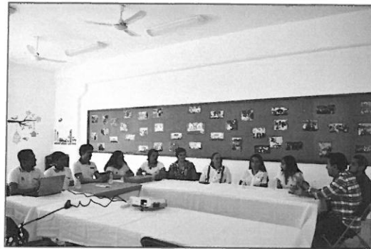
Reunión con integrantes de Canacintra Jóvenes ganadores del premio nacional emprendedores y prototipos santander-conalep 2019 Presentación de su proyecto “eco-sargassum”