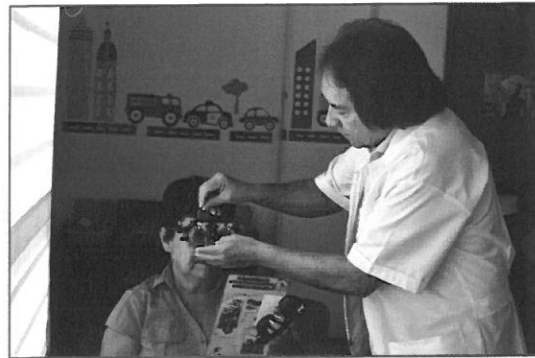
Programa Visión de Futuro