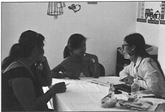
Jornadas de servicios médicos