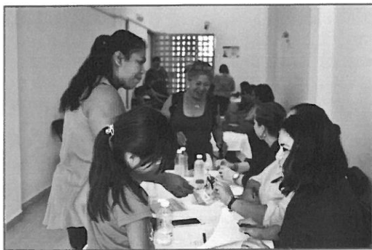
Cursos y talleres