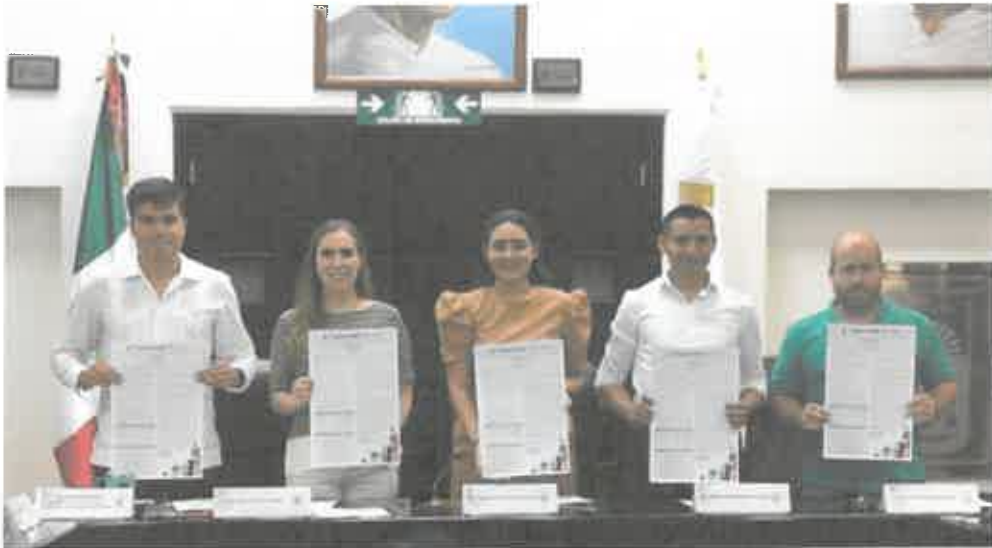
REUNIÓN DE LA COMISIÓN DE DESARROLLO JUVENIL CON IGUALDAD DE OPORTUNIDADES DONDE SE APROBÓ LA CONVOCATORIA AL CUARTO CONGRESO JUVENIL DEL ESTADO DE QUINTANA ROO REALIZADO DEL 23 AL 29 DE NOVIEMBRE. (01 DE OCTUBRE 2019)

morena La esperanza de México Grupo parlamentario