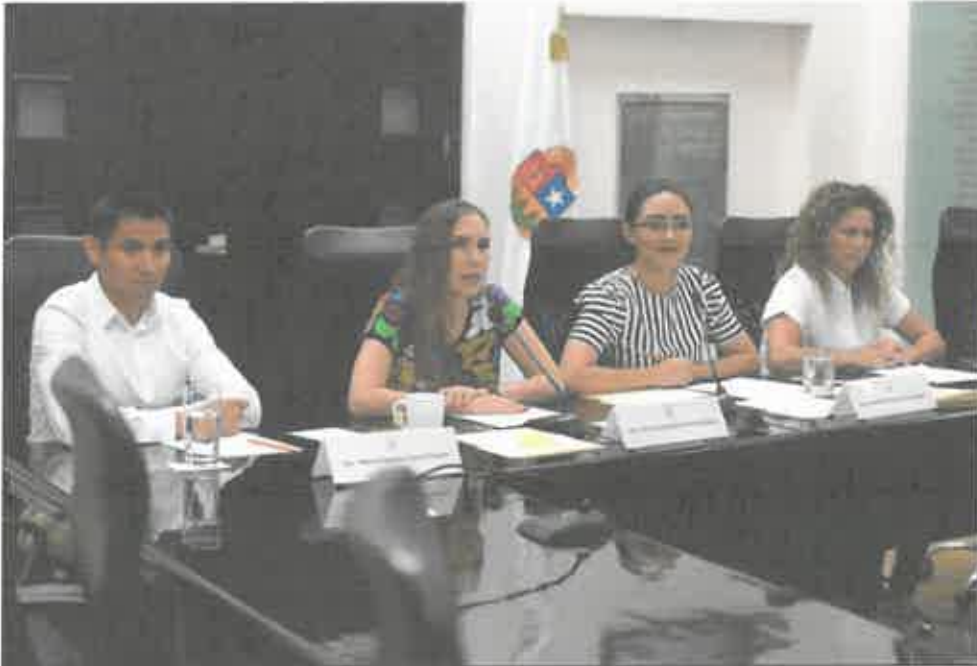
INSTALACION DE LA COMISION DE DESARROLLO JUVENIL (19 SEPTIEMBRE 2019)

morena La esperanza de México Grupo parlamentario