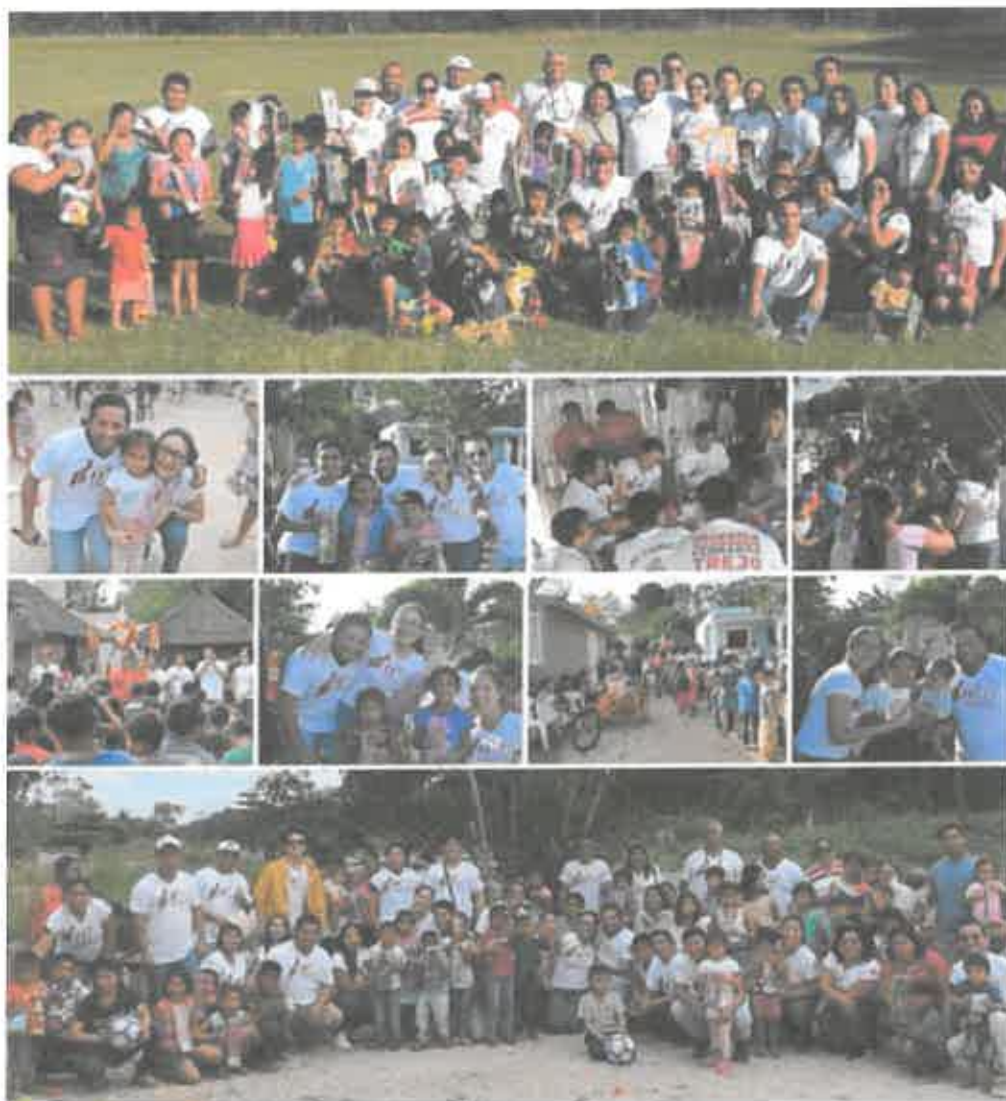
ENTREGA DE JUGUETES A NIÑOS PARA EL DÍA DE REYES (07 ENERO 2020)

morena La esperanza de México Grupo parlamentario