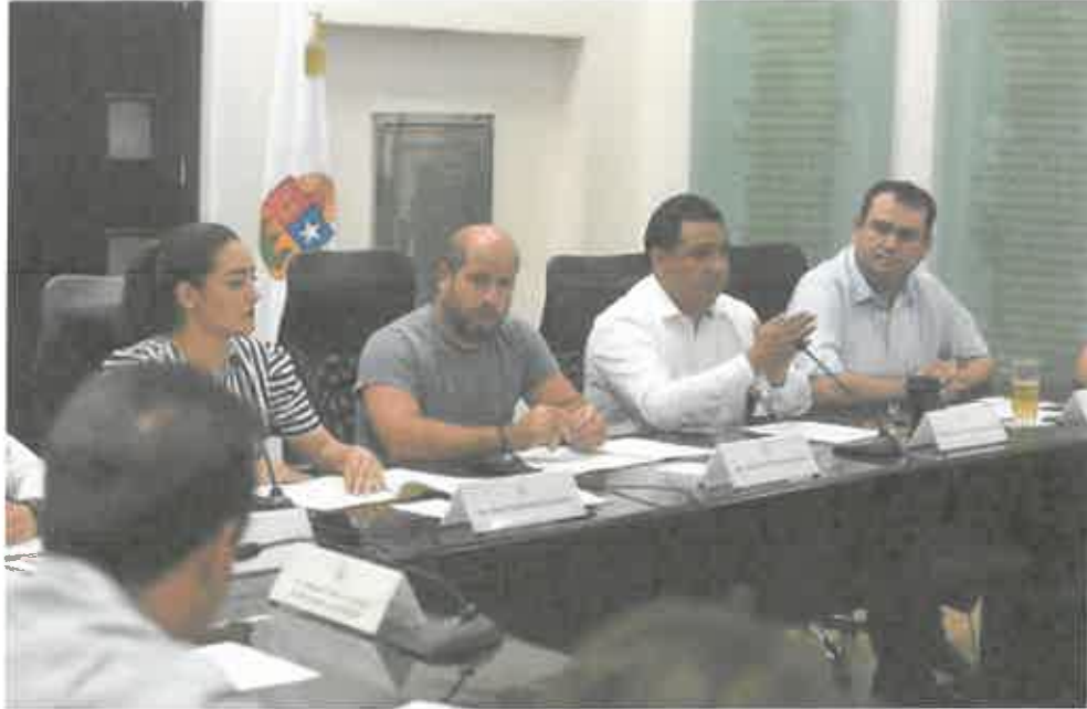
INSTALACIÓN DE LA COMISIÓN DE HACIENDA, PRESUPUESTO Y CUENTA. (19 SEPTIEMBRE 2019)

morena La esperanza de México Grupo parlamentario