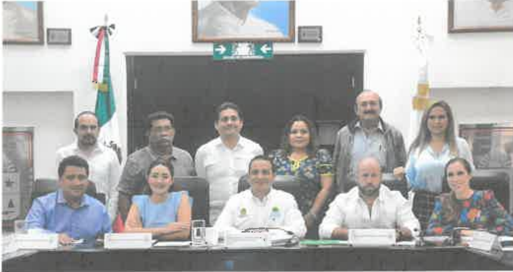
COMPARECENCIA DEL TITULAR DE LA OFICIALIA MAYOR DEL ESTADO DE QUINTANA ROO, MANUEL ISRAEL ALAMILLA CEBALLOS (15 DE OCTUBRE)