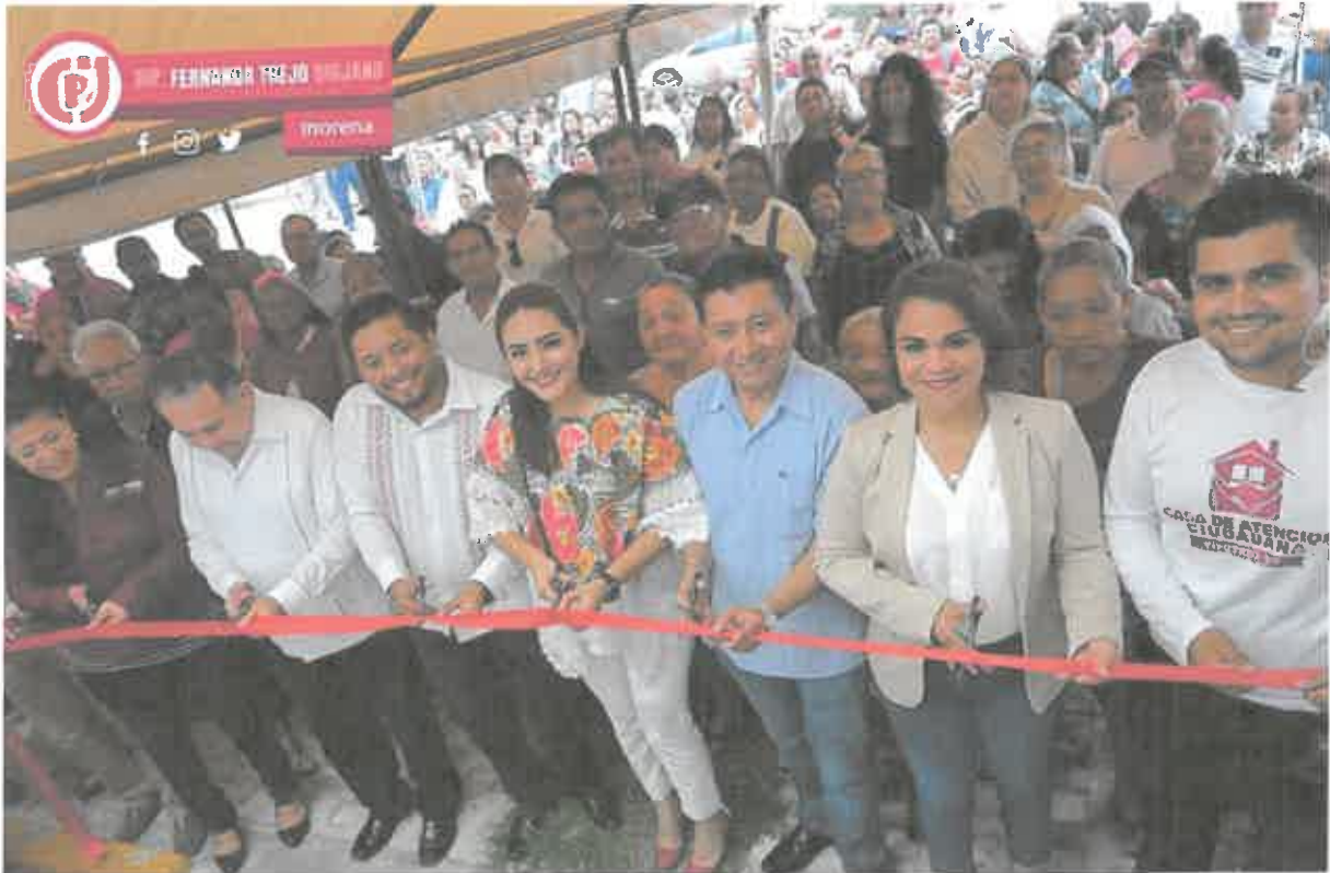
INAUGURACION DE LA CASA DE GESTION EN EL DISTRITO VII, EN LA CIUDAD DE CANCUN, QUINTANA ROO. (6 DE MARZO DE 2020)