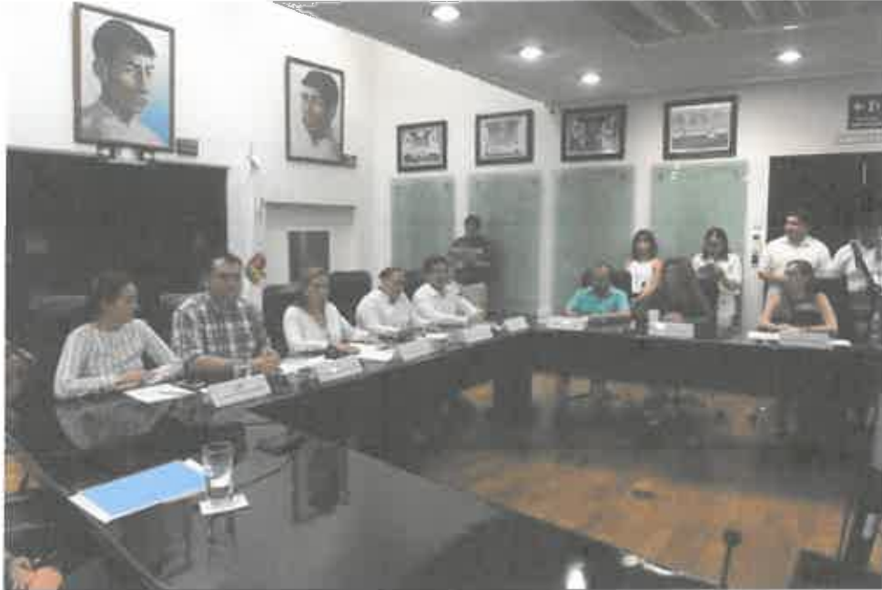
INSTALACION DE LA COMISION DE JUSTICIA (24 DE SEPTIEMBRE 2019)

morena La esperanza de México Grupo parlamentario