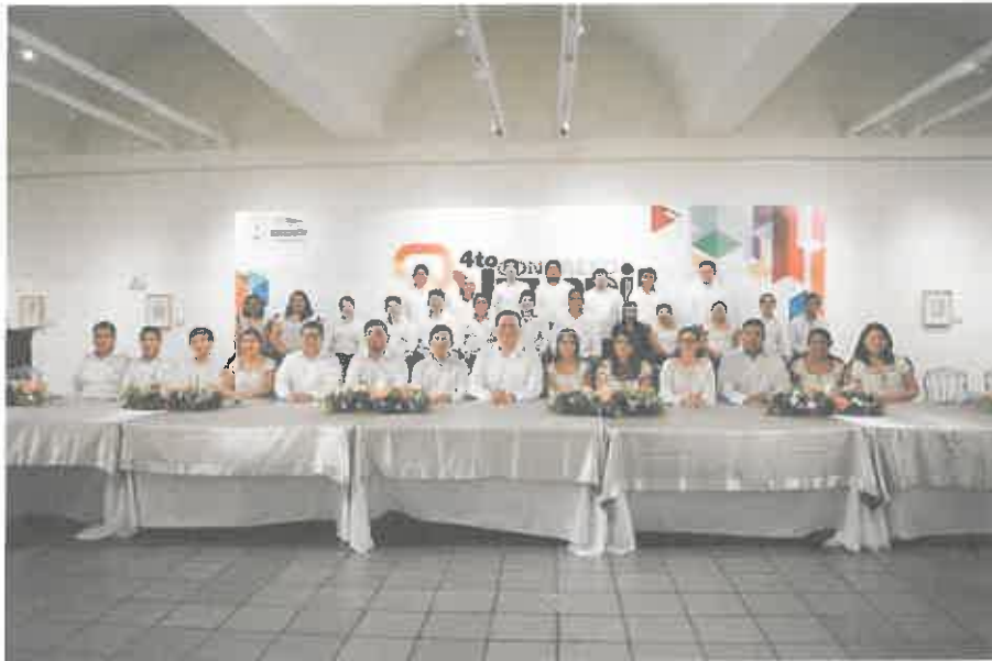
SESIÓN DEL CUARTO CONGRESO JUVENIL CON LA PARTICIPACIÓN DE 26 JÓVENES QUE REPRESENTAN A TODOS LOS DISTRITOS Y MUNICIPIOS DEL ESTADO. (28 DE NOVIEMBRE 2019)

morena La esperanza de México Grupo parlamentario