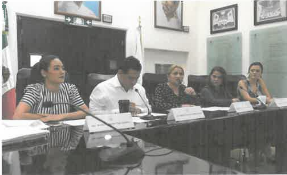
INSTALACIÓN DE LA COMISIÓN DE MOVILIDAD (19 DE SEPTIEMBRE 2019)

morena La esperanza de México Grupo parlamentario