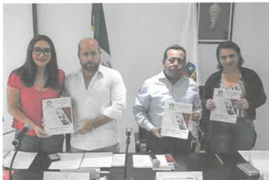
REUNIÓN DE LA COMISIÓN DE HACIENDA, PRESUPUESTO Y CUENTA PARA RECIBIR EL INFORME GENERAL DEL AUDITOR SUPERIOR DEL ESTADO, CUENTA PÚBLICA 2018. (20 DE FEBRERO 2020)