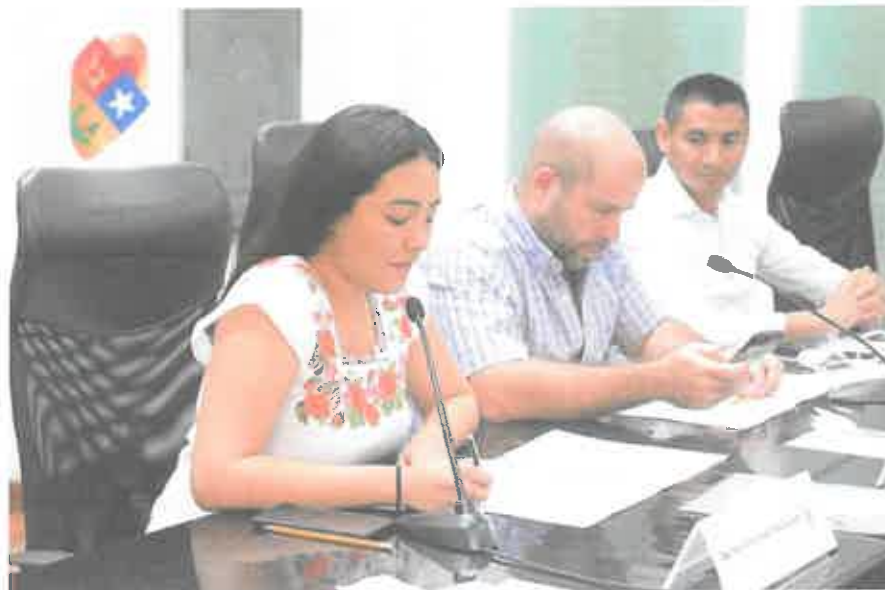
REUNION DE LA COMISION DE HACIENDA PARA ANALIZAR LA INICIATIVA DE LA LEY DE HACIENDA Y LA LEY DE INGRESOS DEL MUNICIPIO DE SOLIDARIDAD (14 DE DICIEMBRE DE 2020)