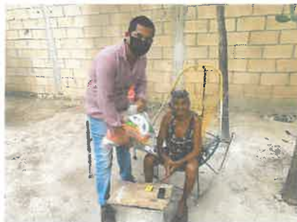
APOYO DESPENSAS BASICAS