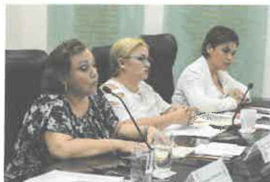
Comparecencia de la Titular de la Administración Portuaria Integral de Quintana Roo (APIQROO).