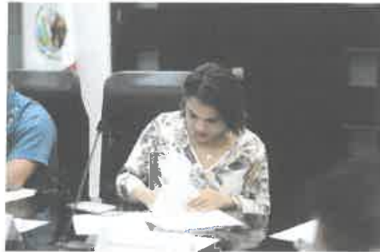
Reunión de la Comisión de Educación, Ciencia y Tecnología.