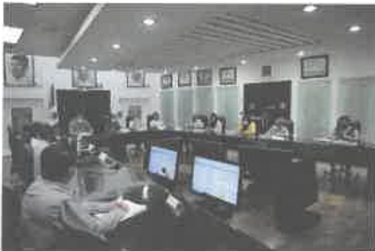
Reunión de las Comisiones unidas de Justicia y para la Igualdad de Género.