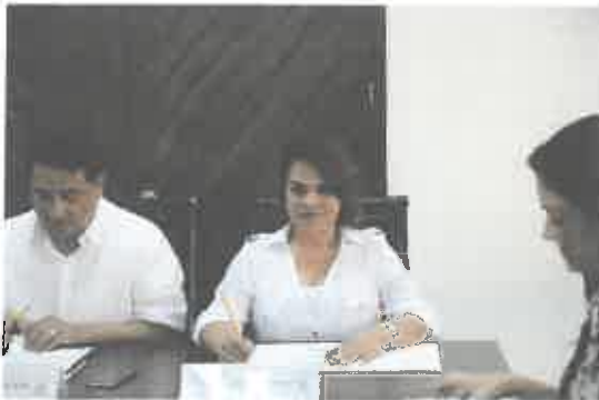
Reunión de la Comisión de Educación, Ciencia y Tecnología.