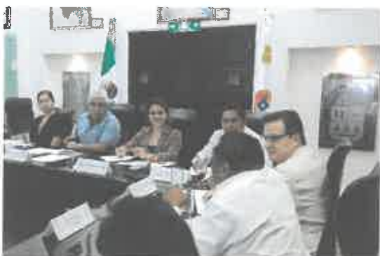
Reunión de la Comisión de Desarrollo Indígena.