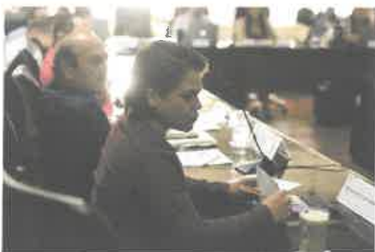
Reunión de trabajo de la Comisión de Hacienda, Presupuesto y Cuenta.