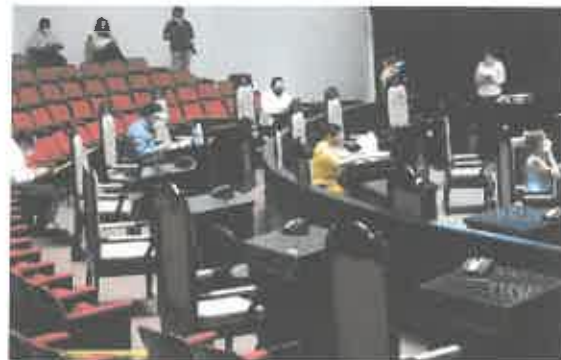
Reunión de la Comisión de Educación, Ciencia y Tecnología.