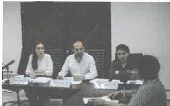
Reunión de la Comisión Para la Igualdad de Género.