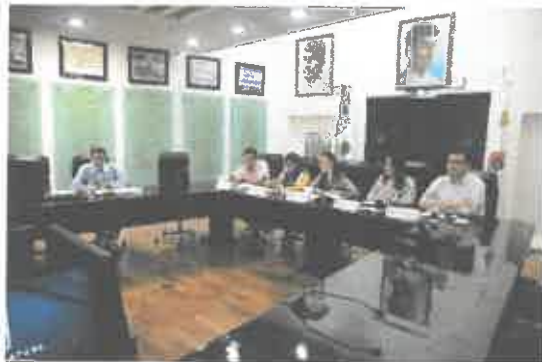
Reunión de la Comisión de Anticorrupción Participación Ciudadana Y Órganos Autónomos.