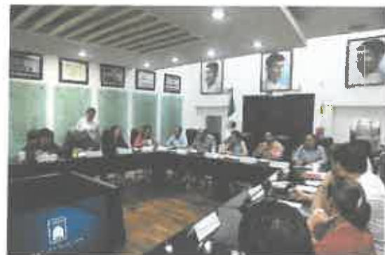
Reunión de la Comisión para la Igualdad de Género y la Comisión de Puntos Legislativos.