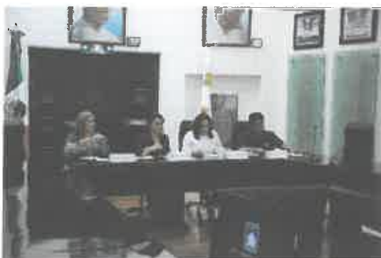
Reunión de la Comisión de Puntos Constitucionales.