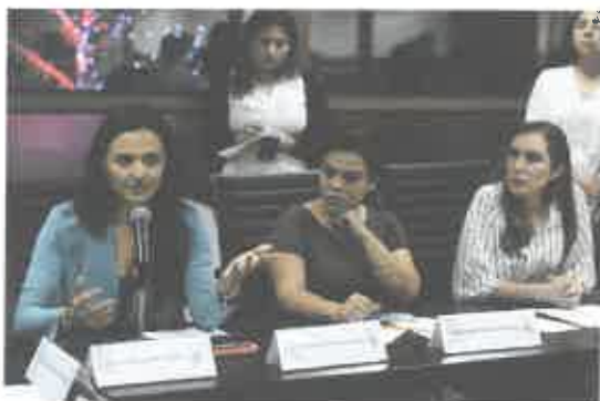
Reunión de Comisiones Unidas de Educación Ciencia y Tecnología y la Comisión de Cultura.