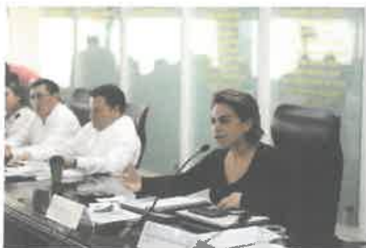
Reunión de la Comisión de Hacienda, Presupuesto y Cuenta.