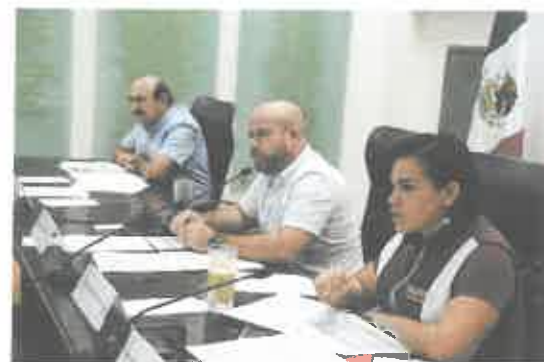
Reunión de la Comisión de Hacienda, Presupuesto y Cuenta.