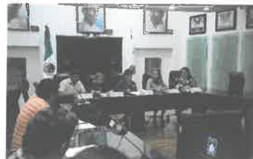
Reunión de la Comisión de Puntos Legislativos y Técnica Parlamentaria.