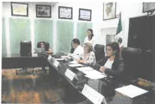
Reunión de la Comisión de Movilidad.

El trabajo en cada una de las comisiones de las cuales soy integrante se ha realizado de manera responsable y tratando en todo momento de dar trámite a través del debate y el análisis a cada uno de las iniciativas presentadas por cada una de las Diputadas y Diputados que integran la Honorable Décimo Sexta Legislatura Constitucional del Estado de Quintana Roo.