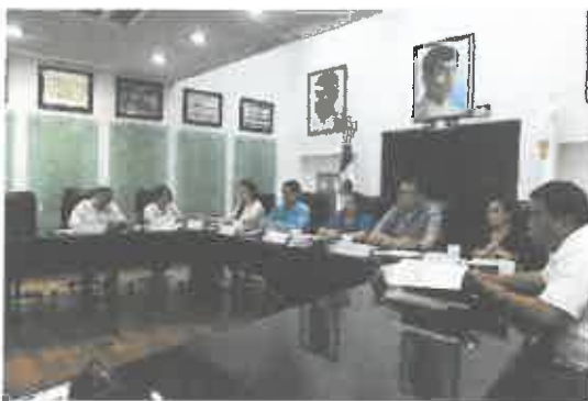
Comparecencia de la Titular de la Secretaría de Turismo.