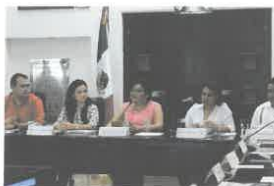
Reunión de la Comisión de Anticorrupción, Participación Ciudadana y órganos Autónomas.