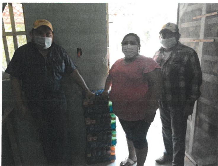
Entrega de Refrescos e insumos solicitado por la alcaldía de la comunidad de Nuevo Xcan, Lázaro Cárdenas.