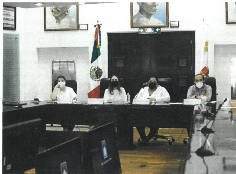
Comisión para la Igualdad de Género