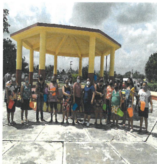
Entrega de regalos a las mamás de kantunilkin en distintas comunidades de Lázaro Cadenas.