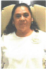
DIP. PAULA PECH VÁZQUEZ PRESIDENTA