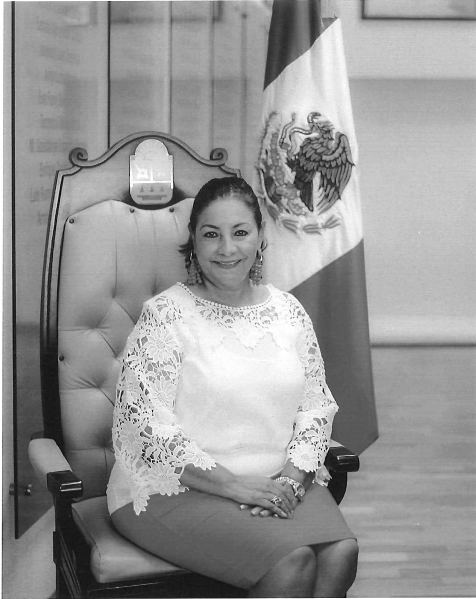
Diputada Eusebia del Rosario Ortiz Yeladaqui Integrante de la XVI Legislatura del Poder Legislativo del Estado de Quintana Roo