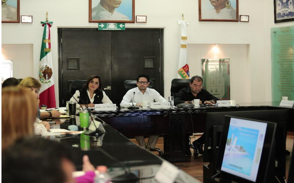
Reunión de la Comisión de Hacienda, Presupuesto y Cuenta y Asuntos Municipales, estudio, análisis y dictaminación de la Ley de Ingresos Municipales de Puerto Morelos