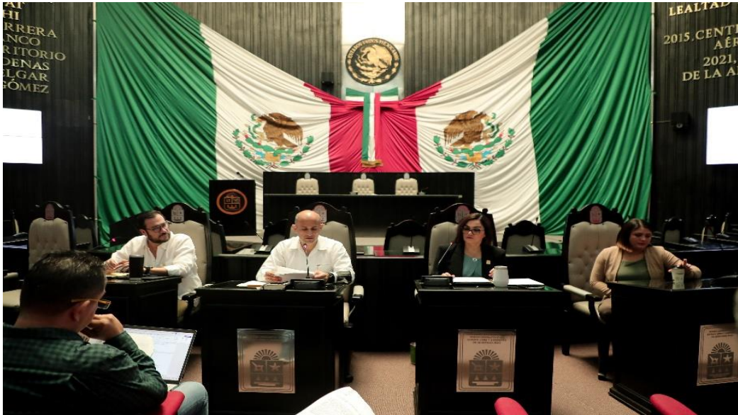
Reunión de la Comisión de Justicia