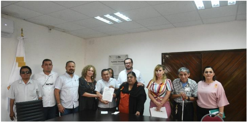
Reunión de Trabajo con la Asociación de Discapacitados