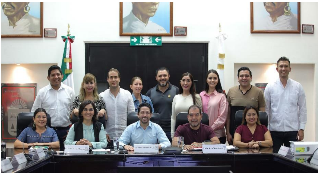
Reunión de la Comisión de Hacienda, Presupuesto y Cuenta y Asuntos Municipales, estudio, análisis y dictaminación de la Ley de Ingresos Municipio de Tulum