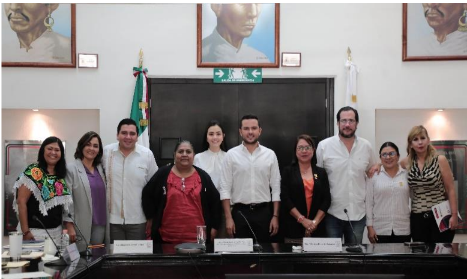
Comisión de Desarrollo Humano, Población y Productividad Comparecencia del Secretario de Desarrollo Social