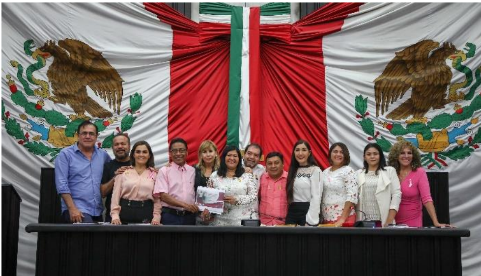
Comisión de Educación, Ciencia y Tecnología Comparecencia del Titular de la Secretaria del Educación