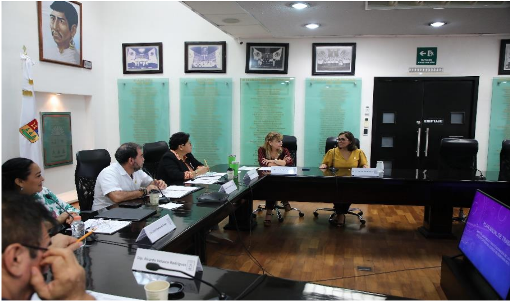
Comisión de Puntos Legislativos