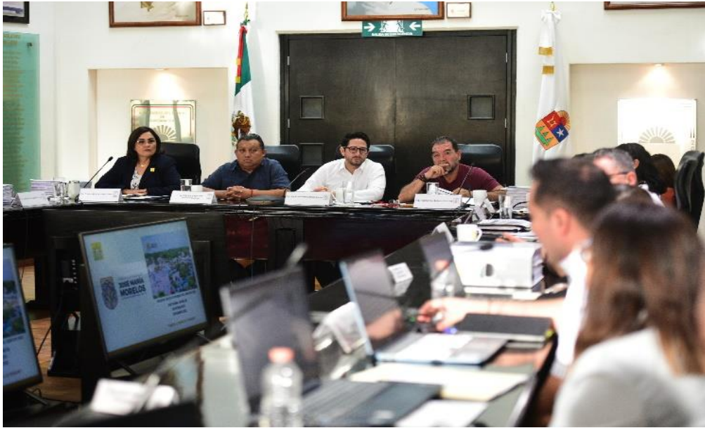
Reunión de la Comisión de Hacienda, Presupuesto y Cuenta y Asuntos Municipales, estudio, análisis y dictaminación de la Ley de Ingresos Municipio de José María Morelos