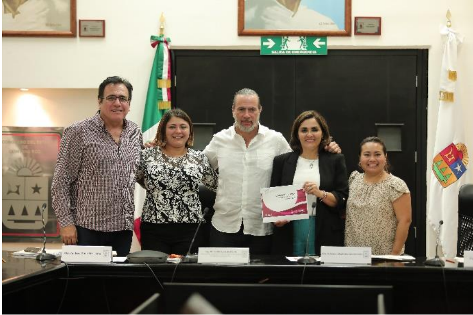
Comparecencia del Titular de la Secretaria de Desarrollo Territorial y Urbano Sustentable (SEDETUS)