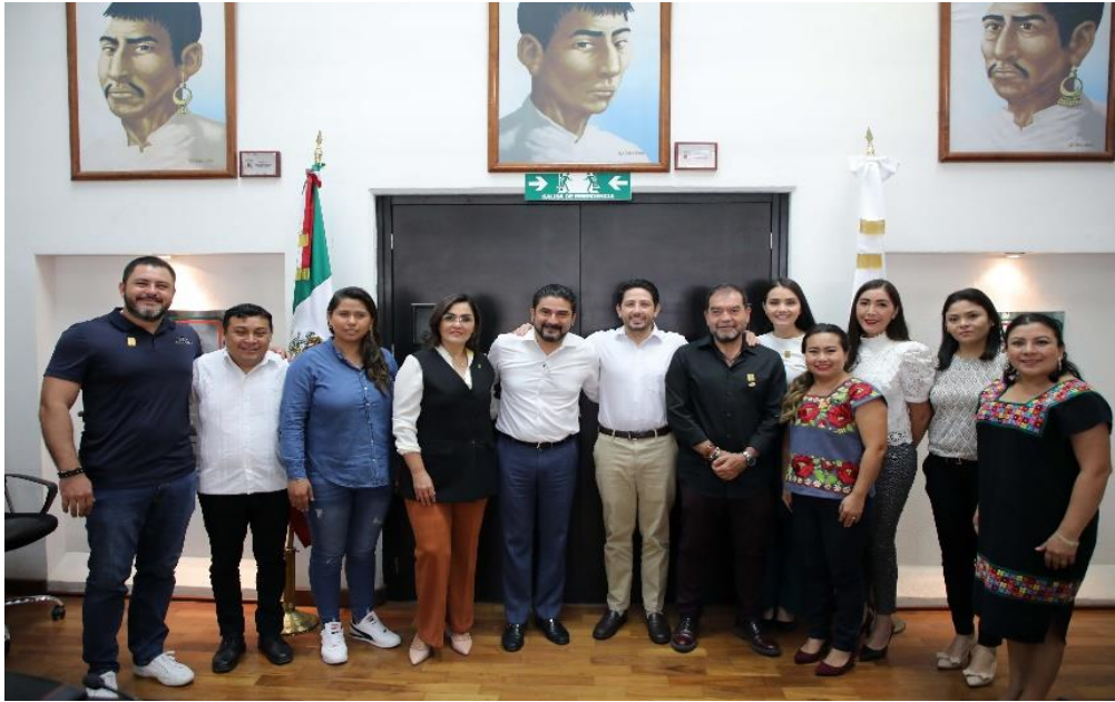
Reunión de la Comisión de Hacienda, Presupuesto y Cuenta y Asuntos Municipales, estudio, análisis y dictaminación de la Ley de Ingresos Municipales de Solidaridad