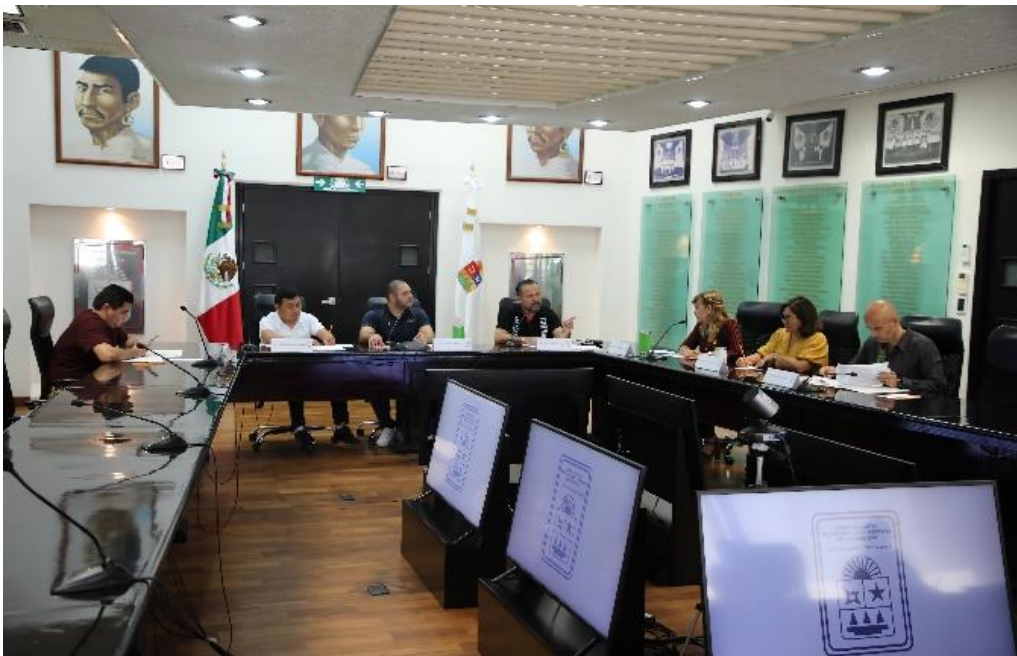
Comisión de Seguridad Pública, Protección Civil y Bomberos