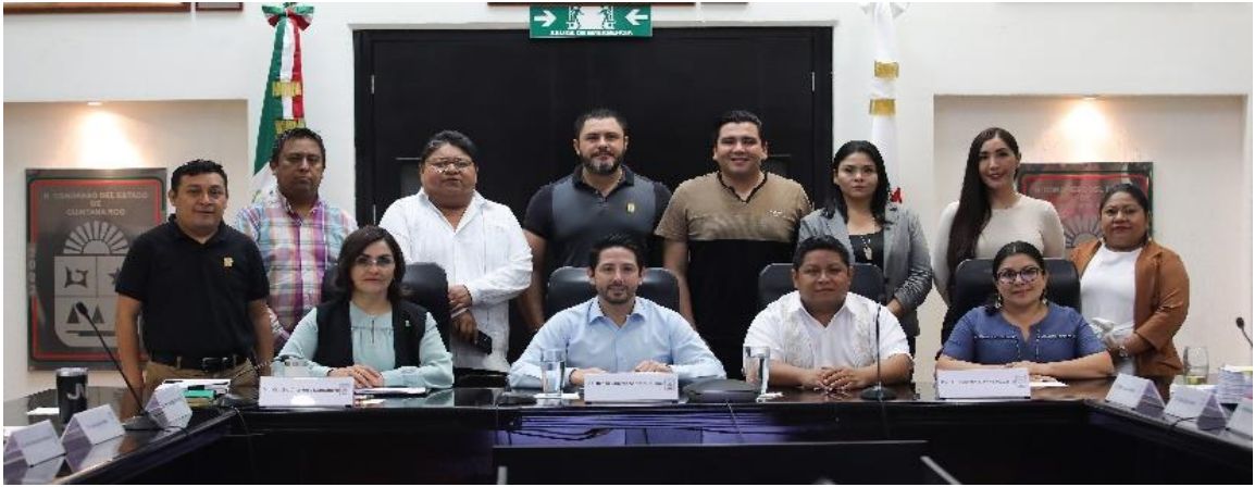
Reunión de la Comisión de Hacienda, Presupuesto y Cuenta y Asuntos Municipales, estudio, análisis y dictaminación de la Ley de Ingresos Municipio de Lázaro Cárdenas