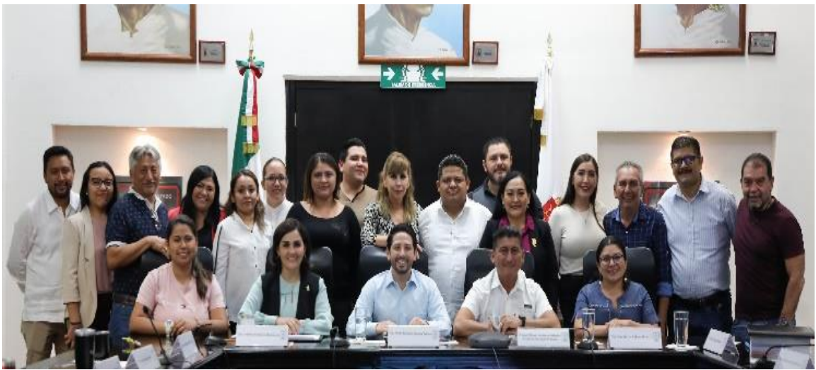
Reunión de la Comisión de Hacienda, Presupuesto y Cuenta y Asuntos Municipales, estudio, análisis y dictaminación de la Ley de Ingresos Municipio de Bacalar