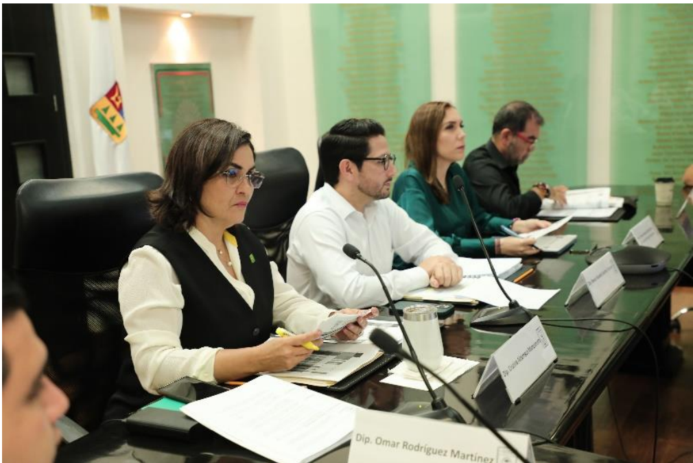
Reunión de la Comisión de Hacienda, Presupuesto y Cuenta y Asuntos Municipales, estudio, análisis y dictaminación de la Ley de Ingresos Municipio de Isla Mujeres