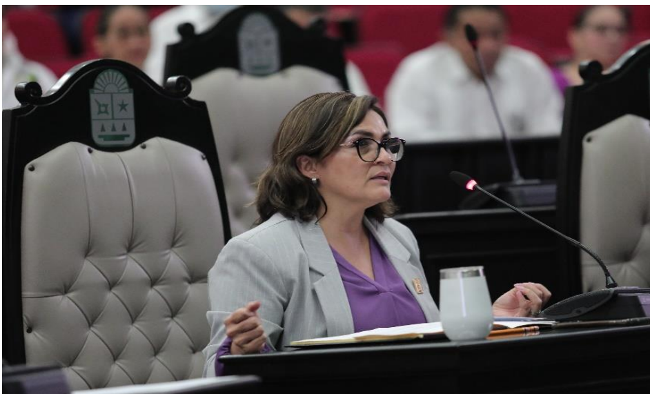
Comisión de Salud y Asistencia Social Comparecencia del Titular de la Secretaría de Salud