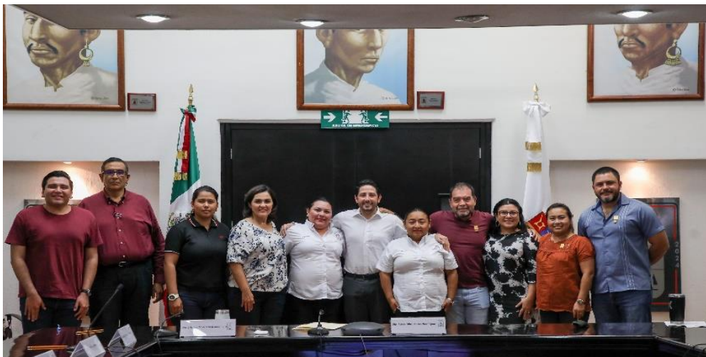
Reunión de la Comisión de Hacienda, Presupuesto y Cuenta y Asuntos Municipales, estudio, análisis y dictaminación de la Ley de Ingresos Municipio de Cozumel