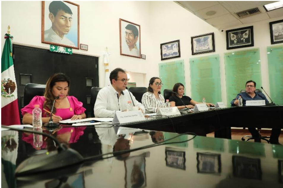
Comparecencia del Titular de la Agencia de Proyectos Estratégicos de Quintana Roo