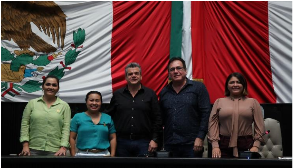
Comisión de Desarrollo Urbano Sustentable y Asuntos Metropolitanos Comparecencia Comisión de Agua Potable y Alcantarillado CAPA