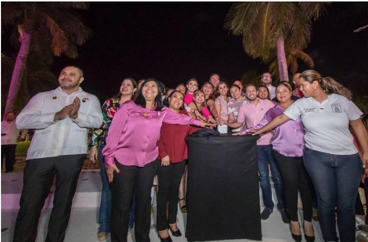
Octubre rosa – Encendido de luces