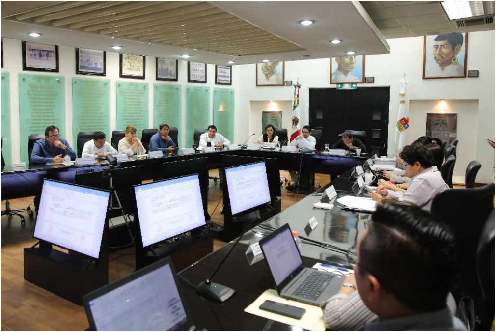
Reunión de la Comisión de Hacienda, Presupuesto y Cuenta y Asuntos Municipales, estudio, análisis y dictaminación de la Ley de Ingresos Municipio de Othón P. Blanco