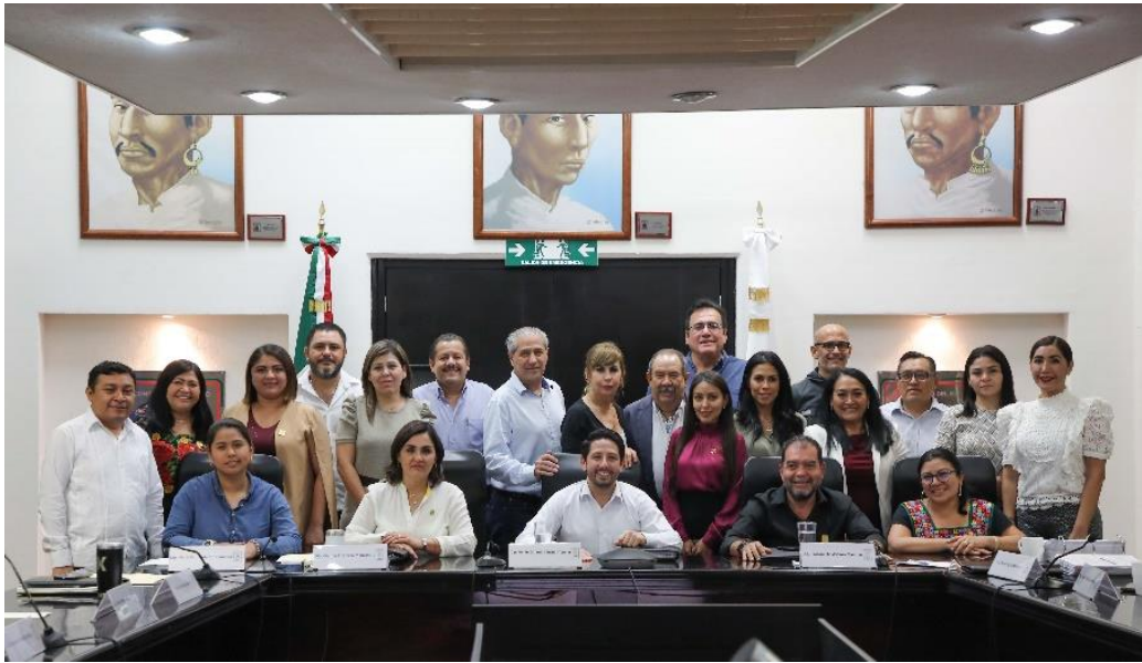
Reunión de la Comisión de Hacienda, Presupuesto y Cuenta y Asuntos Municipales, estudio, análisis y dictaminación de la Ley de Ingresos Municipio de Benito Juárez