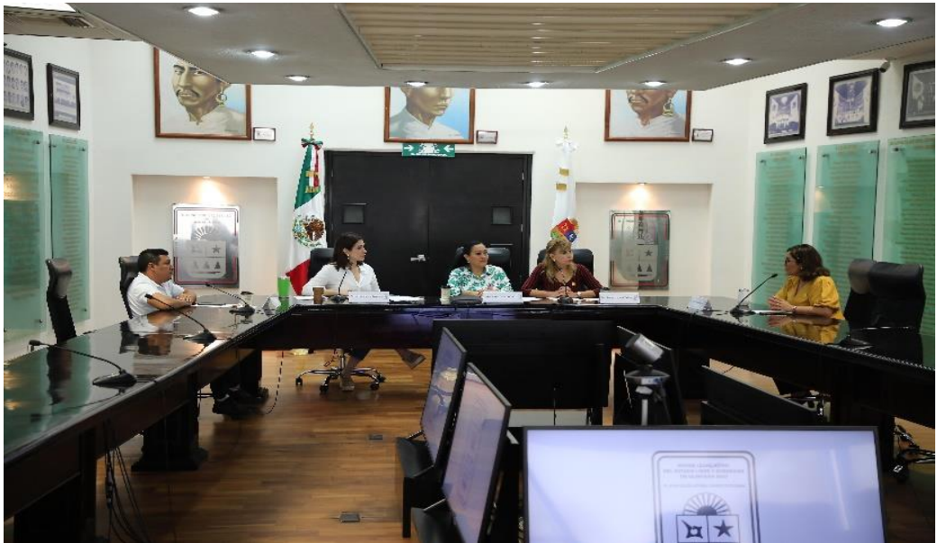
Comisión de Salud y Asistencia Social