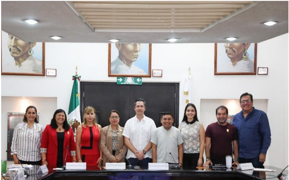
Comparecencia del Titular de Movilidad (IMOVEQROO)