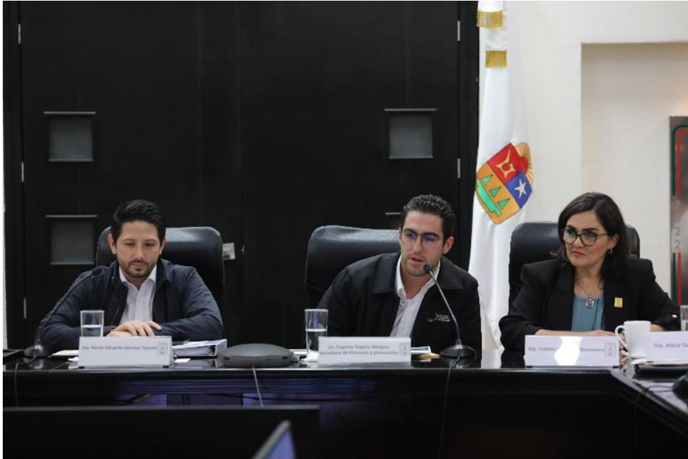
Reunión de la Comisión de Hacienda Presupuesto y Cuenta para estudio análisis y dictaminación de la Ley de Ingresos y Presupuesto de Egresos 2023