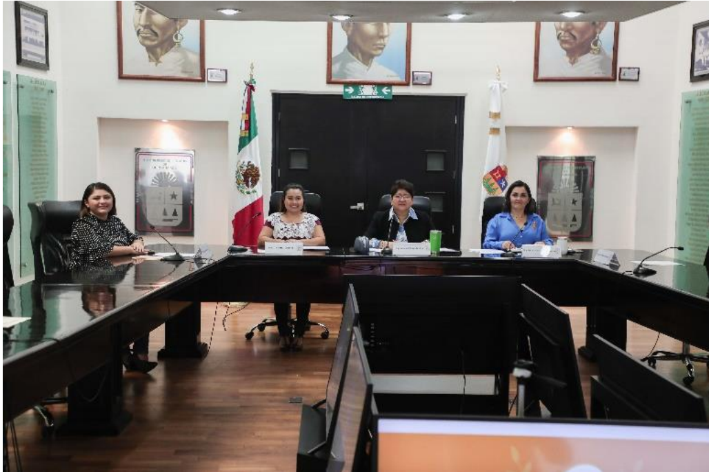
Reunión de la Comisión de Desarrollo Urbano Sustentable y Asuntos Metropolitanos