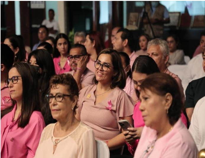
Conversatorio, mes de Sensibilización Contra el Cáncer de Mama