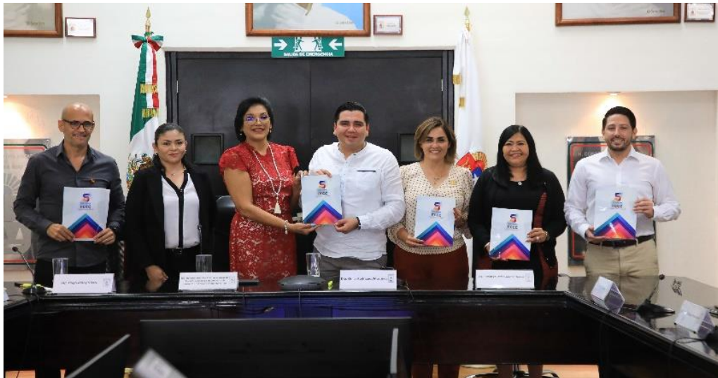
comparecencia de la Fiscalía Especializada Contra la Corrupción