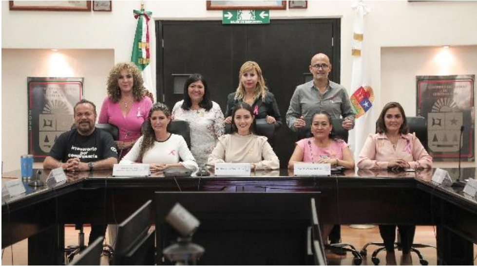
Comisión de Trabajo y Previsión Social Comparecencia de la Titular de la Secretaria del Trabajo y Previsión Social