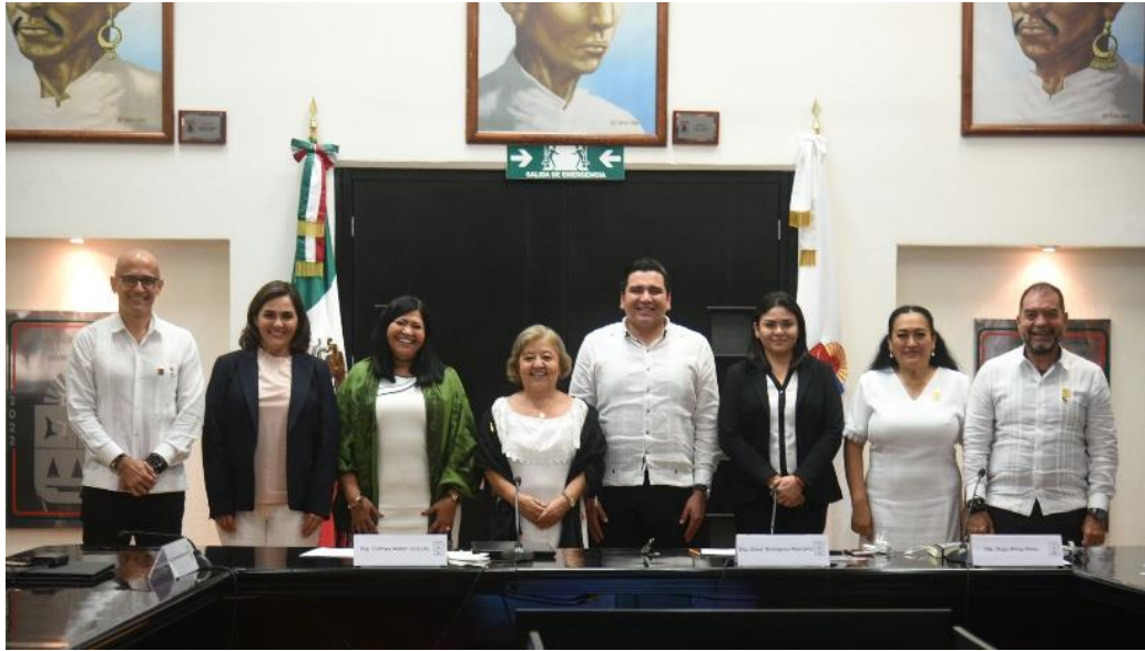
Comisión Anticorrupción, Participación Ciudadana y Órganos Autónomos Comparecencia Secretaria de la Contraloría del Estado