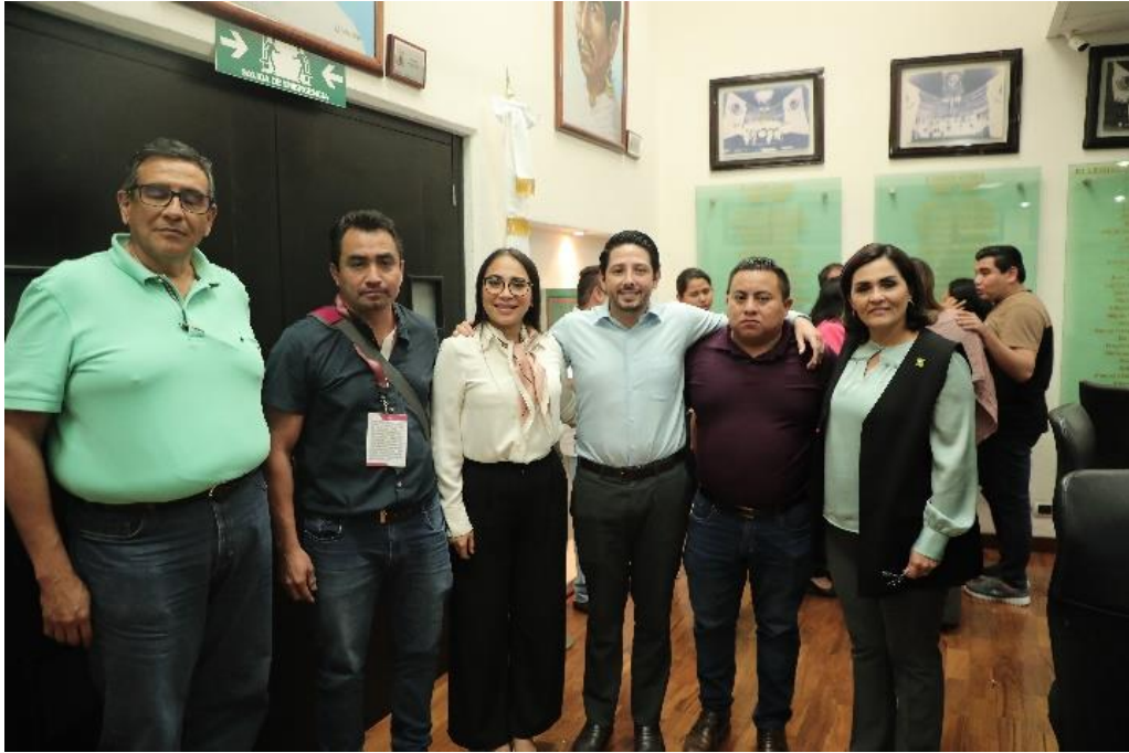
Reunión de la Comisión de Hacienda, Presupuesto y Cuenta y Asuntos Municipales, estudio, análisis y dictaminación de la Ley de Ingresos Municipio de Felipe Carrillo Puerto