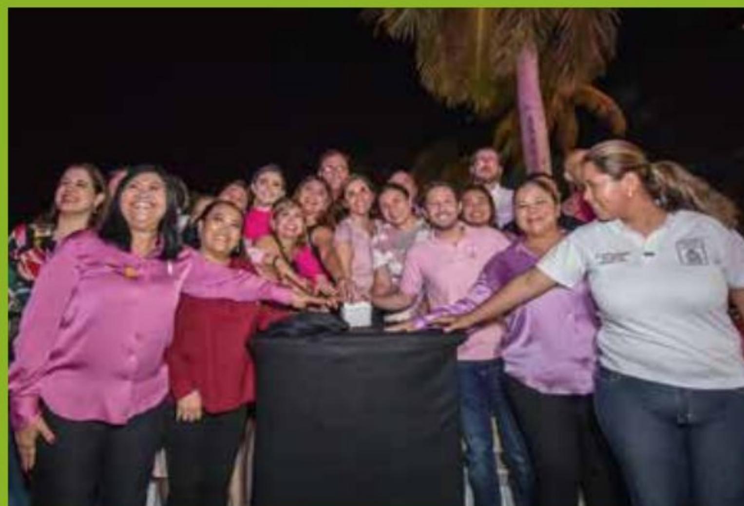
11 / Octubre / 2022. En el marco del mes rosa, encendimos las luces del Poder Legislativo del Estado para visibilizar la campaña de lucha contra el cáncer de mama.