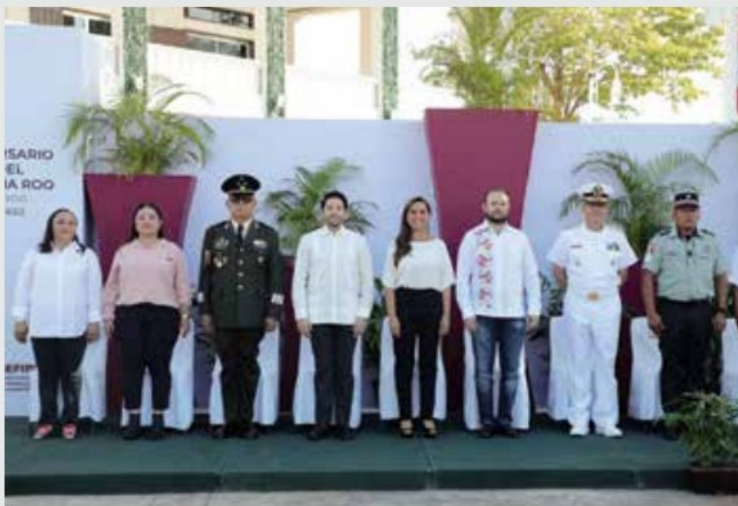
30 / Noviembre / 2022. Ceremonia Cívica del 235 Aniversario del Natalicio del Lic. Andrés Quintana Roo.