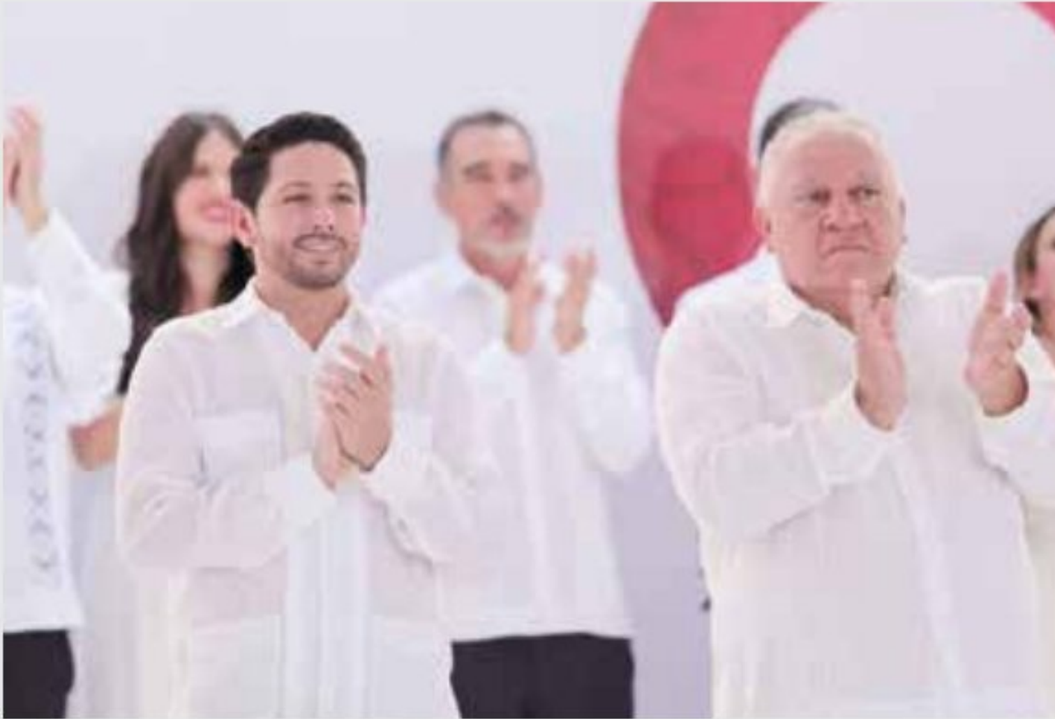
25 / Septiembre / 2022. Acompañé a la Gobernadora Mara Lezama en su primer mensaje a la ciudadanía Quintanarroense.