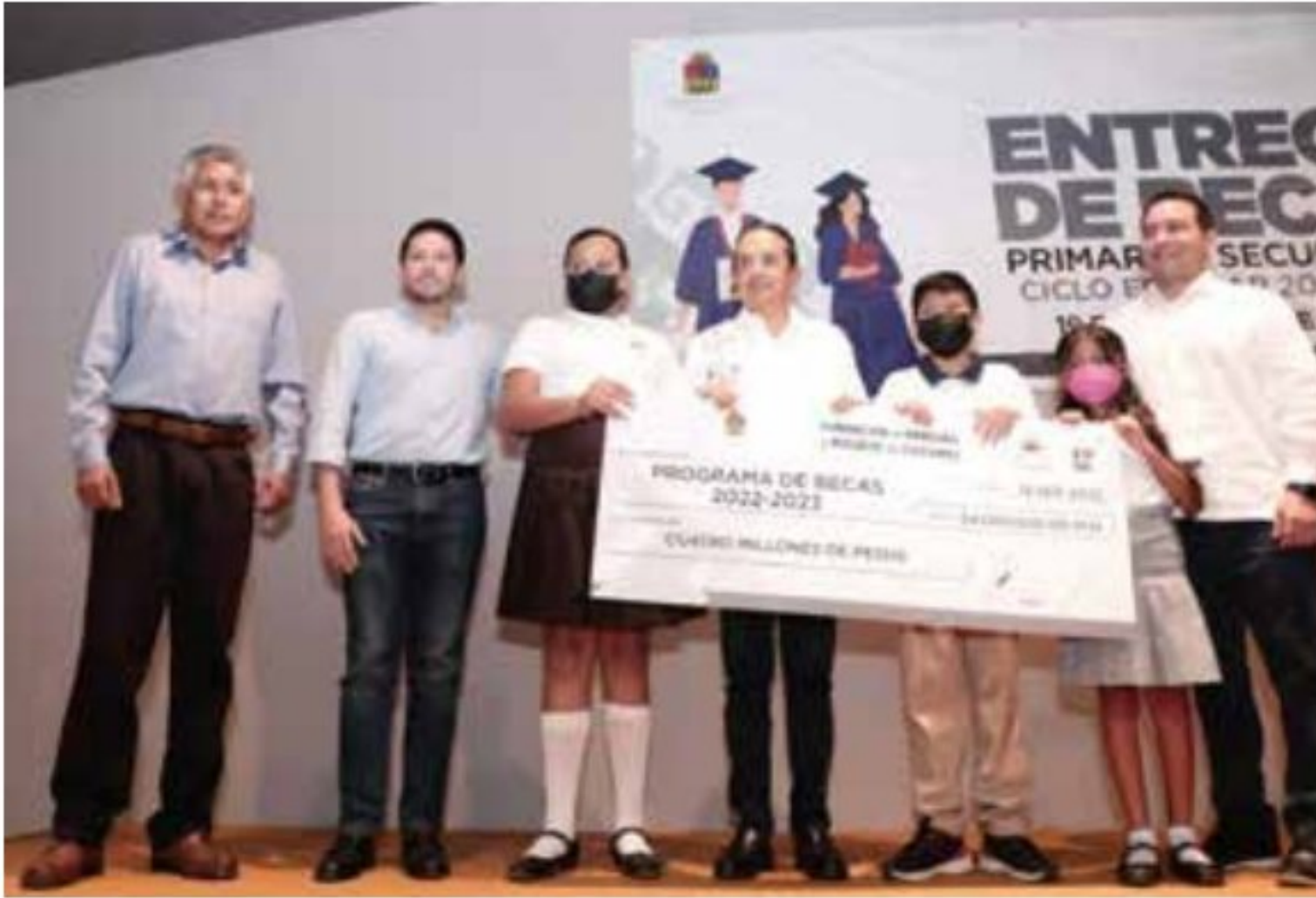
20 / Septiembre / 2022. Acompañé al Gobernador del Estado y a la Presidenta Municipal de Cozumel a la Entrega de Becas para alumnos cozumeleños de primaria y secundaria del ciclo escolar 2022-2023, organizado por la Fundación de Parques y Museos de Cozumel