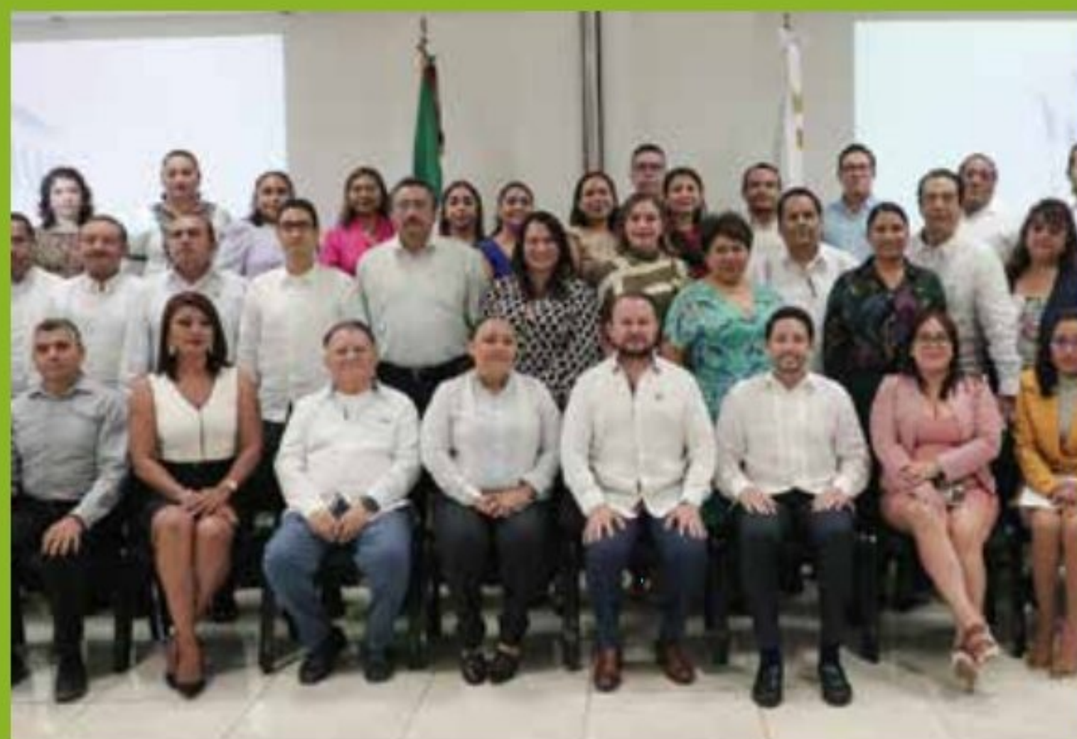
14 / Octubre / 2022. Acudí a la conmemoración del 48 Aniversario de la Instalación del Poder Judicial del Estado de Quintana Roo.