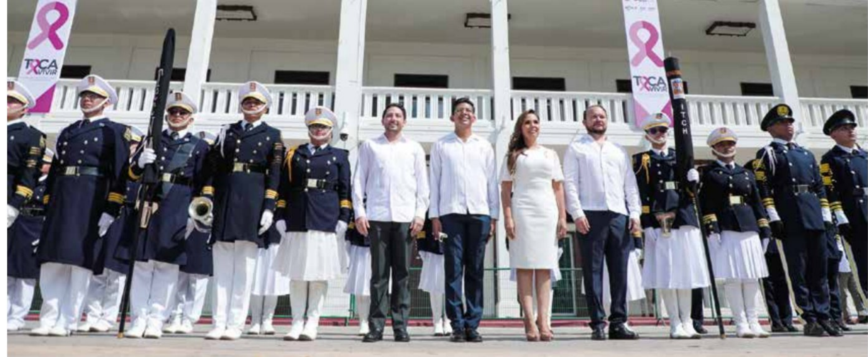
8 / Octubre / 2022. Asistí a la Ceremonia de Izamiento de nuestra Bandera con motivo del XLVIII Aniversario de Quintana Roo como Estado Libre y Soberano.