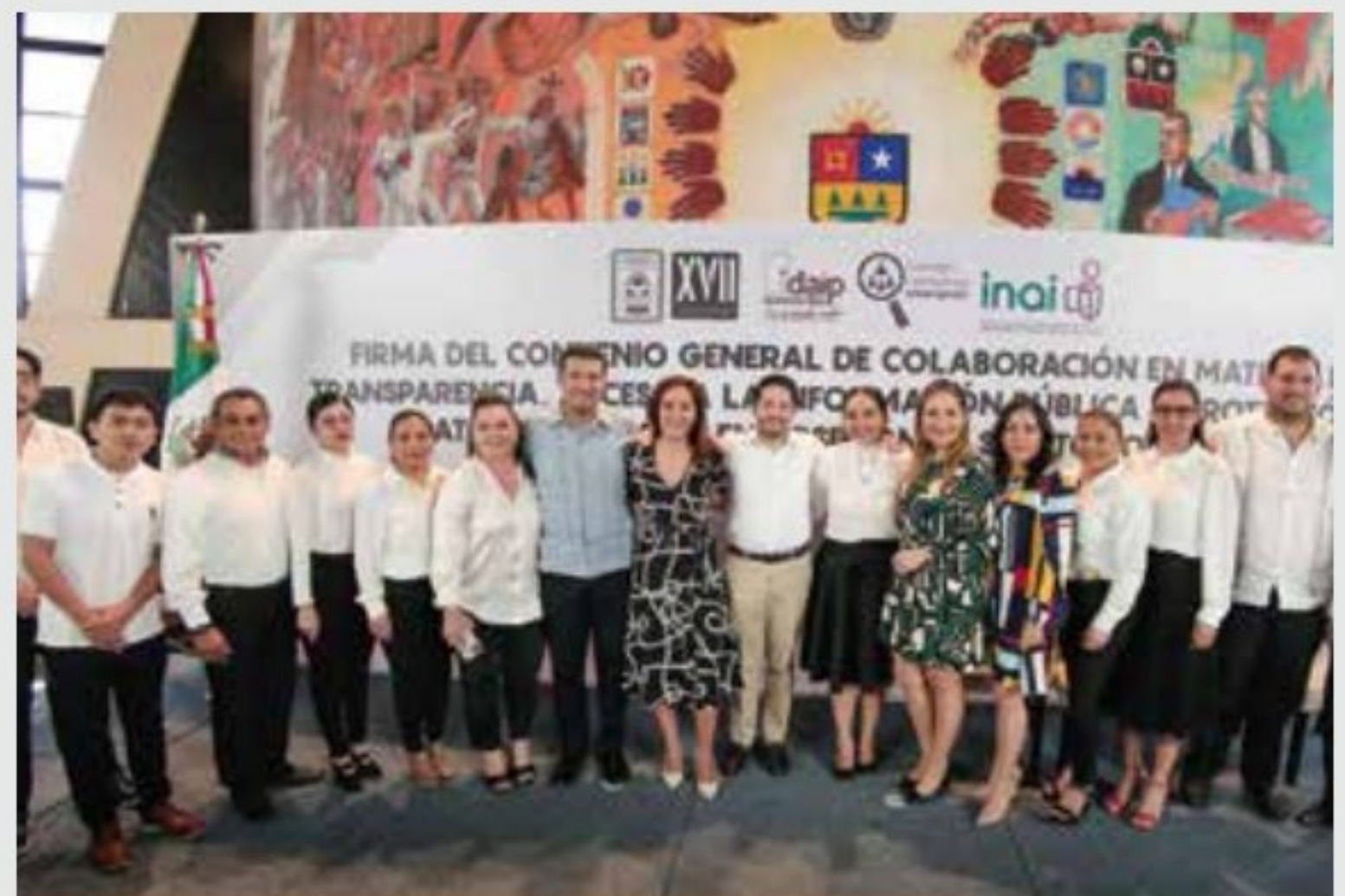
6 / Diciembre / 2022. Firma de Convenio de Colaboración en materia de transparencia con el IDAIPQROO y el INAI