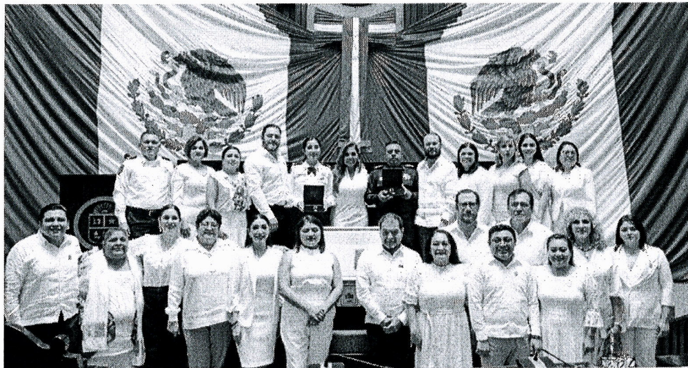
SESIÓN SOLEMNE CON MOTIVO DE LA ENTREGA DE LA MEDALLA AL "MÉRITO POLICIAL DE QUINTANA ROO". 19. DIC. 2023