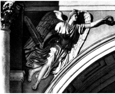
Obrázek 3: Socha "génia"

Poslední jsou spojeni obloukem (obr. 2) se sochami „géníů“ (obr. 3), kteří jakoby sedlají dvě hlavní vládní instituce období dynastie Romanovců. Zmíněný oblouk původně posloužil k zrození známé předrevoluční slovní hříčky: „Svinský Synod a lopežný Senát žijí z dárků“ (Čeština nemá slovní hříčku odpovídajícího smyslu. Vtip je schovaný, kromě expresivního pojmenování činnosti institucí, v posledním slově věty v originále: „Скотейший Синод и грабительствующий Сенат живут подарками“ – подарками = dárky; подарок = dárek. Под арками = pod oblouky – pozn. přek). Oficiální názvy těchto imperátorských institucí byly: Posvátný synod a Vládnoucí senát. (A zde je druhá část vtipu: Святейший ( svjatějšij ) x Скотейший ( skotějšij ) = nejsvětější x svinský – synod; Правительствующий ( pravitelstvujščij ) x грабительствующий ( grabitelstvujščij ) = vládnoucí x kradoucí – senát – pozn. přek). Tak v hříčce se obehrává souznění: Svinský ve vztahu k Synodu; a kradoucí ve vztahu k senátu (vládnoucí činovníci v Rusku vždycky kradli).