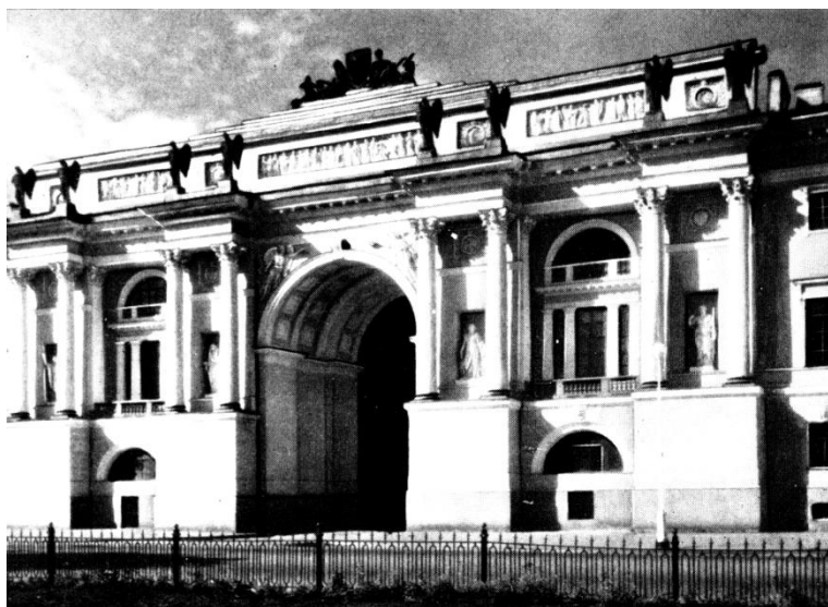
Obrázek 2: Oblouk sjednocující Senát a Koncil se dvěma sochami "géniů".

Přes mystickou vazbu „jako živých mramorových lvů strážných“, z nepochopitelných důvodů, z nichž se v historii globální civilizace odněkud zjevilo židovstvo (s Jevgenijem jsme se rozloučili v předvečer povodně), se otevírá druhá smyslová řada básně. Mystika Puškinem popsané scény je v tom, že na Senátním náměstí existují dvě budovy se lvy u vchodu. Jsou umístěni, jak je vidět z uvedeného na obr. 1, na dvou protilehlých rozích náměstí: jihovýchodním, daleko od „Měděného jezdce“ je dům Lobanova – Rostovského, a na severozápadním, blízko „Měděnému jezdci“, je Lavaljův dům, který tvoří jediný architektonický komplex se senátem a Koncilem.