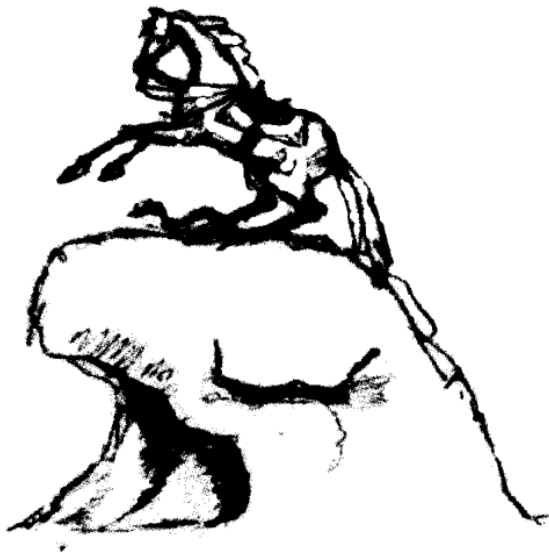
Obr.5 „Měděný jezdec“ bez Petra (neviditelný jezdec). Kresba A.S.Puškina. Zdroj: Kompletní dílo Puškina, 1996, svazek 18.

Jak je vidět z obrázku, téměř přesně opakuje stávající čítankovou kopii známého Falconeho mistrovského díla, s výjimkou toho, že figura „Jezdce“ na něm chybí. Neviditelný jezdec (obraz globálního nadžidovského prediktora uskutečňujícího řízení přes jemu podřízený biblický egregor), osedlávající koně (symbol mnohonárodnostního ruského davu), dle našeho názoru je nejzářivějším (jinotajně podaným) příkladem básníkova vyjádření v umělecké (mimolexikální) formě natolik složité pro popis v lexikálních formách „královské informace“, nedostupné pro pochopení nejen Puškinových současníků, ale i těm, kdo již žije a jedná v kvalitativně jiném informačním stavu.