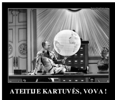
ATEITIJE KARTUVĖS, VOVA !

Dar vienas projektas — taip vadinamas „Ruso-imperinis“. Jis suponuoja, kad rusai — tai tik išskirtinai etniniai velikorosai (didžiarusai), kad išskirtinai jie — valstybę sudaranti tauta, o visos kitos tautos — „jaunesnieji broliai“, kurių atstovai neturi kištis į bendrus valstybės valdymo klausimus be velikorosų (didžiarusų) etninės „elitos“ kvietimo, bet turi gyventi pavaldume valstybės, kurioje valdantysis „elitas“ praktiškai visiškai — etniniai velikorosai. Ideologinį apvalkalą jam ketina sukurti vedinių mokymų šalininkai. Visgi tokio projekto inicializacijai, kai rašė V.S. Vysockis (B.C. Высоккий), „išties pašėlusių mažoka...“. Be to, jo inicializacijos procesas velikorosų (didžiarusų) nacistų neišvengiamai išprovokuos „kitataučius“ nacistus aktyvumui su tikslu realizuoti jų atsiskyrimo Rusijos projektus. Tai yra, šitas projektas iš pat pradžių gali būti palaikytas CŽV ar Valstybės departamento, kadangi veda link RF (Rusijos Federacijos) suskaldymo ir jos suskaldytų dalių pavergimo istoriškai trumpu laiku. Ir maža to, CŽV ir Valstybės departamentas stumtelės būtent link jo įgyvendinimo, o liberalai — „antifašistai“ visus įtikinės, kad būtent jis ir įgyvendinamas Rusijoje.