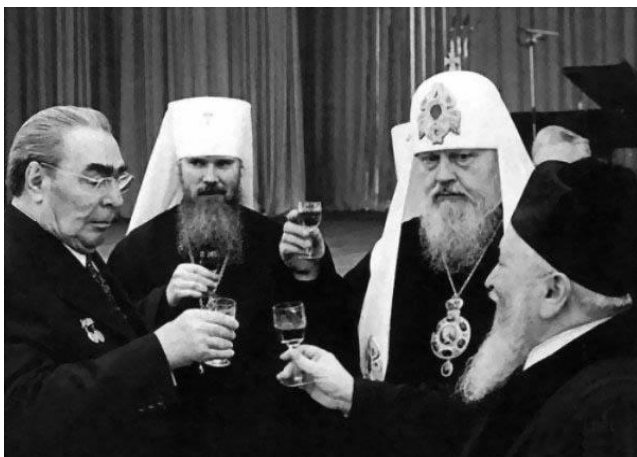
Иерархи идеологической власти библейского проекта в СССР в полном составе на приѣме в Кремле в честь 60-летия Великой октябрьской социалистической революции.

Но если соотноситься со схемой управления толпо-«элитарным» обществом «концептуальная власть — идеологическая власть — государственность — общество», то в 1917 г. смены концептуальной власти не было. Концептуальная власть осталась прежней — властью хозяев библейского проекта глобализации, однако при этом идеология