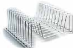
Soporte de discos