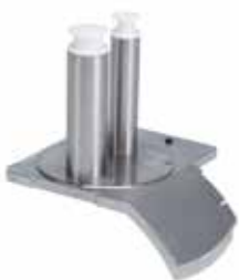
Cabezal de tubos