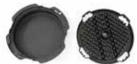
Kit de limpieza de rejillas