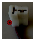
Boîtier de connecteur mâle