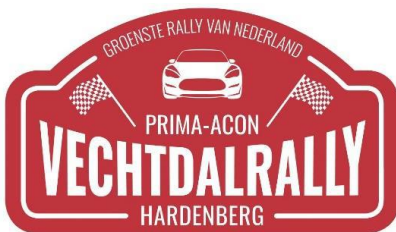
BIJLAGE 5: Stickers en locatie van de extra reclame (indien afwijkend van het SRR art. 18.8.)