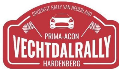
BIJLAGE 1: Tijdschema Prima-ACON Vechtdalrally