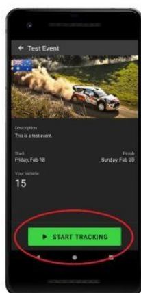
Click start tracking when beginning recce.

When logged into the event with your code, the main screen will display your current speed and two odometers. Both odometers can be reset by pressing and holding the mileage.