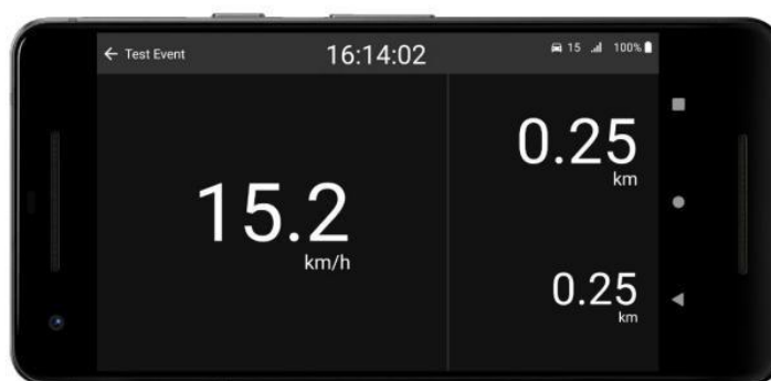
Main Screen off stage when tracking.

Klicken Sie auf „start tracking“ sobald Sie mit der Besichtigung beginnen.