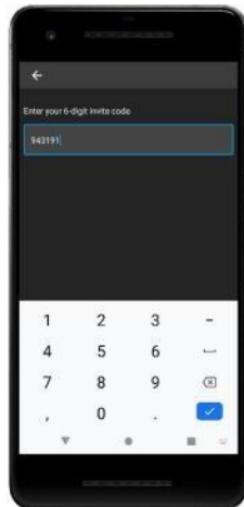
Enter unique code.