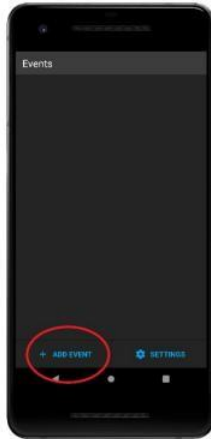
Main Screen when app is opened. Click "add event".