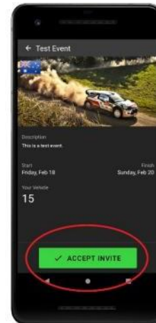
Click accept invite.

Hauptbildschirm wenn die App geöffnet wird. Klicken Sie auf „Add event.“