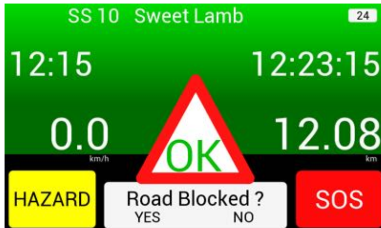
BILD 15: Bildschirm bei „OK“ Bestätigung – Frage: „Strecke blockiert?“ – Antwort noch notwendig

Damit wird signalisiert, dass keine Hilfe notwendig ist und Sie und Ihr Fahrzeug „OK“ sind . Es erscheint automatisch unter „OK“ die Frage: Road Blocked? (Strecke blockiert?) . Wählen Sie „Yes“, wenn Ihr Fahrzeug die Strecke blockiert und „No“, wenn die Strecke frei ist und Sie für die nachfolgenden Crews keine Gefahr darstellen.