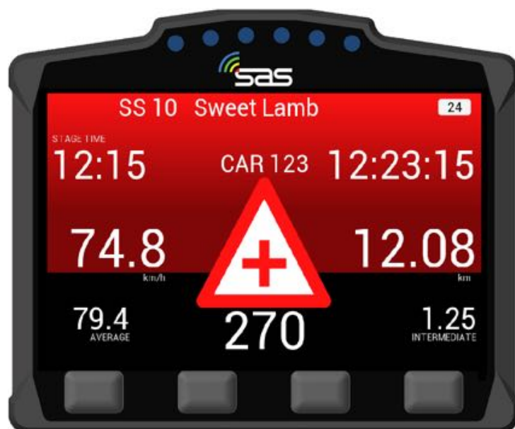
BILD 23: Warnung - Fahrzeug steht auf oder neben der Strecke, Status SOS - Alarm ausgelöst

Wenn Sie sich einem Fahrzeug nähern, das vor Ihnen auf oder neben der Strecke steht, wird automatisch ein Warndreieck und zusätzlich der Status des verunfallten Fahrzeuges angezeigt. In diesem Fall wurde von den verunfallten Fahrern ein Alarm ausgelöst und die SOS-Taste gedrückt [Bild 23].