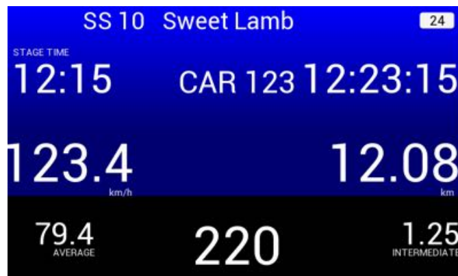
Bild 26: Empfang Überholanfrage vorausfahrendes Fahrzeug - „Receiving Overtake“

In diesem Fall möchte das Fahrzeug mit der Nummer 123 überholen und befindet sich in einer Entfernung von ca. 220 m.