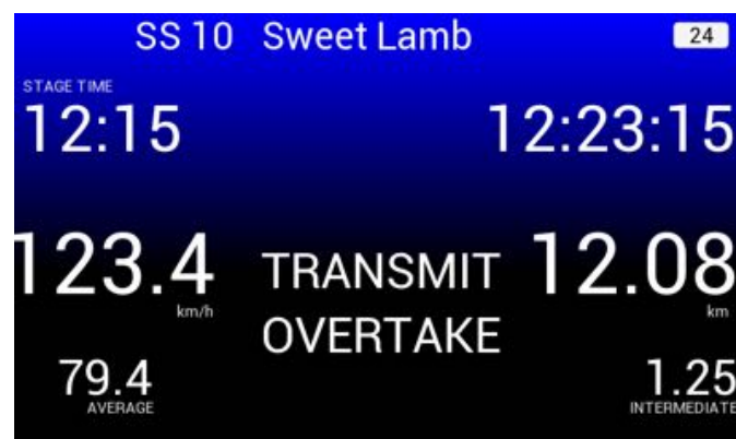
BILD 25: Übertragung Überholanfrage an auflaufendes Fahrzeug - „Transmit Overtake“

(HINWEIS: Dies funktioniert nur, wenn sich das vorausfahrende Fahrzeug innerhalb eines voreingestellten Bereiches befindet).