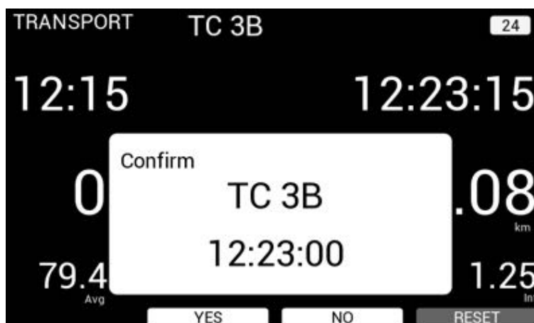
BILD 8: Anzeige Bezeichnung ZK und Check-in-Zeit – Bestätigung ausstehend (Confirm)

Auf dem Bildschirm wird die Zeit bis zum Ablauf der Prüfminute bzw. bis zum Zeitpunkt der Erkennung einer Geschwindigkeit durch das System angezeigt.