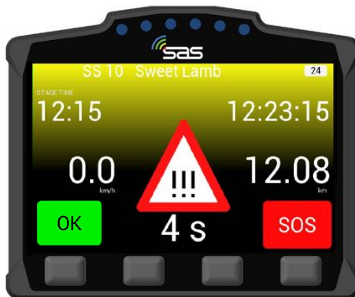
BILD 14: Warnhinweis wird gesendet ( HAZARD ) – OK oder SOS muss noch bestätigt werden