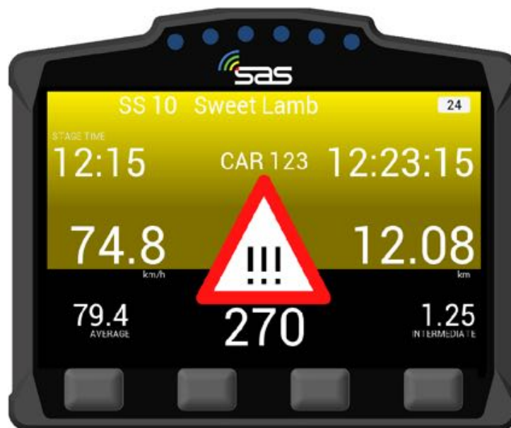
BILD 21: Warnung - Fahrzeug steht auf / neben der Strecke, Status noch nicht bestätigt HAZARD

Nähern Sie sich diesem Fahrzeug vorsichtig, da die Strecke teilweise oder komplett blockiert sein könnte [Bild 21].