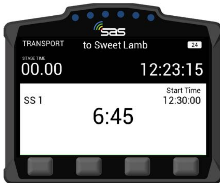
BILD11: Countdown zum Start der Wertungsprüfung

Zu Ihrer WP Startzeit wechselt der Bildschirm auf GRÜN, zeigt „GO“ an und Sie können in die Wertungsprüfung starten-[ BILD 12 ].