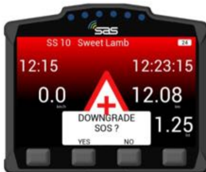
BILD 20: Frage: “SOS-zurücksetzen bzw. herabstufen?” – Antwort noch notwendig

Wenn Sie „OK“ gedrückt haben müssen Sie dies nochmals bestätigen [ Bild 20 ]