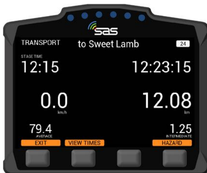
BILD 3: Transport-Modus – EXIT / ANZEIGE VON ZEITEN / AUSLÖSUNG EINES MANUELLEN ALARMS

Hinweis: Die Taste „Options“ ist nicht verfügbar, wenn Sie u.a. in der Nähe einer Zeitkontrolle sind (oder auch zu anderen Zeiten, abhängig von der Veranstaltung).