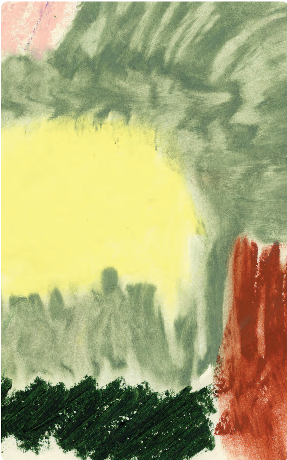
Nabii Azab, Untitled (détail) , 2021